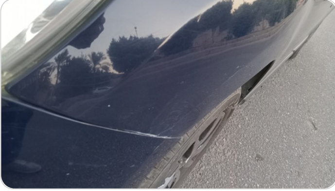
الرفرف الأمامي شمال : فبريكة (خرابيش - خبطات)