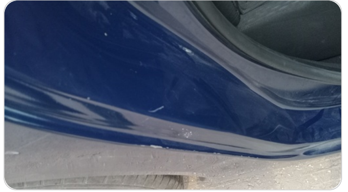
دواخل وقوائم باب خلفي يمين : فبريكة (خرابيش)