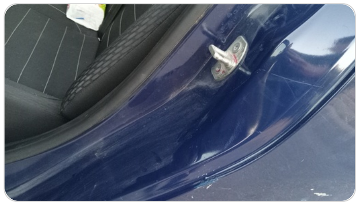
دواخل وقوائم باب الخلفي شمال : فبريكة (خرابيش)