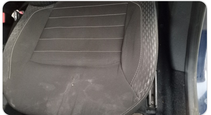
فرش كرسي أمامي شمال : قطع / كسر / شرخ / تلف