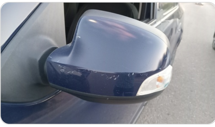
مرآة الباب الأمامي شمال : فبريكة (خرابيش)