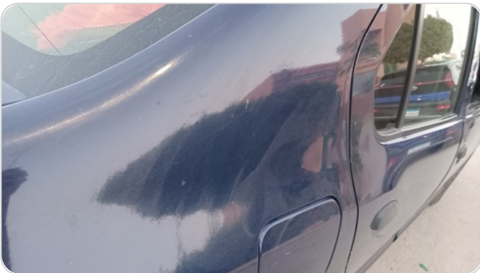
قائم خارجي خلفي يمين : فبريكة ( خرابيش )