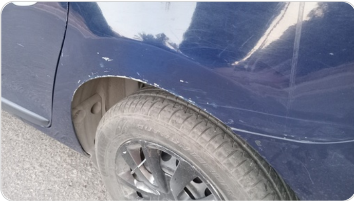
الرفرف الخلفي شمال : فبريكة (سمكره على البارد)