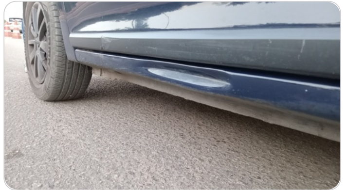
العتب السفلي شمال : فبريكة (خبطات)