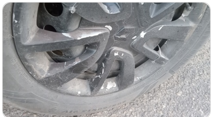
حالة الجنوط الخلفي : تجريحات بسيطة