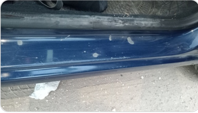
دواخل وقوائم باب أمامي يمين : فبريكة (خرابيش)