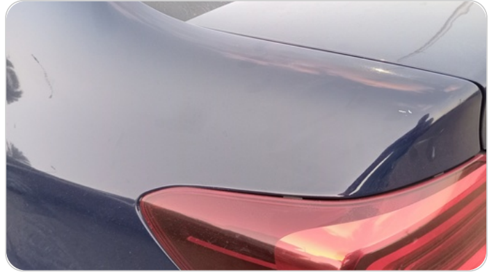
قائم خارجي خلفي شمال : فبريكة (خرابيش)