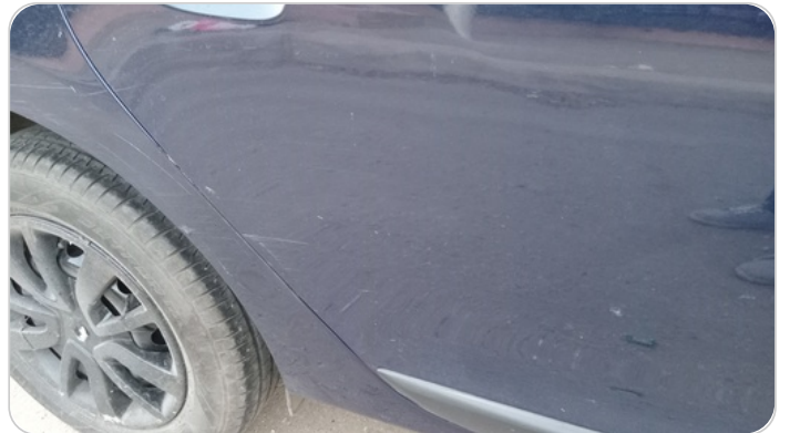
الباب الخلفي يمين : فبريكة (خرابيش)