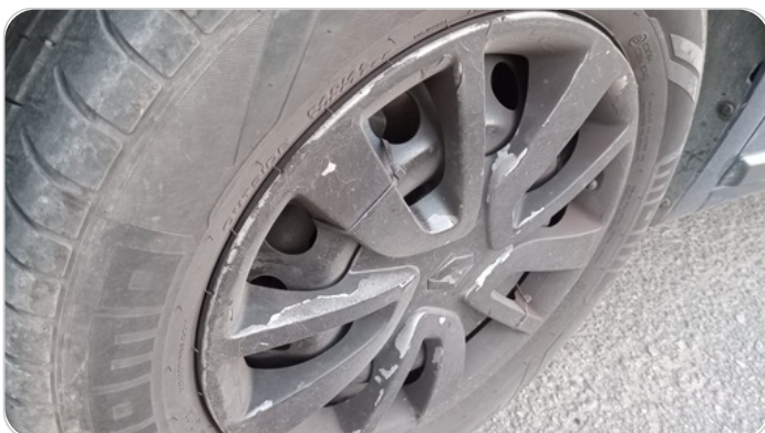
حالة الجنوط الأمامي : تجريحات بسيطة