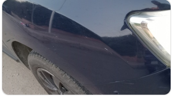
الرفرف الأمامي يمين : فبريكة (خرابيش)