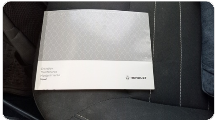
كتيب الضمان : موجود