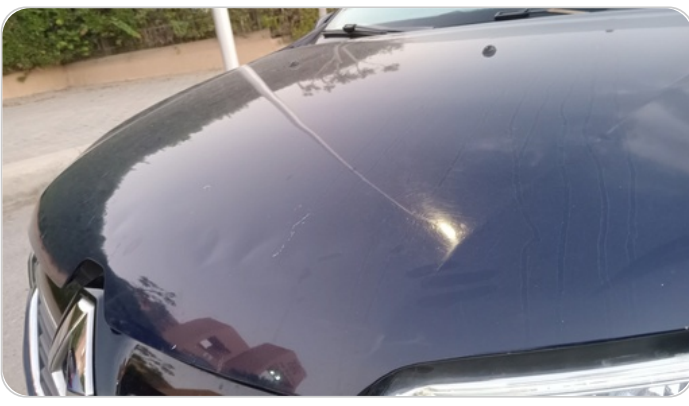
الكبوت : فبريكة (خرابيش - خبطات)