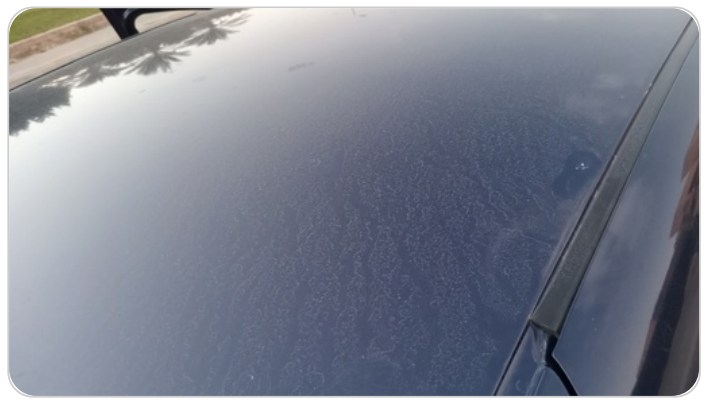
السقف : فبريكة (خرابيش)