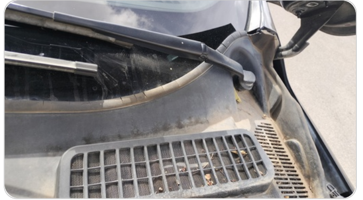
حالة التورييدو : كسر