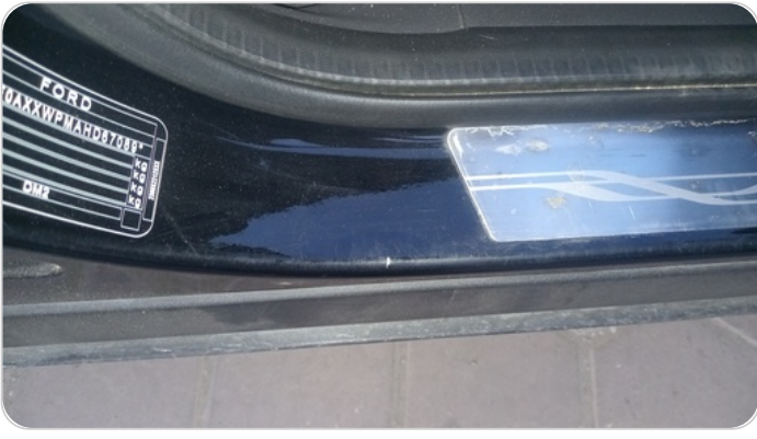
دواخل وقوائم باب أمامي يمين : فبريكة (نقرة)