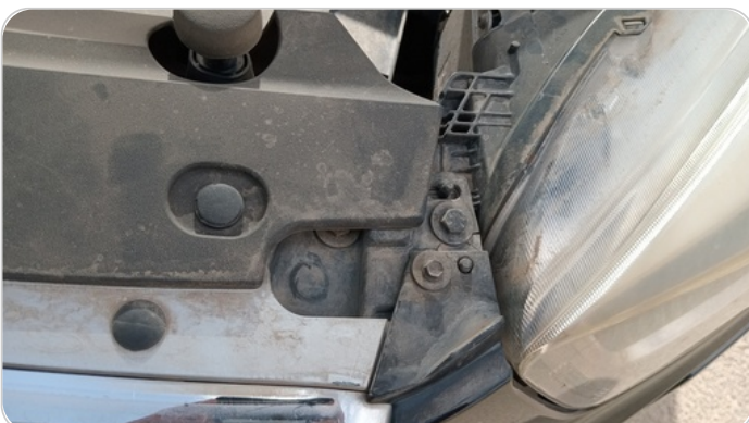
الكشاف الأمامي شمال : كسر في قواعد الكشاف