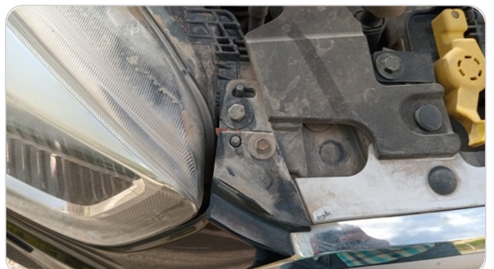
الكشاف الأمامي يمين : كسر في قواعد الكشاف