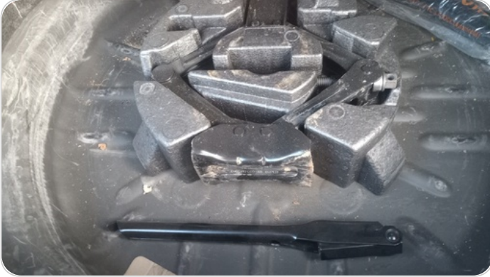
العدة وأدوات الأمان : متوفرة ( بحالة جيدة )