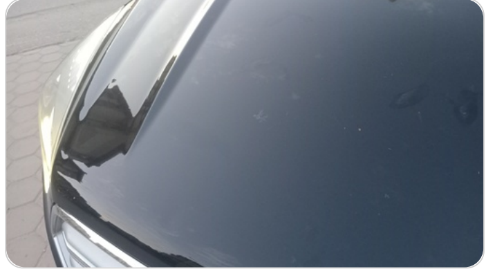
الكبوت : فبريكة ( خرابيش )