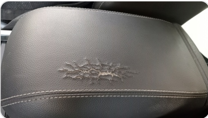
الكونسول الوسط : قطع / كسر / شرخ / تلف