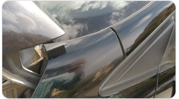
قائم خارجي أمامي شمال : فبريكة (خرابيش)