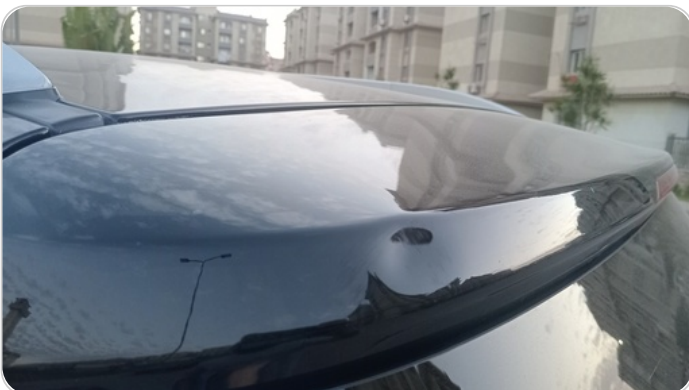
باب الشنطة : فبريكة ( خرابيش _ خبطات )