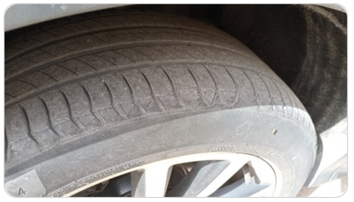
حالة الكاوتش الخلفي : النقشة متآكلة