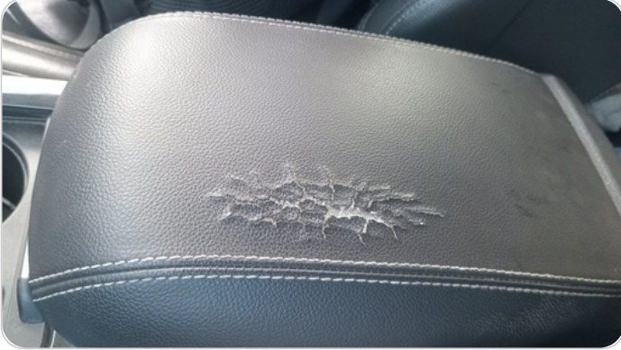
الكونسول الوسط : قطع / كسر / شرخ / تلف