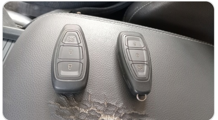
الريموت / المفتاح الاضافي : يعمل بكفاءة