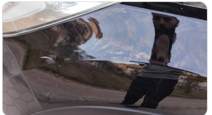
الرفرف الأمامي شمال : فبريكة ( خرابيش )