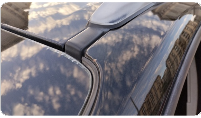
قائم خارجي أمامي شمال : فبريكة (خرابيش)