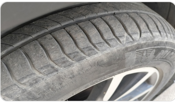
حالة الكاوتش الأمامي : النقشة متآكلة