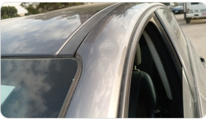
قائم خارجي أمامي شمال : فبريكة (خبطات)