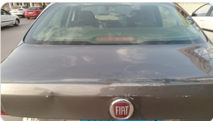
باب الشنطة : فبريكة (سمكره على البارد)