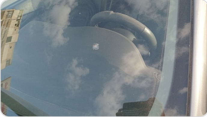
زجاج السيارة الأمامي : نقرة