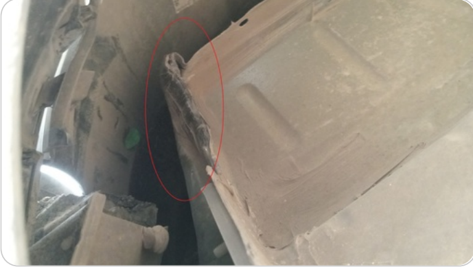
حوض الشنطة من اسفل : صدمة بسيطة