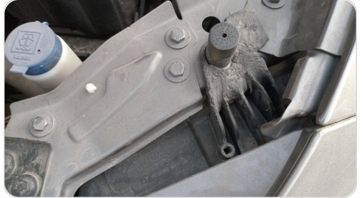
الكشاف الأمامي شمال : كسر في قواعد الكشاف