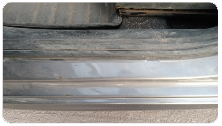
دواخل وقوائم باب أمامي شمال : فبريكة (خرابيش)