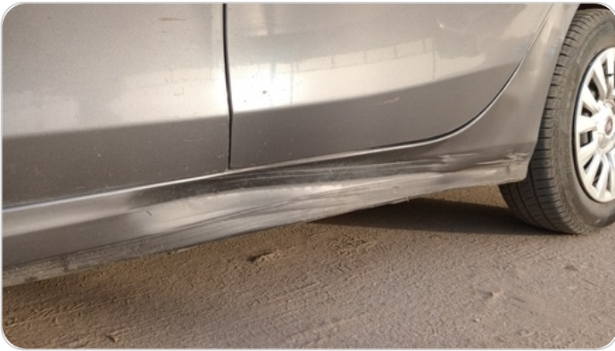
العتب السفلي شمال : فبريكة (خرابيش - خبطات)