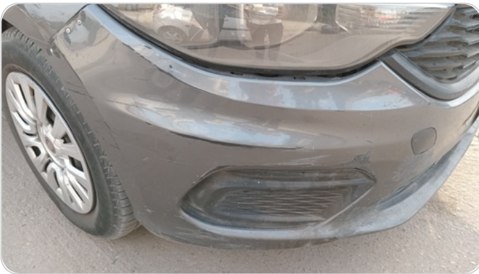
الاكصدام الأمامي : فبريكة (كس)