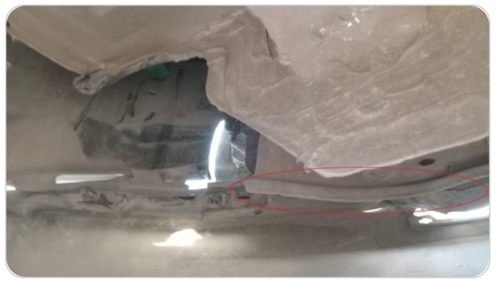
ستارة شنطة خلفية : صدمة بسيطة