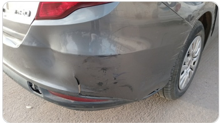
الاكصدام الخلفي : فبريكة (كس)