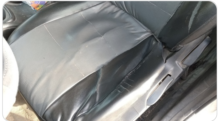
فرش كرسي أمامي شمال : قطع / كسر / شرخ / تلف