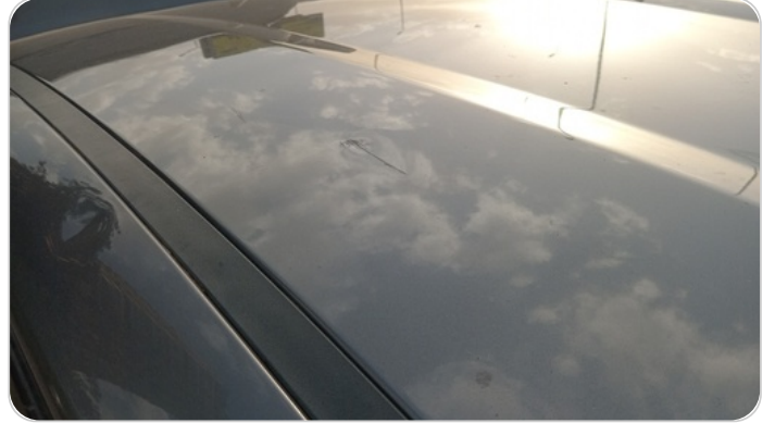
السقف : فبريكة (خرابيش)