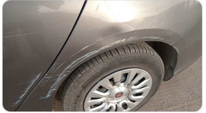
الرفرف الخلفي شمال : فبريكة (خرابيش - خبطات)