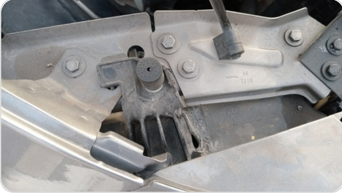
الكشاف الأمامي يمين : كسر في قواعد الكشاف