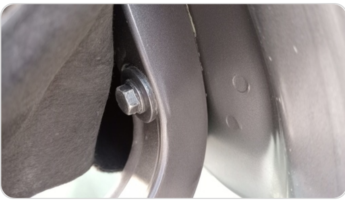
مفصلات ومسامير الشنطة : آثار فك وتركيب