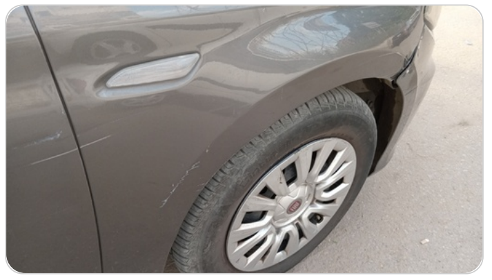
الرفرف الأمامي يمين : فبريكة (خرابيش - خبطات)