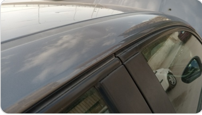
قائم خارجي أمامي يمين : فبريكة (خبطات)