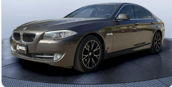
FR L 45