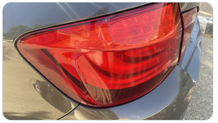
الكشاف الخلفي شمال : كسر بالباغة