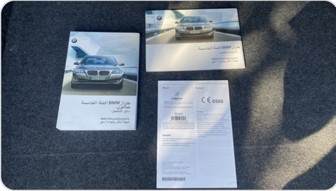
كتالوج السيارة : موجود