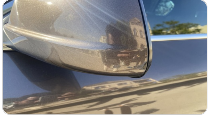
مرآة الباب الأمامي شمال : فبريكة (خرابيش)