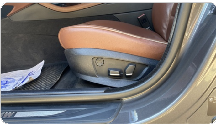
DRIVER SEAT SWITCHES