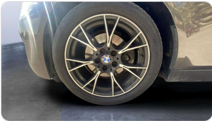
FR L TIRE