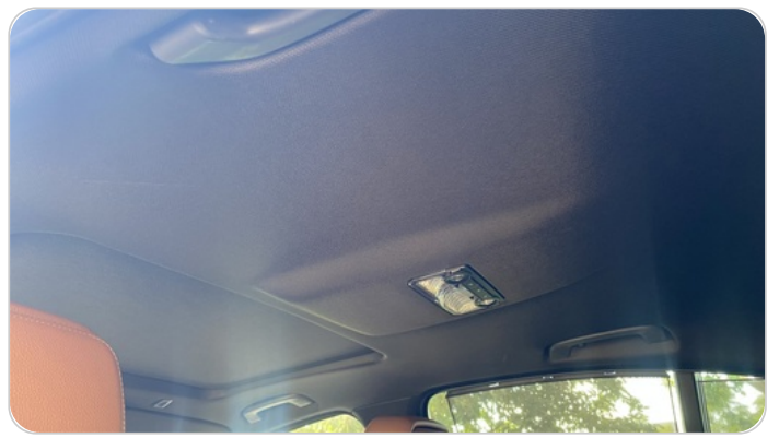
CAR ROOF MAT