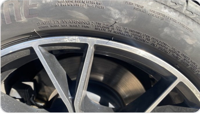
حالة الجنوط الأمامي : تجريحات بسيطة