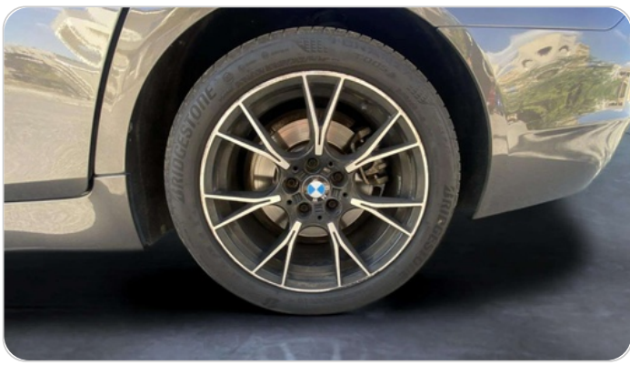
RR L TIRE