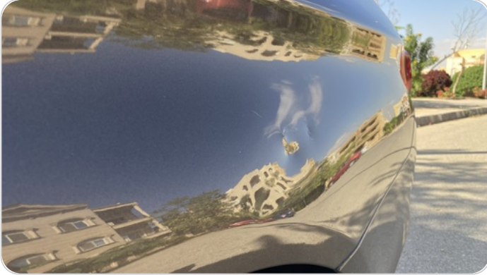
الرفرف الخلفي شمال : فبريكة (خرابيش)