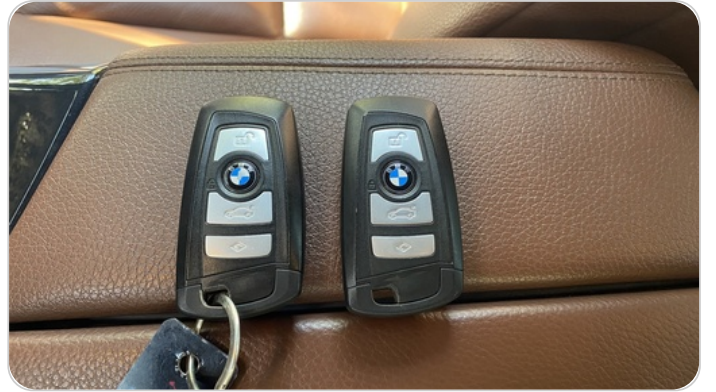
حالة الريموت / المفتاح : يعمل بكفاءة