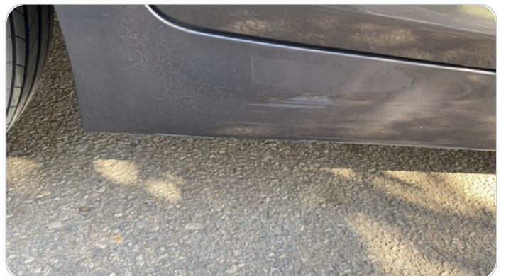
العتب السفلي يمين : فبريكة (خرابيش)