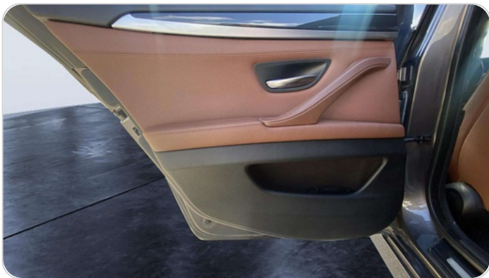
RR L DOOR