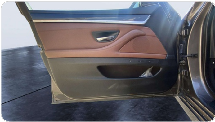
FR L DOOR