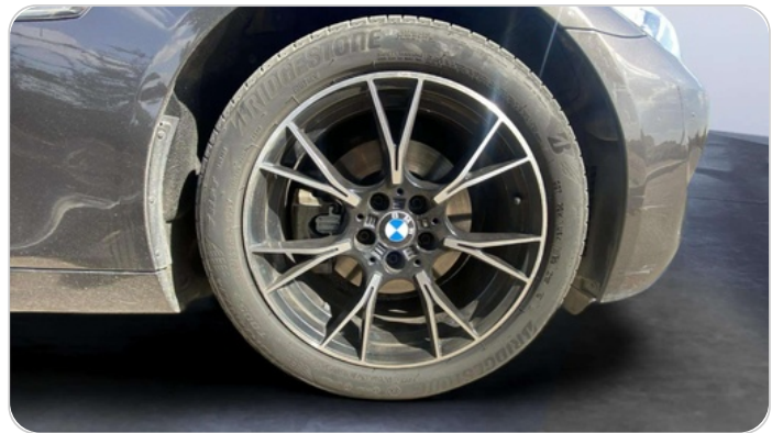
FR R TIRE