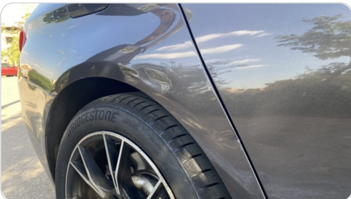
الرفرف الخلفي يمين : فبريكة (خرابيش)