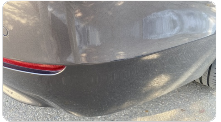
الاكصدام الخلفي فبريكا خرابيش :