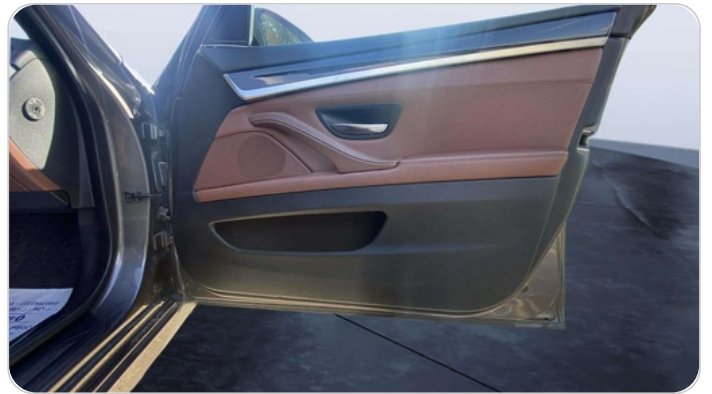
FR R DOOR