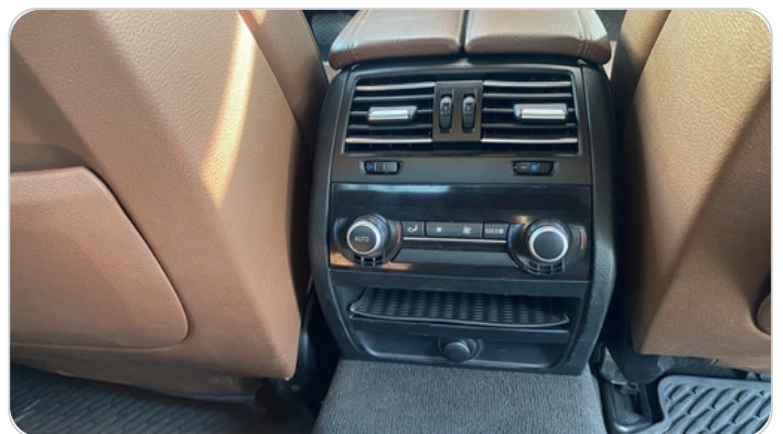
RR AC GRILL