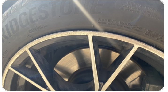
حالة الجنوط الخلفي : تجريحات بسيطة