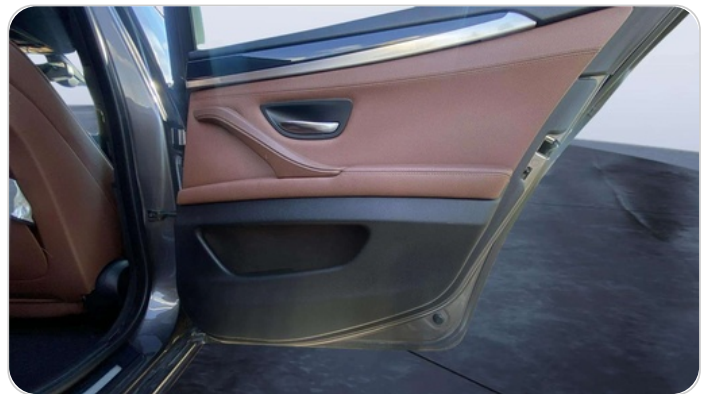
RR R DOOR