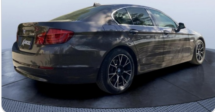
RR R 45