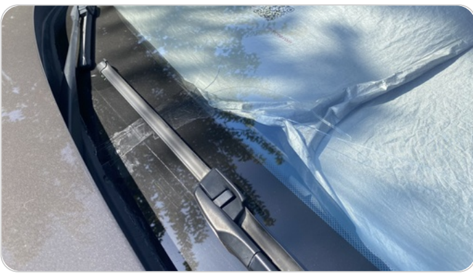
زجاج السيارة الأمامي : شروخ أو كسور