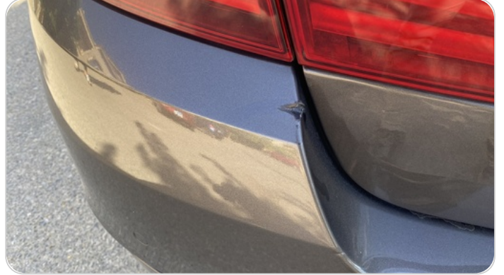
الاكصدام الخلفي : فبريكة (خرابيش)