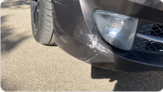
الاكصدام الأمامي : فبريكة (خرابيش)