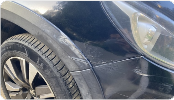
الرفرف الأمامي يمين : رش مع معجون (ملاحظات)