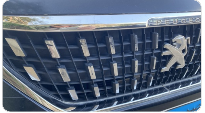
شبكة أمامية : الدهان / النيكل (متآكل)