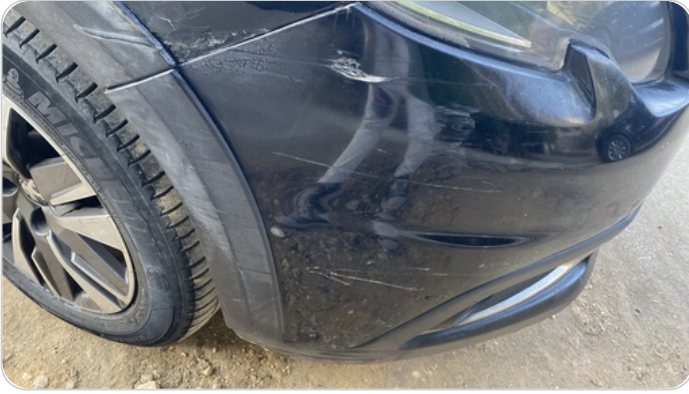
الاكصدام الأمامي : فبريكة (كسر)