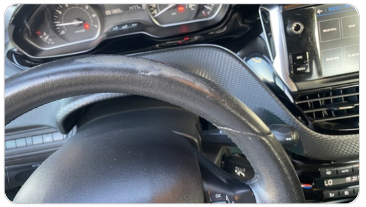
: الطارة بها خدوش