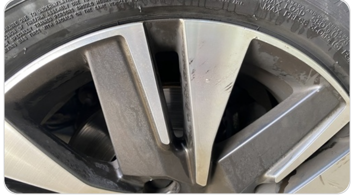
حالة الجنوط الأمامي : تجريحات بسيطة