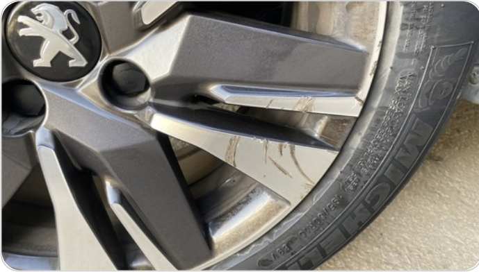
حالة الجنوط الخلفي : تجريحات بسيطة