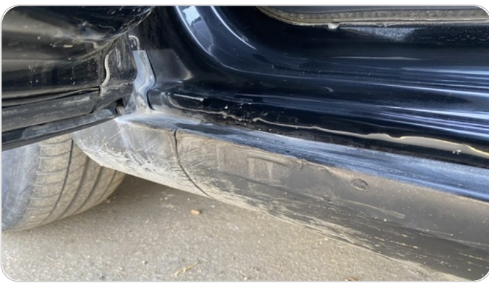
العتب السفلي شمال : فبريكة (سمكره على البارد)