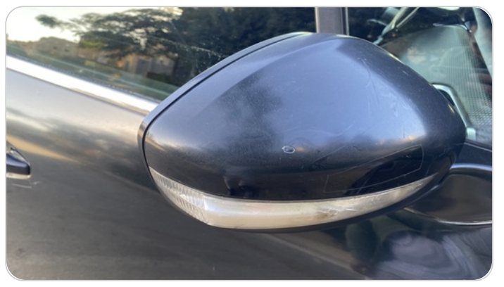
مراية الباب الأمامي يمين : فبريكة (خرابيش)