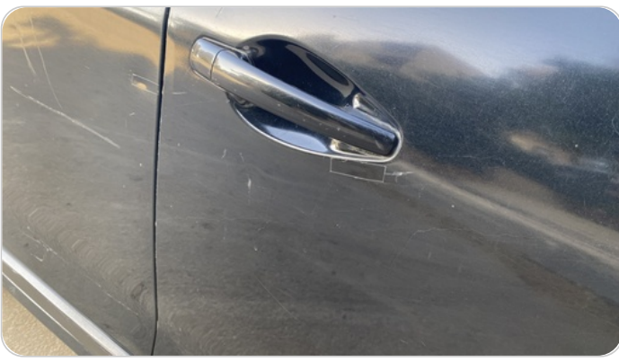
الباب الامامي يمين فبريكا خرابيش :