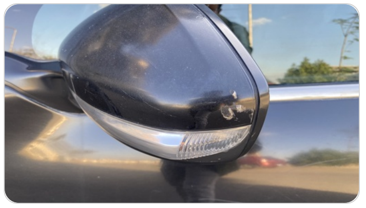
مراية الباب الأمامي شمال : فبريكة (خرابيش)