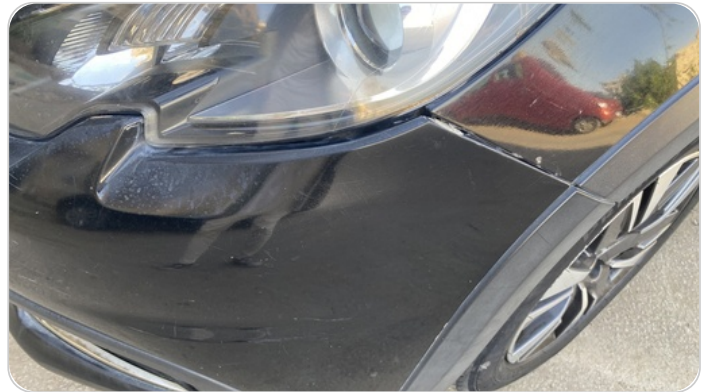
: الاكصدام الامامي فبريكا كسر