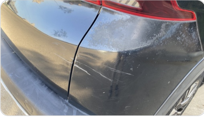
: الاكصدام الخلفي خرابيش