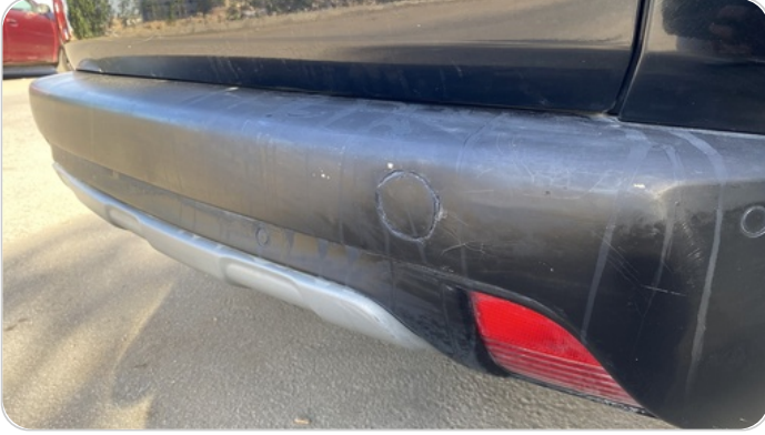
الاكصدام الخلفي : رش مع معجون (خرابيش)