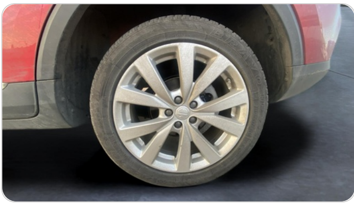
RR L TIRE