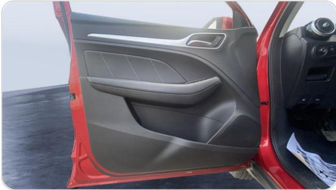
FR L DOOR