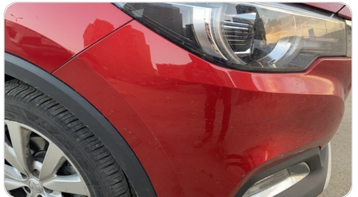
الكصدام الأمامي : فبريكة (خرابيش)