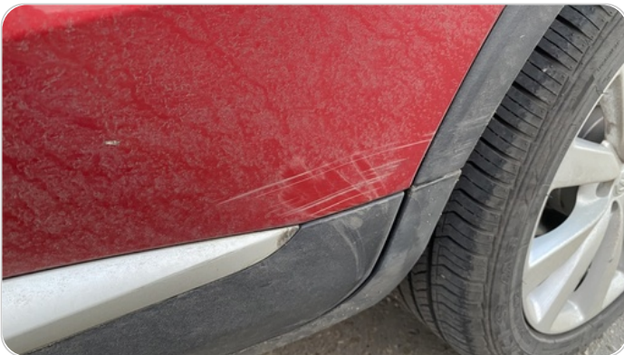
الباب الخلفي شمال : فبريكة (خرابيش)