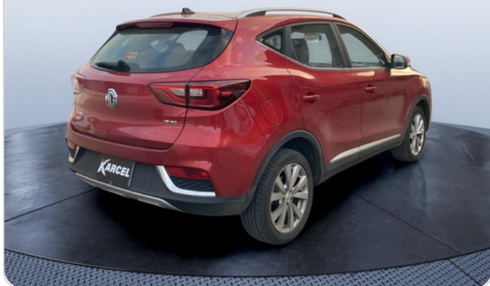
RR R 45