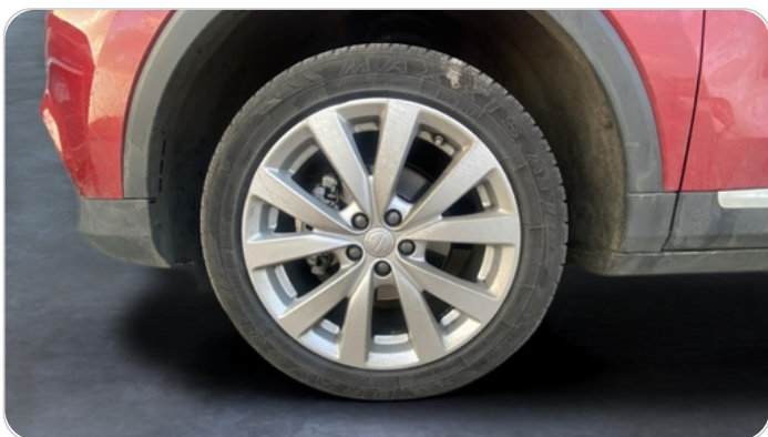
FR L TIRE