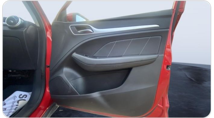
FR R DOOR