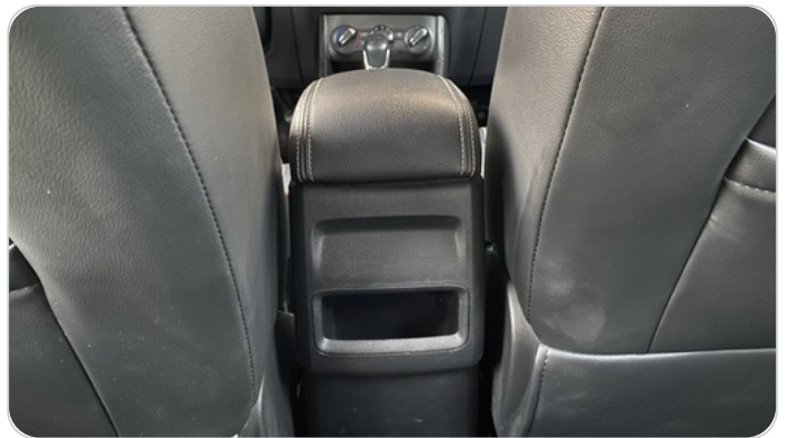
RR AC GRILL