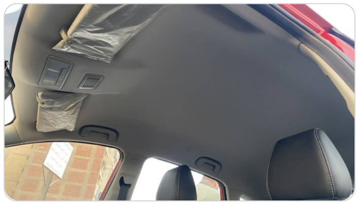
CAR ROOF MAT