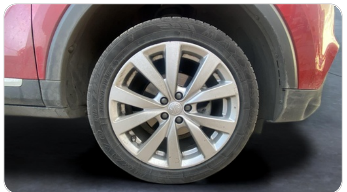
FR R TIRE