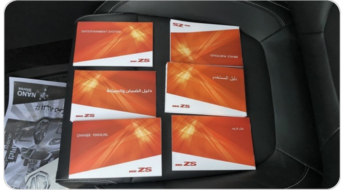
كتيب الضمان : موجود