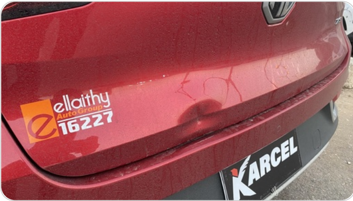
باب الشنطة : فبريكة (خبطات)