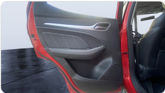
RR L DOOR