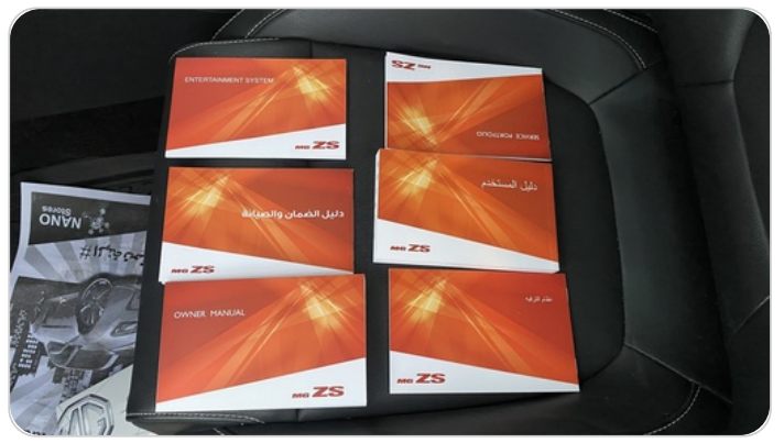
كتالوج السيارة : موجود