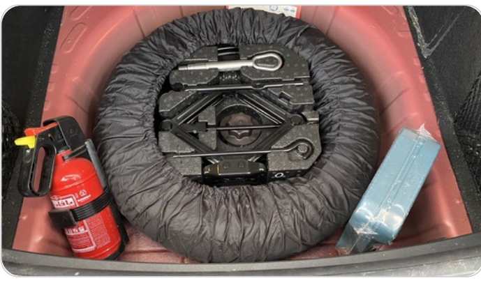
العدة وأدوات الأمان : متوفرة (بحالة جيدة)