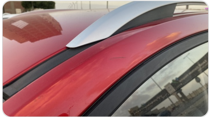
قائم خارجي أمامي شمال : فبريكة (خرابيش)