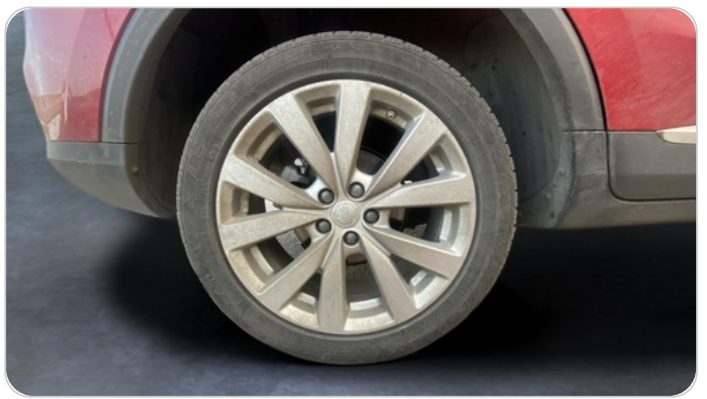
RR R TIRE