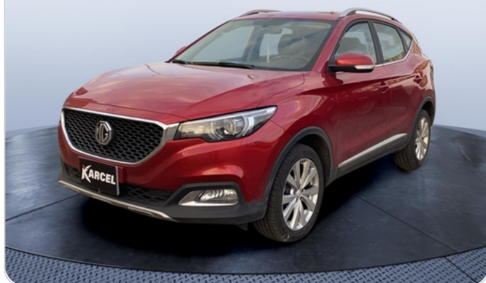
FR L 45