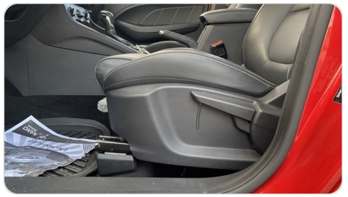
DRIVER SEAT SWITCHES