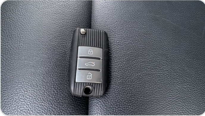
حالة الريموت / المفتاح : يعمل بكفاءة