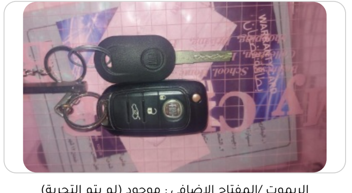
الريموت /المفتاح الاضافي : موجود (لم يتم التجربة)