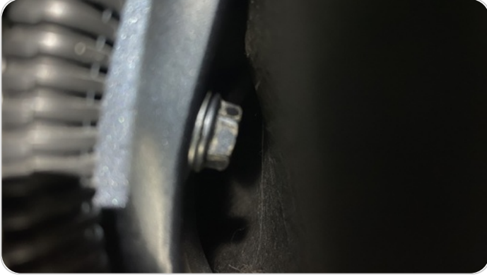
مفصلات ومسامير الشنطة : آثار فك وتركيب