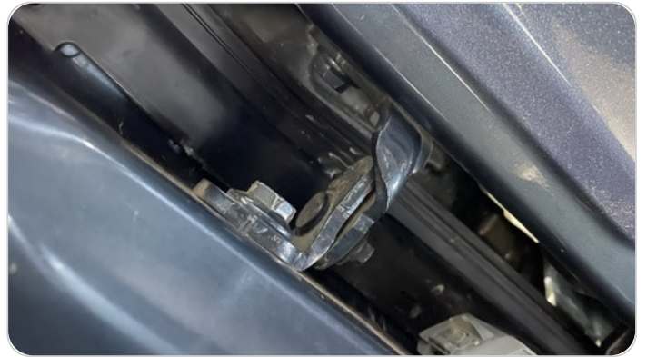
مفصلات ومسامير الباب الأمامي شمال : آثار فك وتركيب