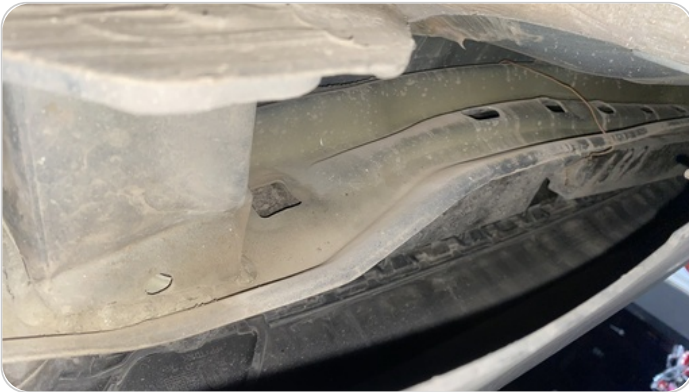
: عصرة بحامل الاكصدام الخلفي