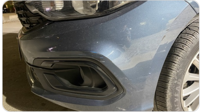
: الاكصدام الامامي. فبريكا خرابيش