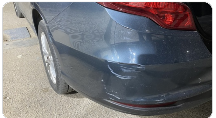
الكصدام الخلفي : رش بدون معجون (خرابيش)