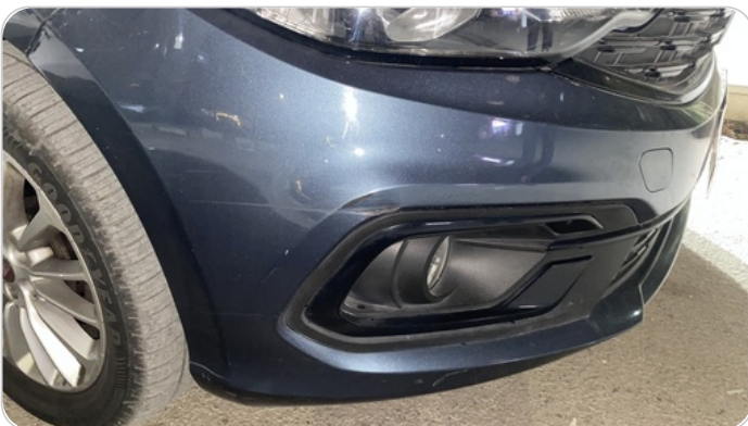
الكصدام الأمامي : فبريكة (خرابيش)