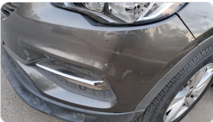
الاكصدام الأمامي : فبريكة (خرابيش - خبطات)