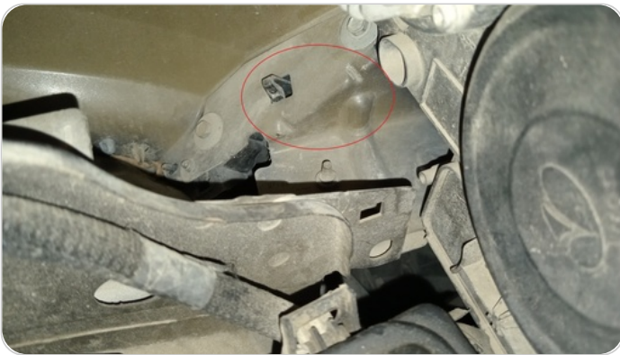
خلف كشاف امامي شمال : عصرة