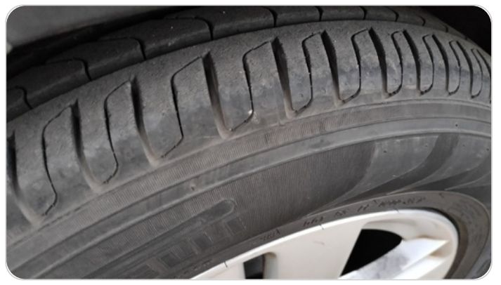
حالة الكاوتش الأمامي : النقشة متآكلة