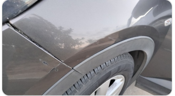
الرفرف الأمامي شمال : فبريكة (خرابيش - خبطات)