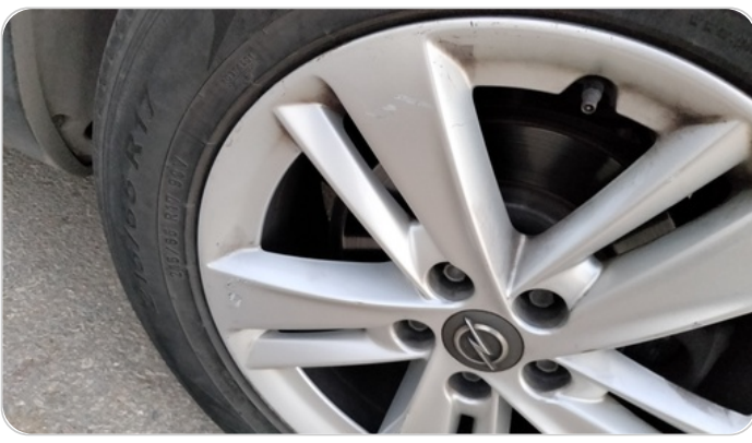
حالة الجنوط الخلفي : تجريحات بسيطة