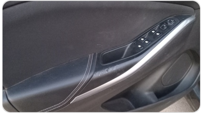
فرش الباب الأمامي شمال : قطع/كسر/شرخ/تلف