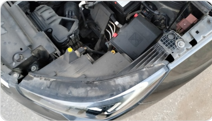
الكشاف الأمامي شمال : كسر في قواعد الكشاف