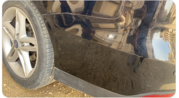
فبريكا خرابيش : الاكصدام الخلفي