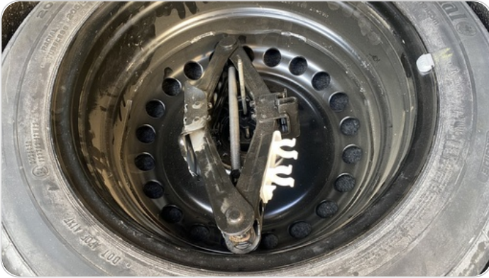
العدة وأدوات الأمان : لا يوجد عدة