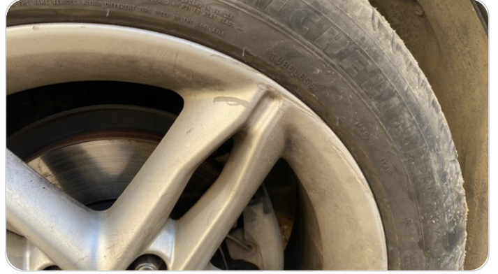
حالة الجنوط الخلفي : تجريحات بسيطة