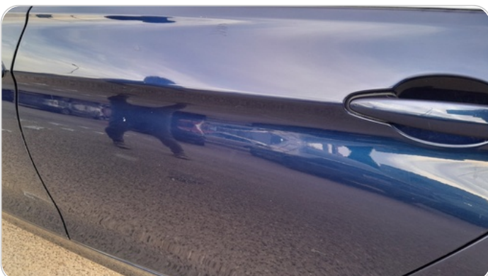
الباب الخلفي شمال : رش بدون معجون (خرابيش)