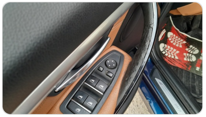
فرش الباب الأمامي شمال : قطع/كسر/شرخ /تلف