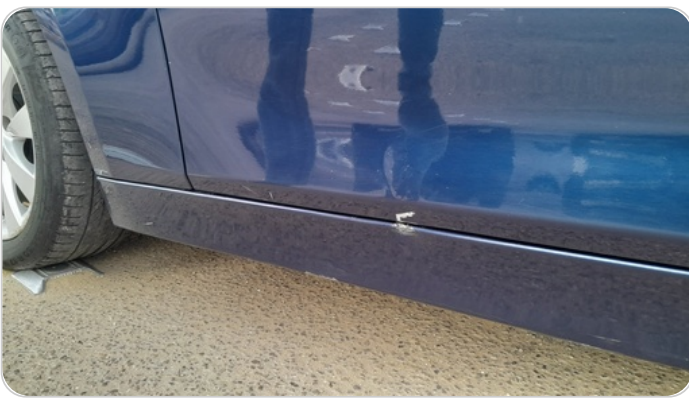
العتب السفلي شمال : رش بدون معجون (خرايش)