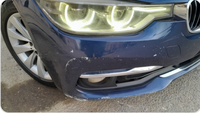
الاكصدام الامامي :