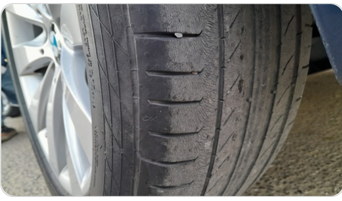
حالة الكاوتش الخلفي : النقشة متآكلة