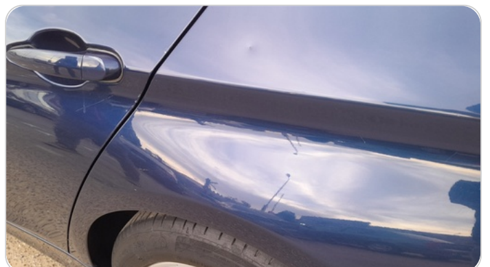
الرفرف الخلفي شمال : رش بدون معجون (خرابيش)