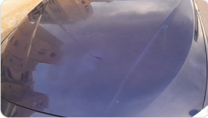
الكبوت : رش بدون معجون (خرابيش)