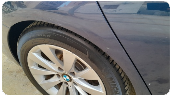
الرفرف الخلفي يمين : رش بدون معجون (خرايش)