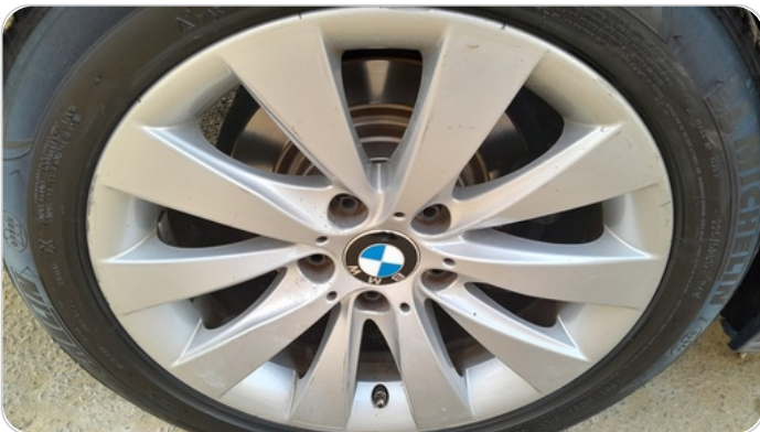
حالة الجنوط الخلفي : تجريحات بسيطه