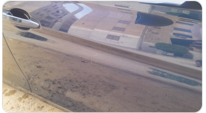
الباب الأمامي يمين : رش بدون معجون (خرايش)