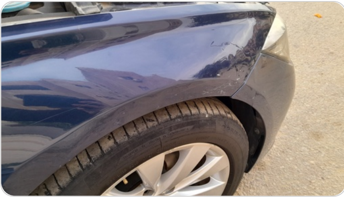
الرفرف الأمامي يمين : رش بدون معجون (خبطات)