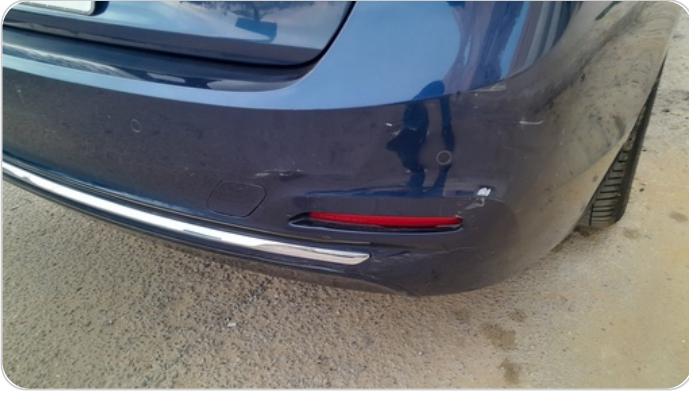
الاكصدام الخلفي : رش مع معجون (خرايش)