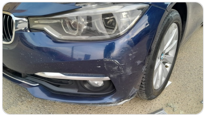
الاكصدام الأمامي : رش مع معجون (خرايش)