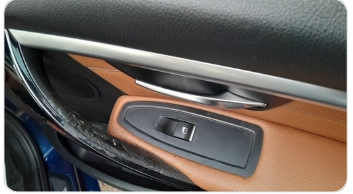
فرش الباب الأمامي يمين : قطع / كسر /شرخ / تلف