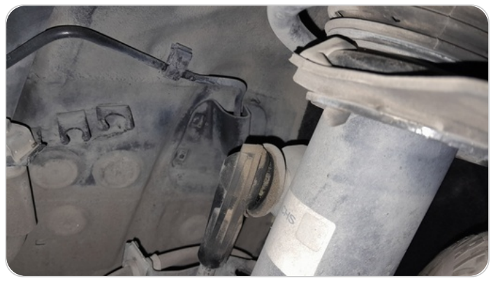
ذراع الميزان : تشققات (كاوتش الميزان)