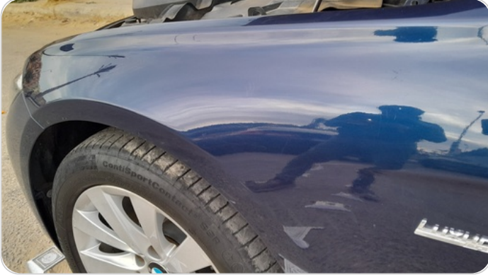
الرفرف الأمامي شمال : رش بدون معجون (خرابيش)