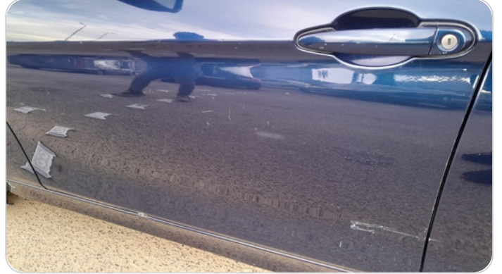
الباب الأمامي شمال : رش بدون معجون (خرابيش)