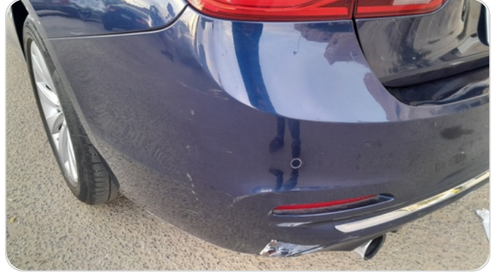
الاكصدام الخلفي :