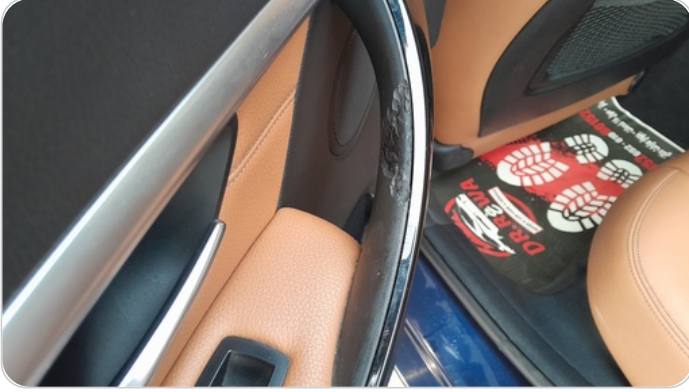
فرش الباب الخلفي شمال : قطع /كسر/شرخ /تلف