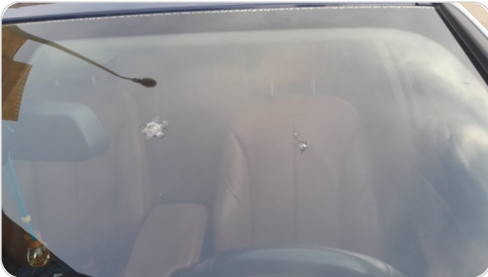
زجاج السيارة الأمامي : نقرة