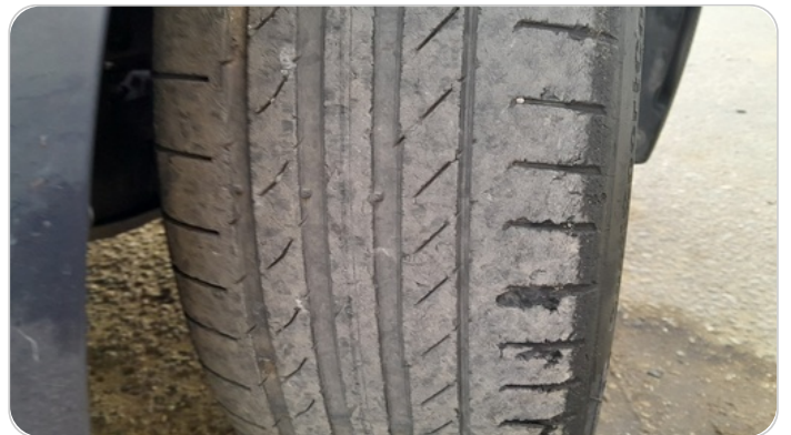
حالة الكاوتش الأمامي : النقشة متآكلة