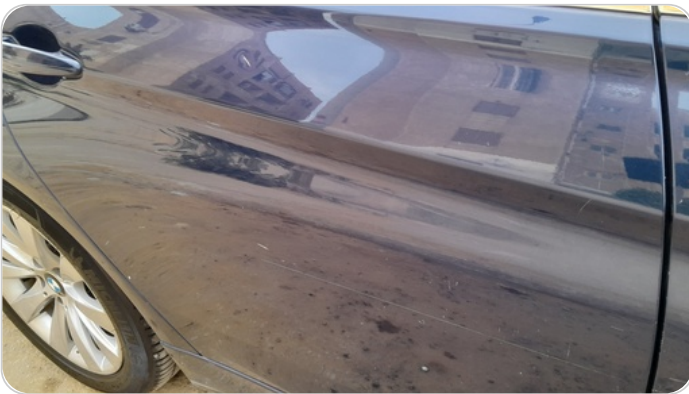
الباب الخلفي يمين : رش بدون معجون (خرايش)