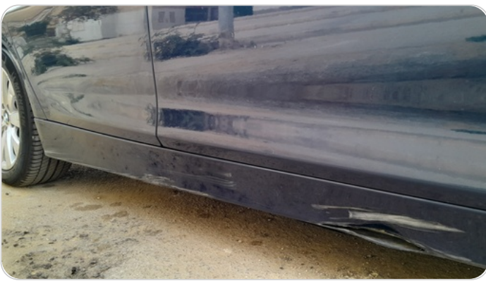
العتب السفلي يمين : رش بدون معجون (خبطات)