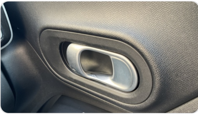
مقبض باب امامي يمين : تلف