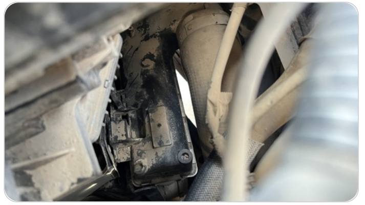
فيلر مبرد هواء التريو : كسر