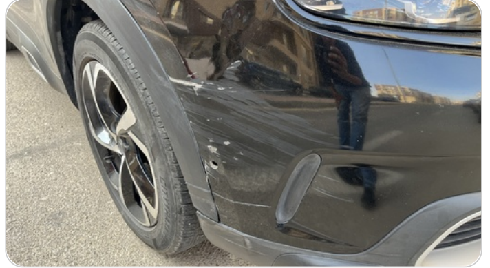
الاكصدام الأمامي : فبريكة (كس)