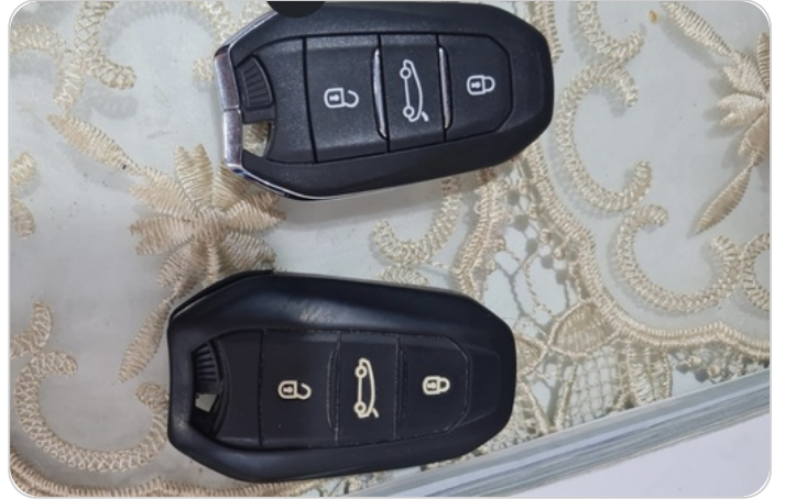
الريموت /المفتاح الاضافي : موجود (لم يتم التجربة)