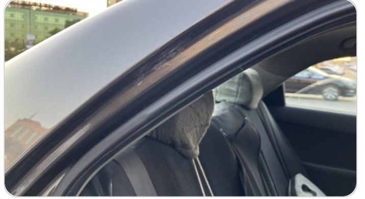
دواخل وقوائم باب خلفي يمين : فبريكة (خرابيش)