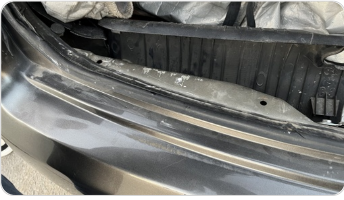
ستارة شنطة خلفية : استعداد