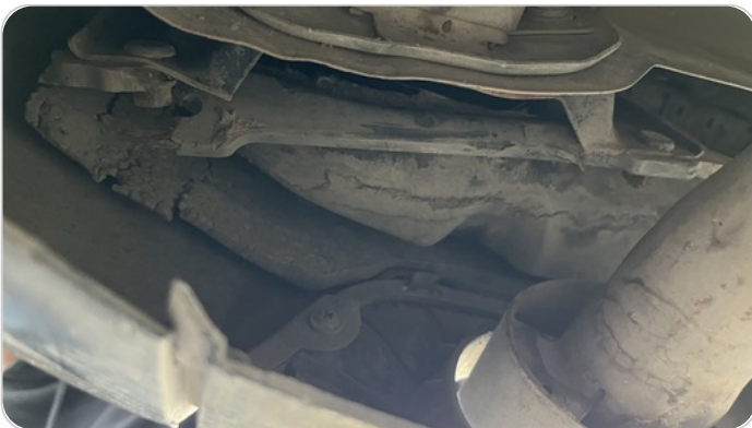
حامل اكصدام خلفي : عصره