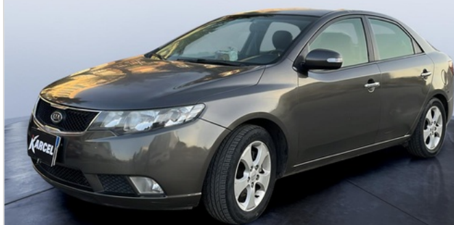
FR L 45