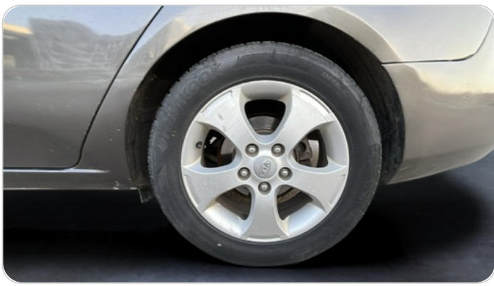
RR L TIRE