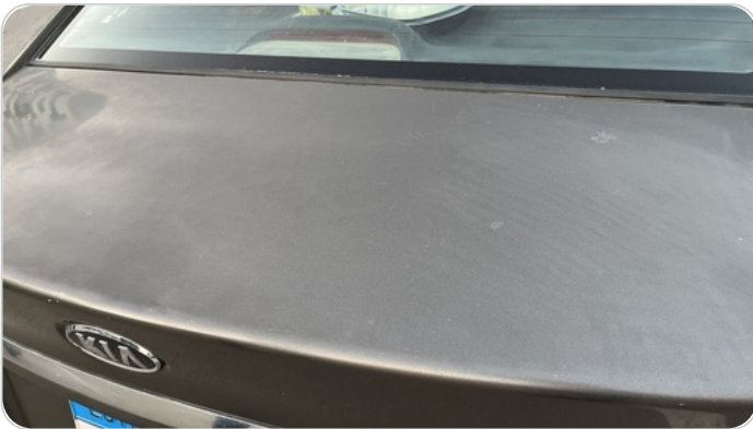
باب الشنطة : رش مع معجون (خرابيش)