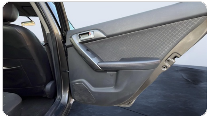
RR R DOOR