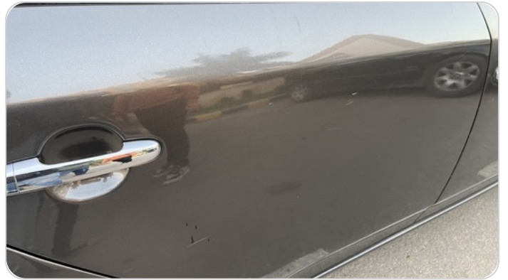
الباب الخلفي يمين : رش مع معجون (خرابيش)