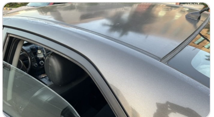
قائم خارجي خلفي شمال : رش مع معجون (خرابيش)