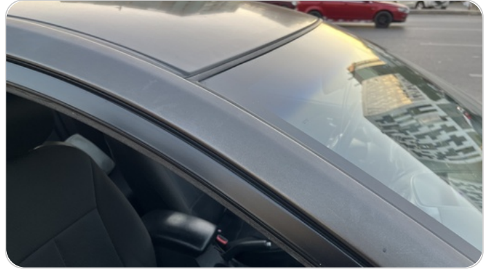
قائم خارجي أمامي يمين : رش مع معجون (خرابيش)