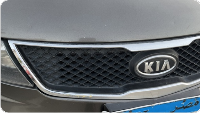
شبكة أمامية : الدهان / النيكل (متآكل)