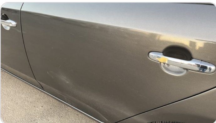
الباب الخلفي شمال : رش مع معجون (خرابيش)