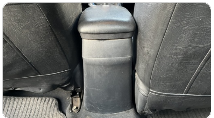
RR AC GRILL