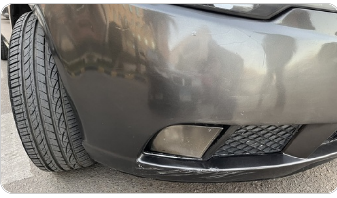
الاكصدام الأمامي : رش مع معجون (خرابيش)