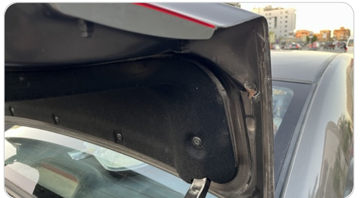
باب الشنطة : استبدال