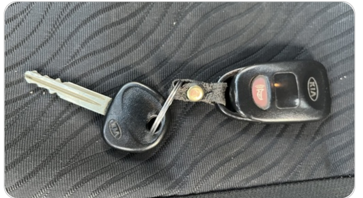
حالة الريموت / المفتاح : يعمل بكفاءة