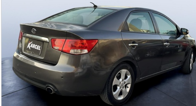
RR R 45