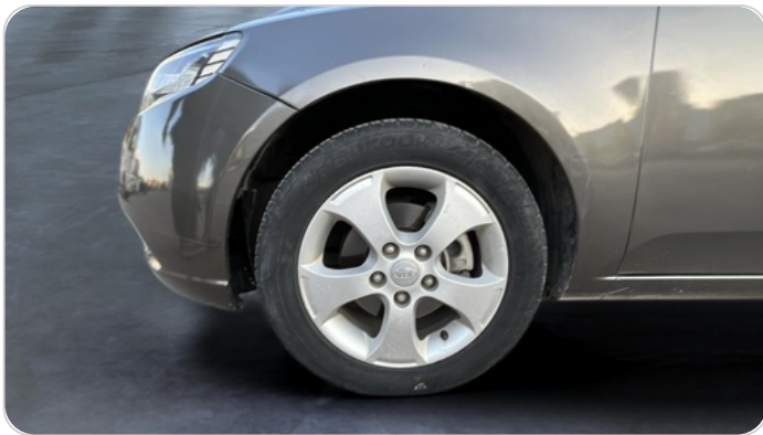
FR L TIRE