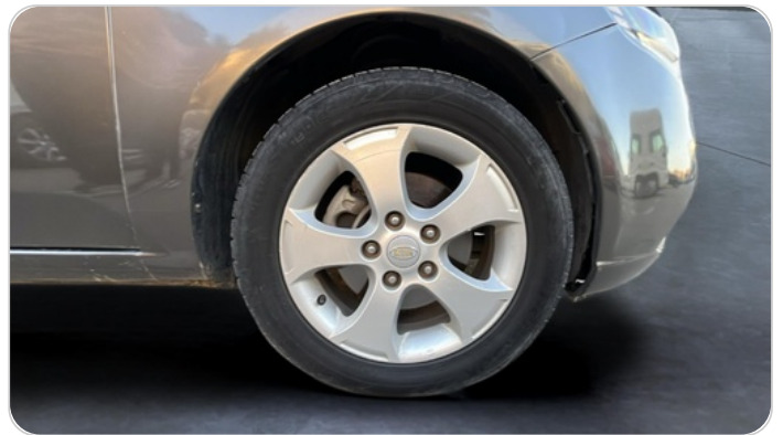
FR R TIRE