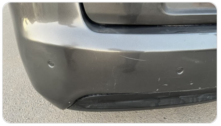
الاكصدام الخلفي : رش مع معجون (خرابيش)