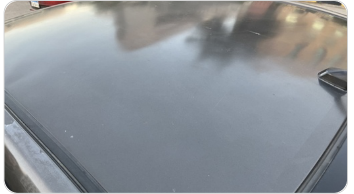
السقف : فبريكة (خرابيش)