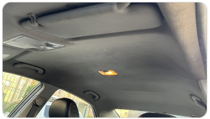
CAR ROOF MAT