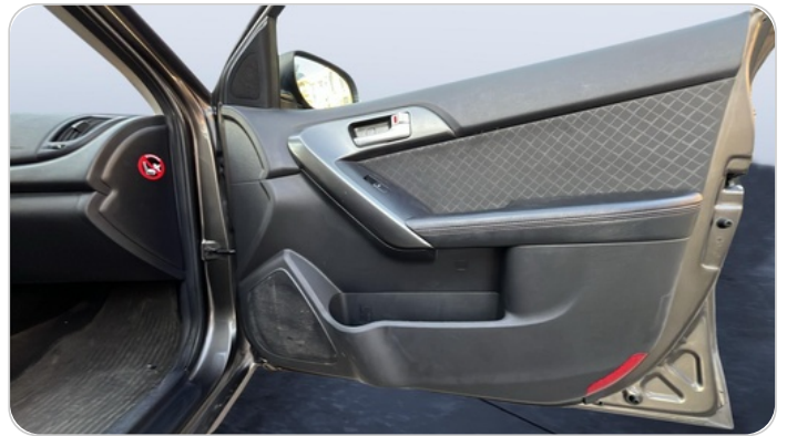
FR R DOOR