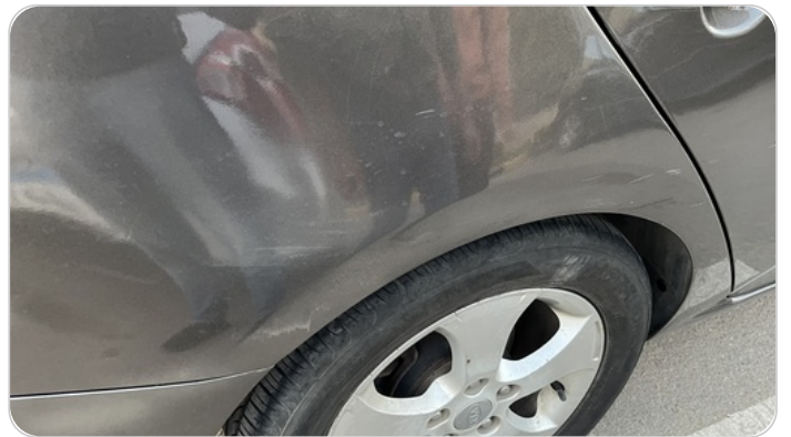
الرفرف الخلفي يمين : رش مع معجون (خرابيش)