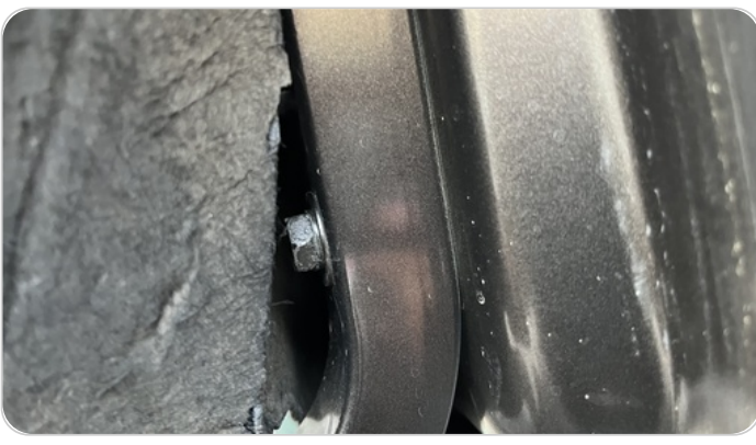
مفصلات ومسامير الشنطة : آثار فك وتركيب