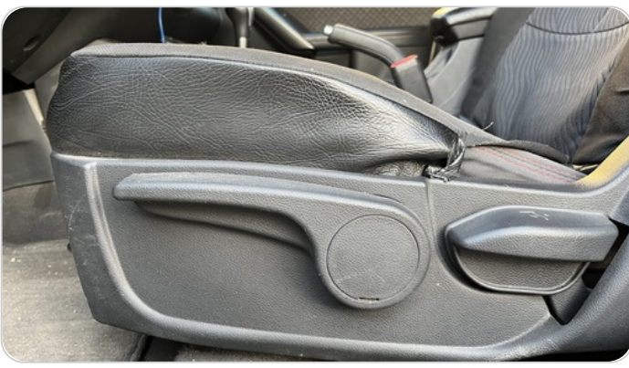
DRIVER SEAT SWITCHES