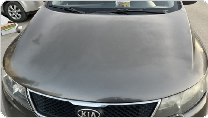
الكبوت : رش مع معجون (خرابيش)