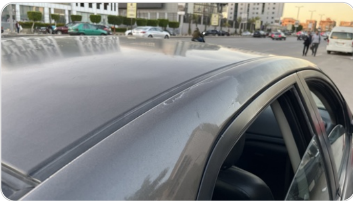
قائم خارجي خلفي يمين : (رش مع معجون (خرابيش)