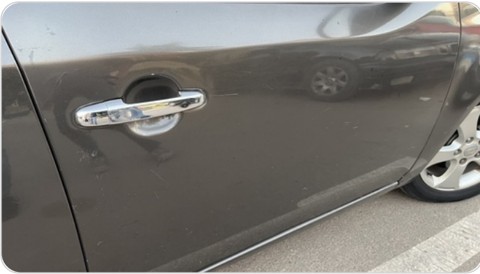
الباب الأمامي يمين : رش مع معجون (خرابيش)