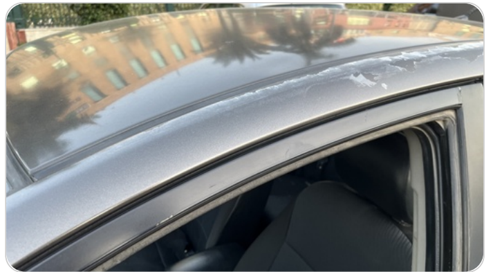
قائم خارجي أمامي شمال : رش بدون معجون (خرابيش)