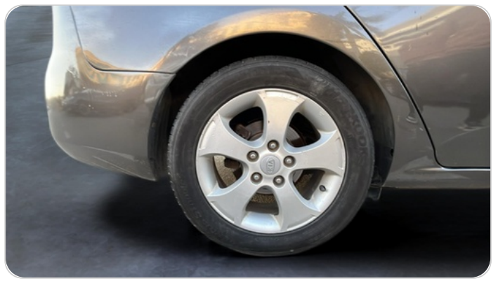
RR R TIRE