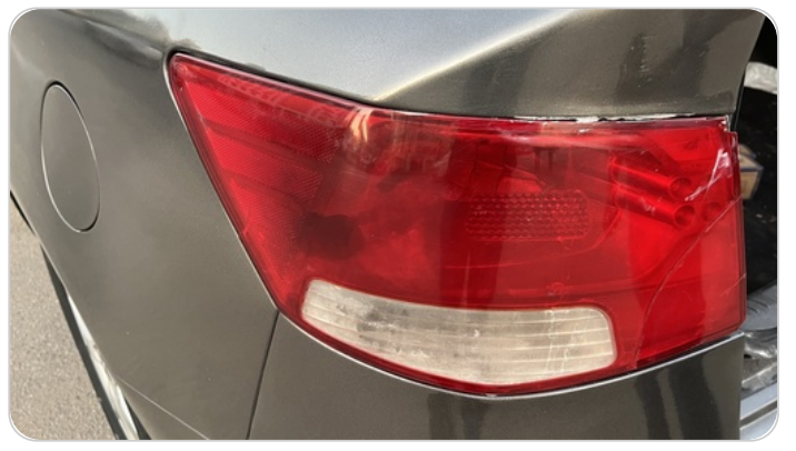
الكشاف الخلفي شمال : كسر بالباغة