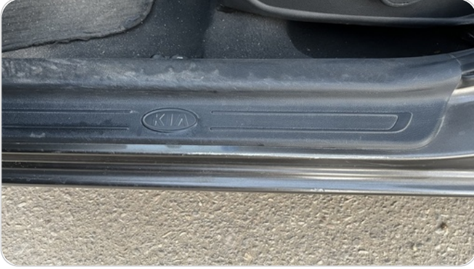
دواخل وقوائم باب الأمامي شمال : فبريكة (خرابيش)