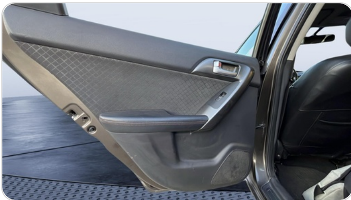
RR L DOOR