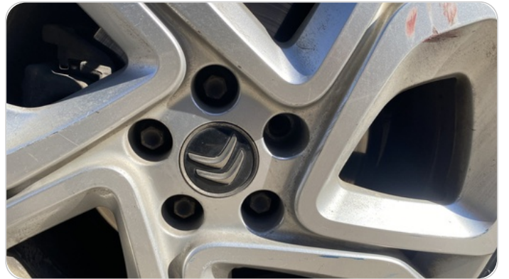
فقد بمسمار بالعجلة اليمين : الكاوتش الخلفي