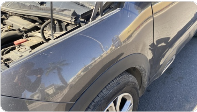
الرفرف الأمامي شمال : فبريكة (خبطات)