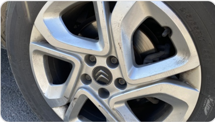
حالة الجنوط الخلفي : تجريحات بسيطه