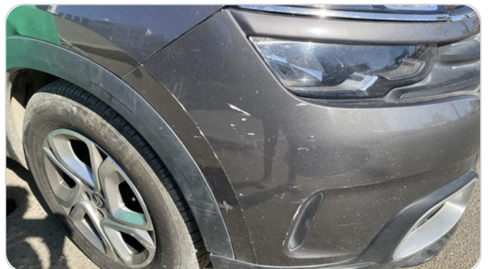
الكصدام الأمامي : فبريكة (خرابيش)