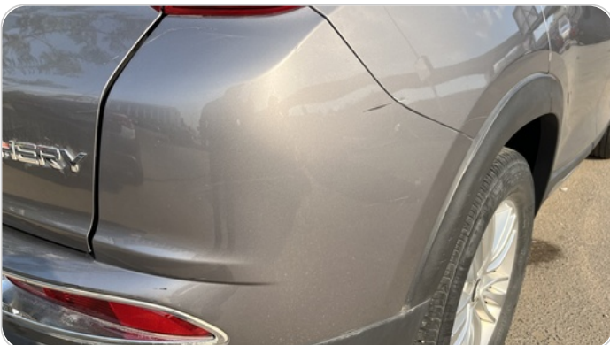
الاكصدام الخلفي : فبريكة (خرايش)