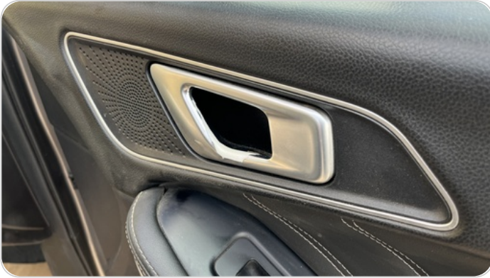
مقبض باب امامي يمين : تاكل