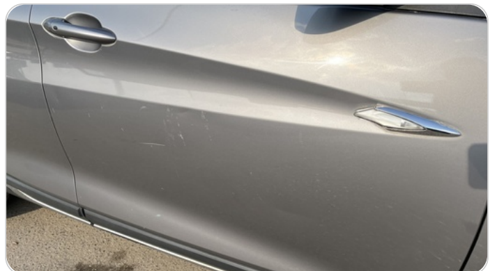
الباب الأمامي يمين : فبريكة (خرايش)