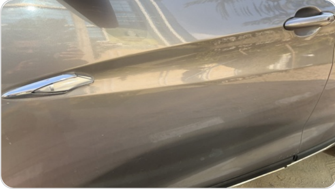
الباب الأمامي شمال : فبريكة (خرايش)