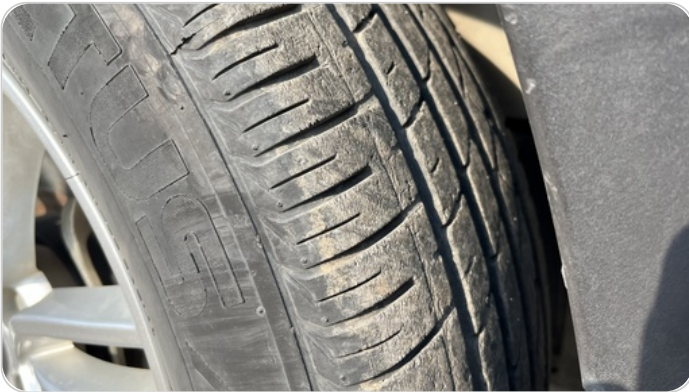
حالة الكاوتش الأمامي : النقشة متآكلة