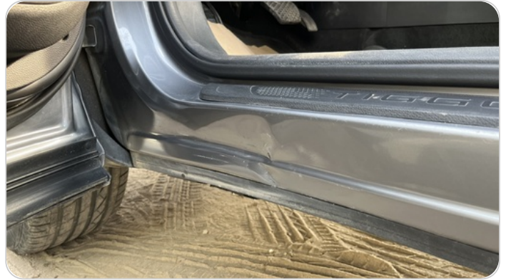
دواخل وقوائم باب الأمامي شمال : فبريكة (نقرة)