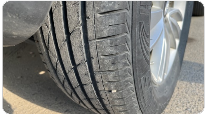
حالة الكاوتش الخلفي : النقشة متآكلة