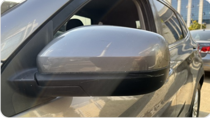
مراية الباب الأمامي شمال : فبريكة (خرايش)