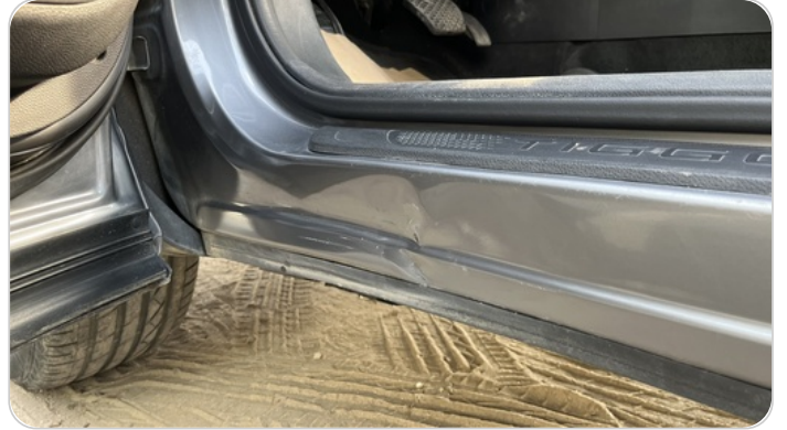
العتب السفلي شمال : فبريكة (خبطات)