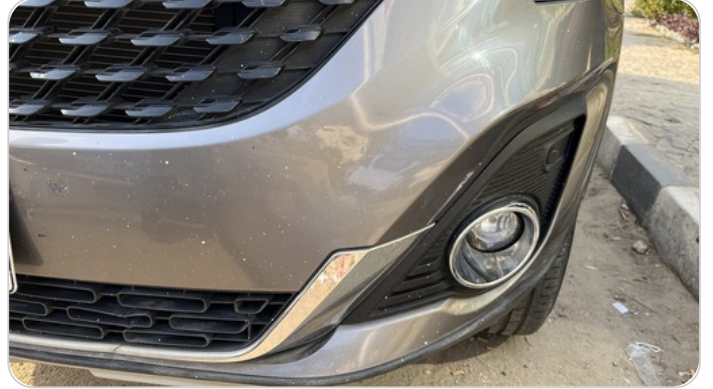
الاكصدام الأمامي : رش بدون معجون (خرايش)