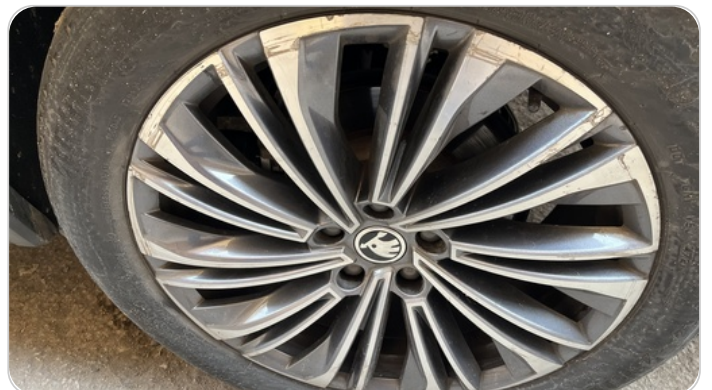
حالة الجنوط الخلفي : تجريحات بسيطه