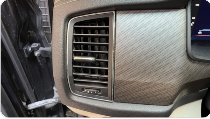
هوايات التكييف : كسر (هواية واحدة)