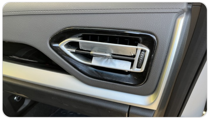
هوايات التكييف : كسر (هواية واحدة)