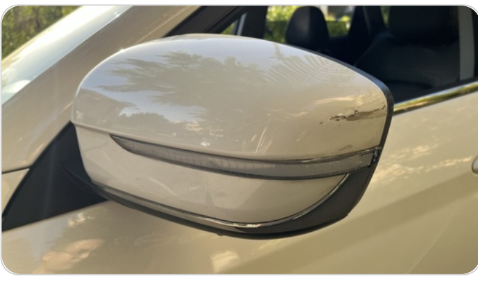
مرآة الباب الأمامي شمال : فبريكة (خرابيش)