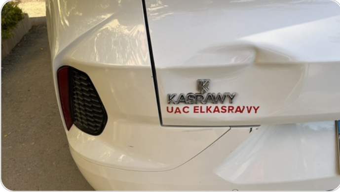
باب الشنطة : فبريكة (خبطات)