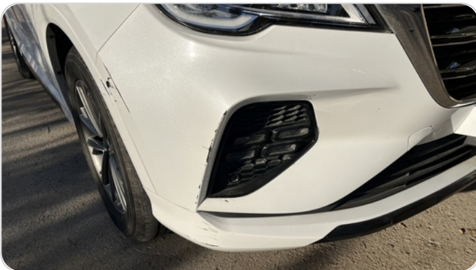
الاكصدام الامامي : فبريكة(خرابيش)