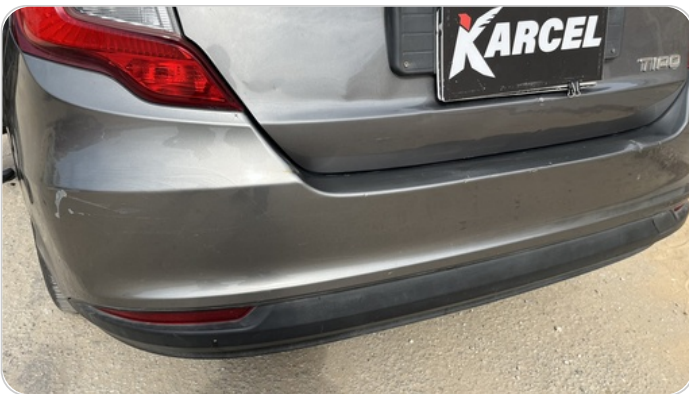
الاكصدام الخلفي : رش مع معجون (خرابيش)