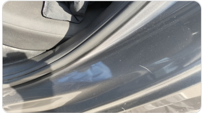
دواخل وقوائم باب الخلفي شمال : فبريكة (خرايش)