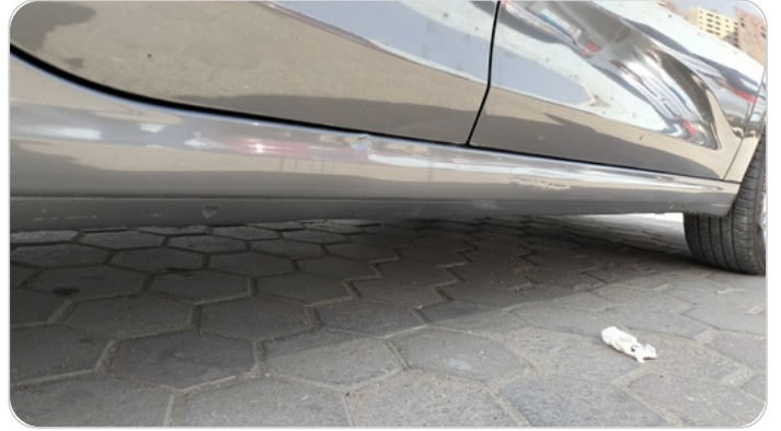
العتب السفلي يمين : فبريكة (خرايش - خبطات)