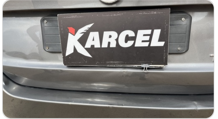
باب الشنطة : فبريكة (سمكره على البارد)