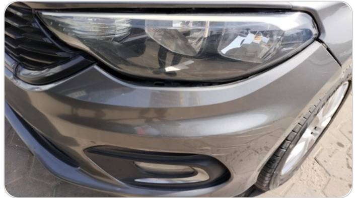
الاكصدام الامامي : فبريكة (خرايش - خبطات)