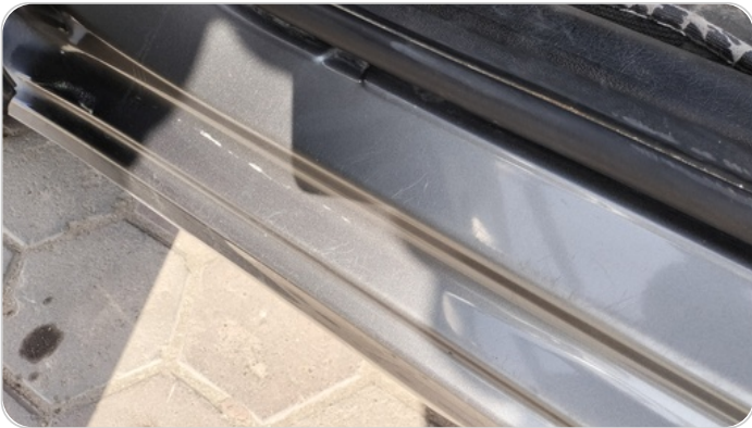
دواخل وقوائم باب الأمامي شمال : فبريكة (خرايش)