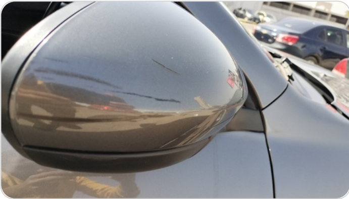
مرآة الباب الأمامي يمين : فبريكة (خرايش)