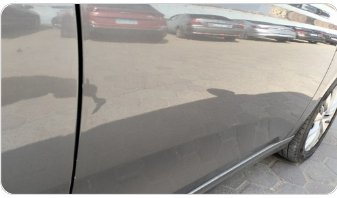
الباب الأمامي يمين : فبريكة (خرايش)