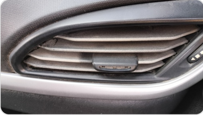
هوايات التكييف : كسر (هواية واحدة)