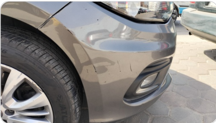
الاكصدام الأمامي : فبريكة (خرابيش - خبطات)