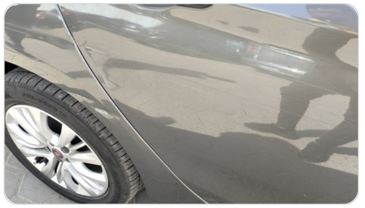
الباب الخلفي يمين : فبريكة (خرايش - خبطات)