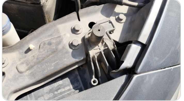
الكشاف الأمامي شمال : كسر في قواعد الكشاف