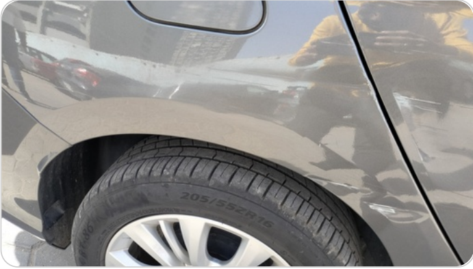
الرفرف الخلفي يمين : فبريكة (خبطات)