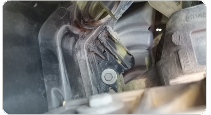
شاسية اكصدام امامي : اعوجاج