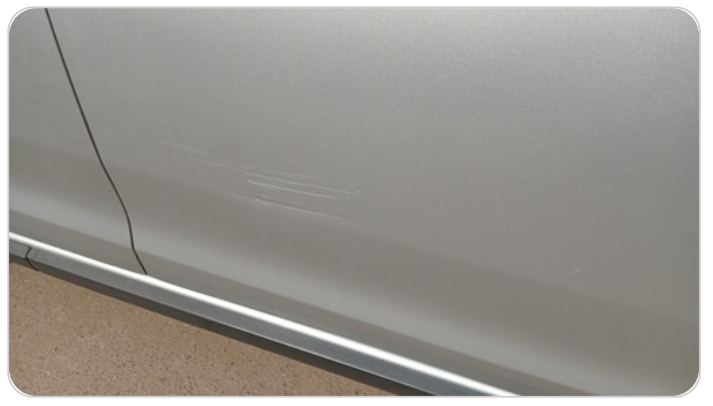
الباب الأمامي يمين : فبريكة (خرابيش - خبطات)