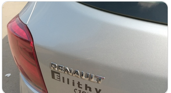
باب الشنطة : فبريكة (خرايش)