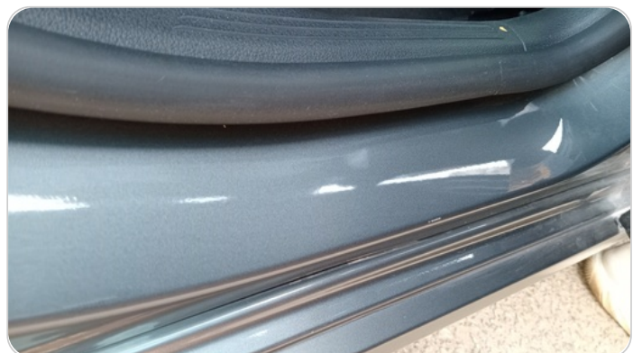
دواخل وقوائم باب خلفي يمين : فبريكة (خرايش)