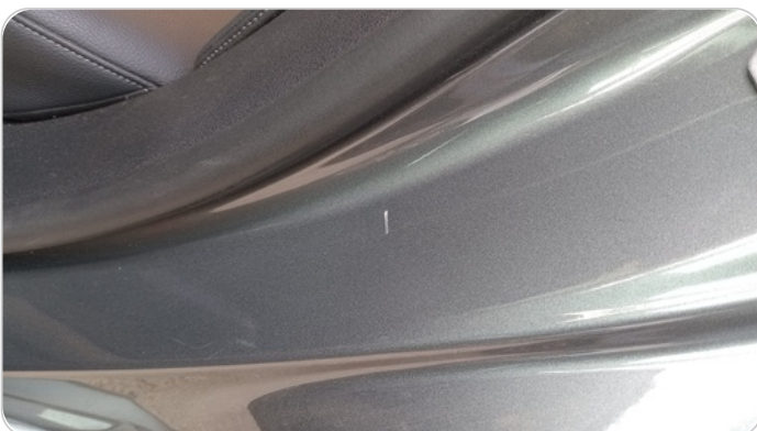
دواخل وقوائم باب الخلفي شمال : فبريكة (خرايش)