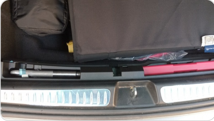
العدة وأدوات الأمان : لا يوجد كوريك