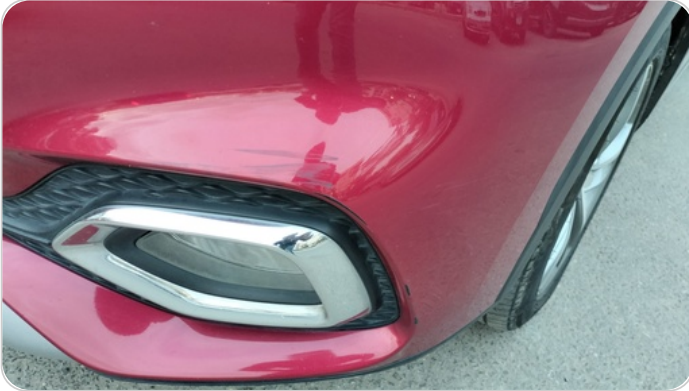
الاكصدام الأمامي : فبريكة (خرابيش)