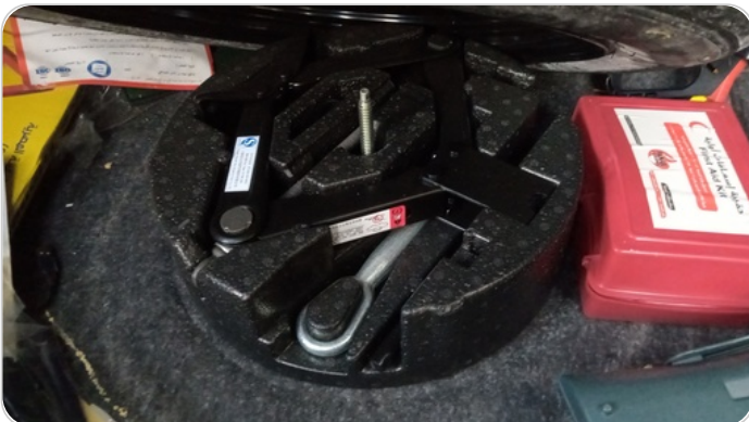
العدة وأدوات الأمان : متوفرة (بحالة جيدة)