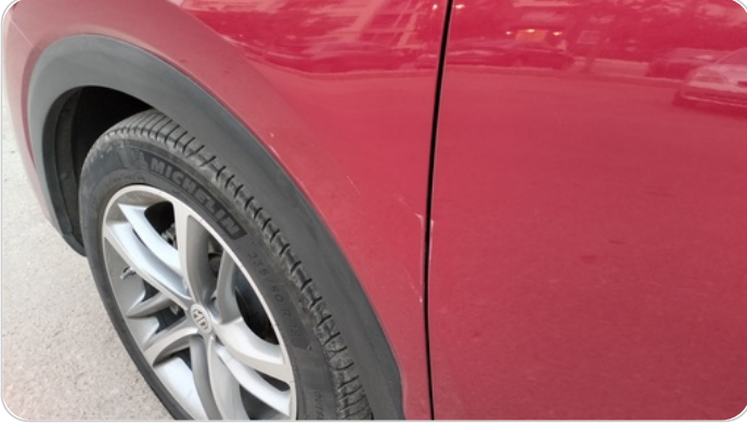
الرفرف الأمامي شمال : فبريكة (خرابيش)