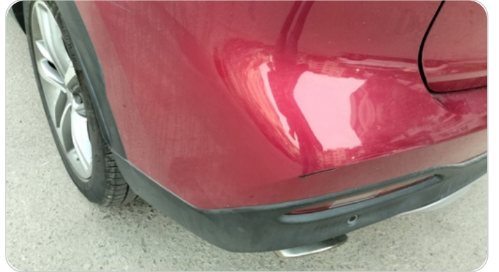
الاكصدام الخلفي : فبريكة (خرابيش)