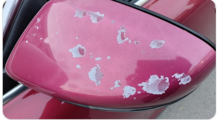
مراية الباب الأمامي شمال : فبريكة (خرابيش)