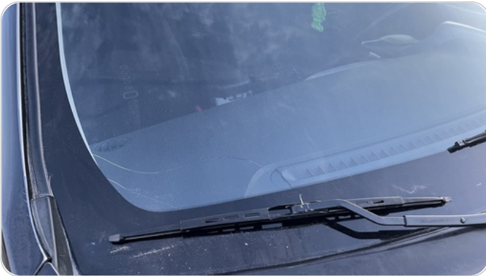
زجاج السيارة الأمامي : شروخ أو كسور