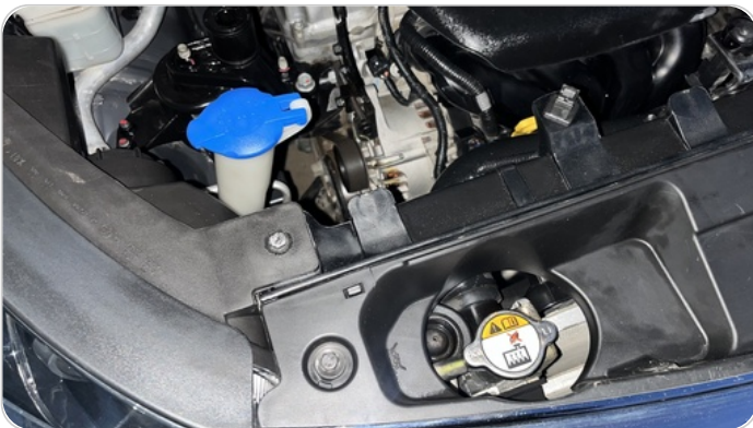
حامل طقم التبريد : اثار فك و تركيب