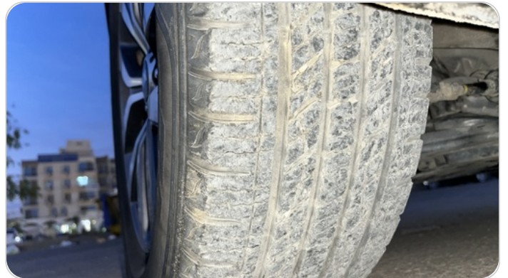
حالة الكاوتش الأمامي : النقشة متآكلة