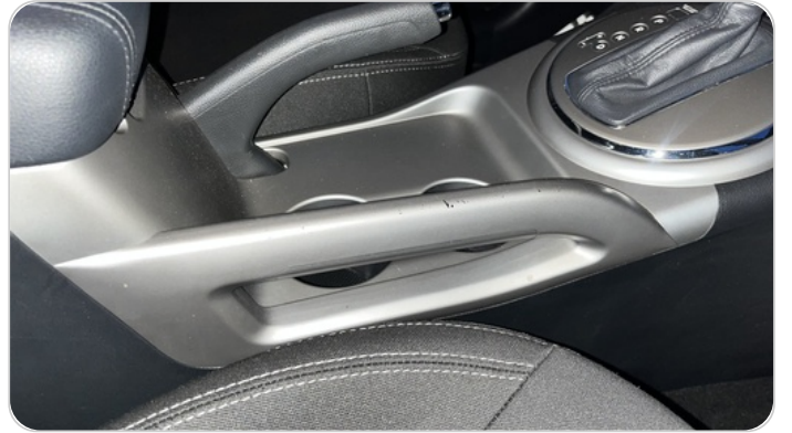
الكونسول الوسط : قطع / كسر / شرخ / تلف