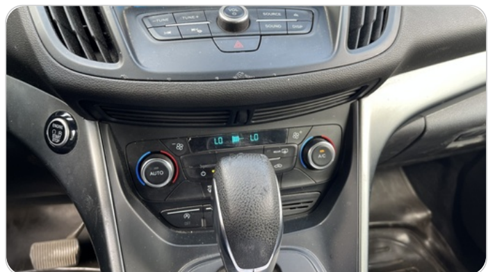
الكونسول الوسط : قطع / كسر / شرخ / تلف