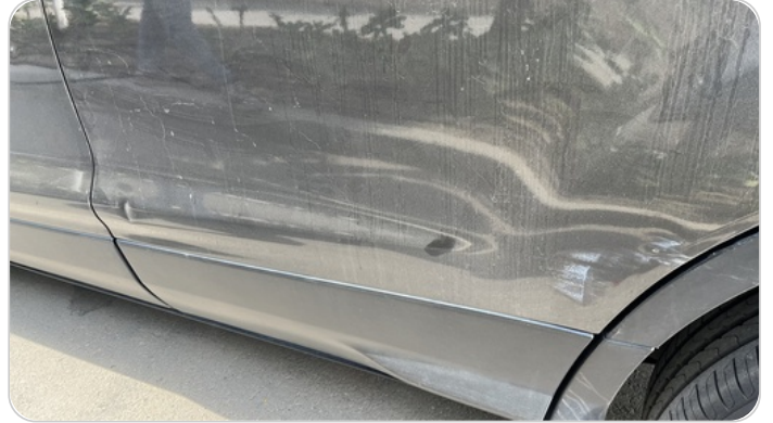
الباب الخلفي شمال : فبريكة (خرابيش)