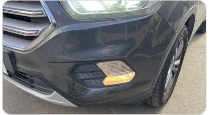
الاكصدام الامامي :