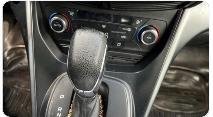
عصايه الفتيس : تاكل