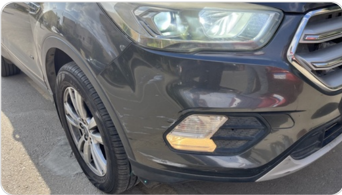
الاكصدام الأمامي : فبريكة (خرابيش)