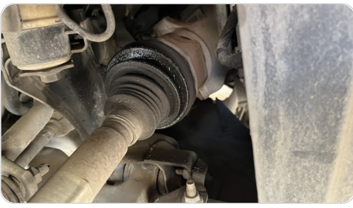
كبالن أمامية : كاوتش الكوبلن مقطوع