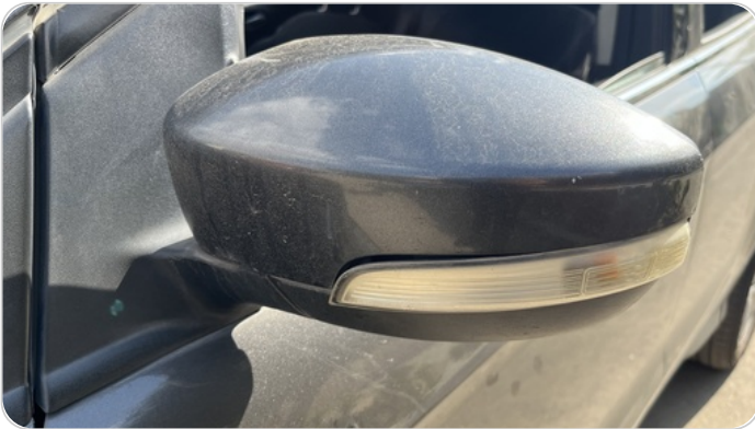
غماز مرآيه شمال : كسر