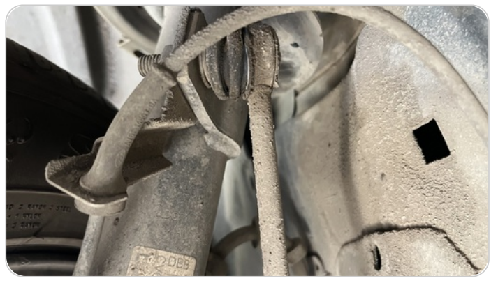
ذراع الميزان : تشققات (كاوتش الميزان)