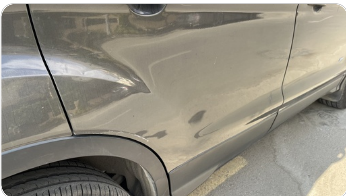
الباب الخلفي يمين : فبريكة (خرابيش)