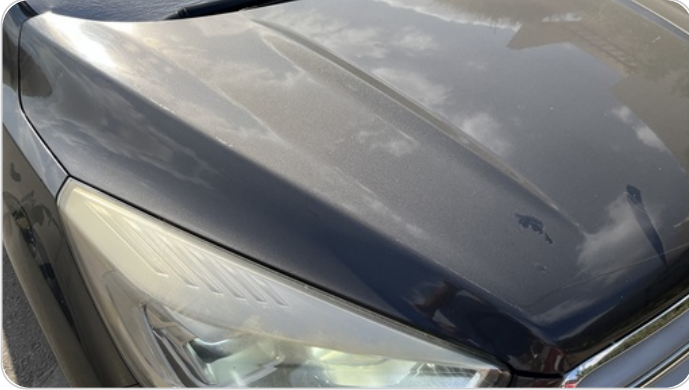
الكبوت : فبريكة (خرابيش)