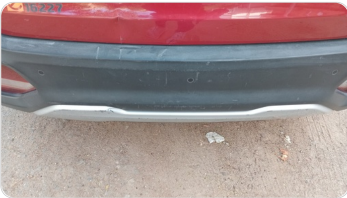
الاكصدام الخلفي : خبطات