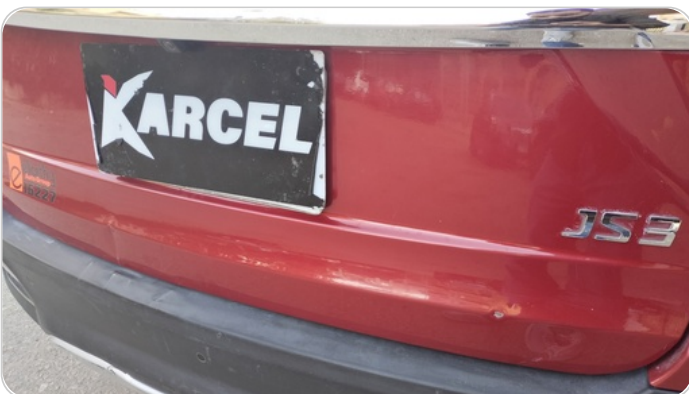
باب الشنطة : فبريكة ( خرايش _ خبطات )