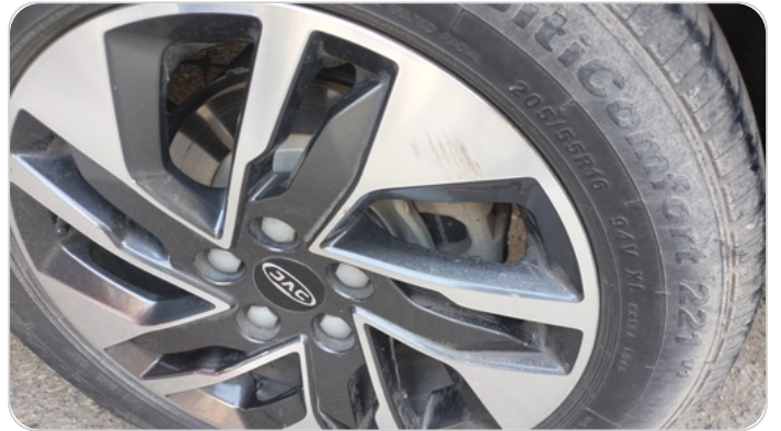
حالة الجنوط الخلفي : تجريحات بسيطه