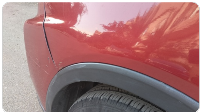
الرفرف الأمامي شمال : فبريكة (سمكره على البارد)