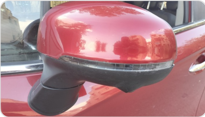
مراية الباب الأمامي شمال : فبريكة (خرابيش)