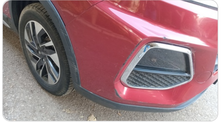
الاكصدام الامامي : فبريكة (كسر)