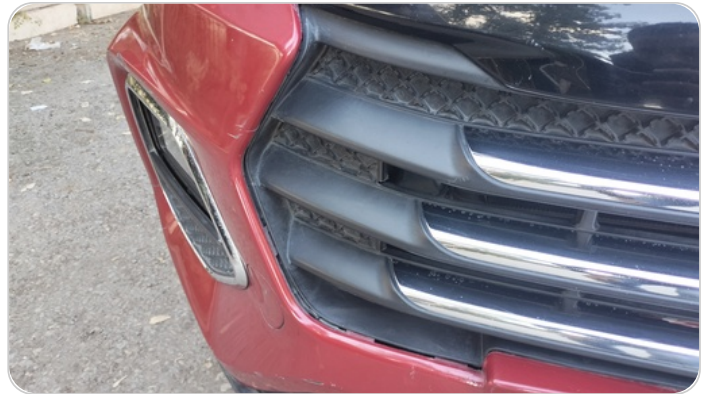
شبكة أمامية : شرخ / كسر