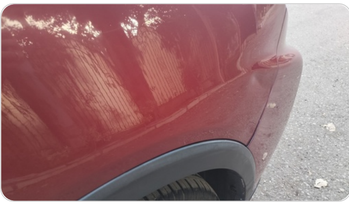
الرفرف الأمامي يمين : فبريكة (خبطات)