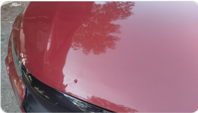
الكبوت : فبريكة (سمكره على البارد)