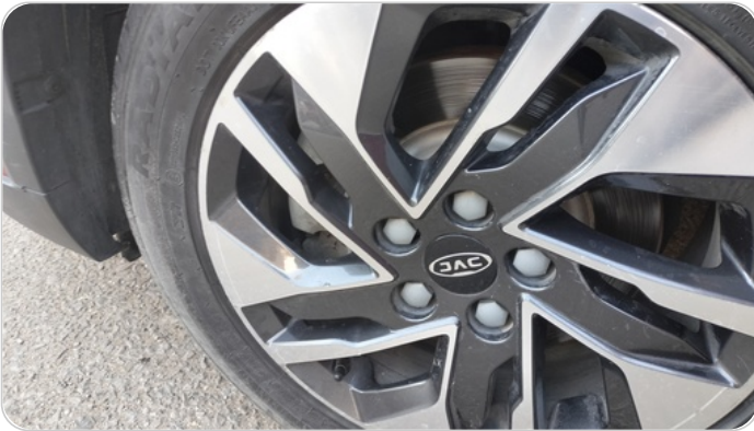
حالة الجنوط الأمامي : تجريحات بسيطة