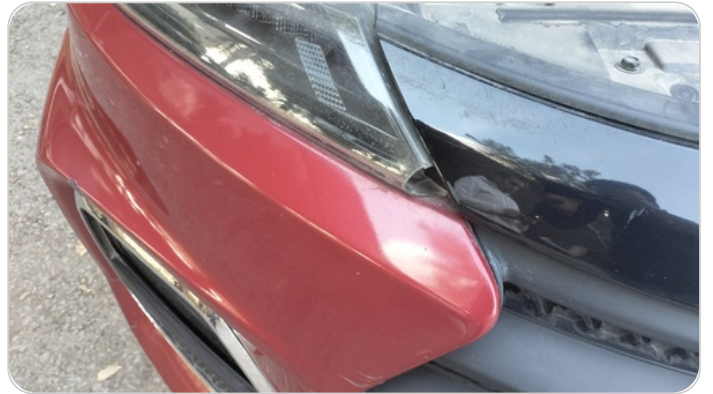
الكشاف الأمامي يمين : كسر بالباغة