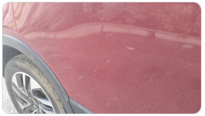
الباب الخلفي يمين : رش مع معجون (خرابيش)