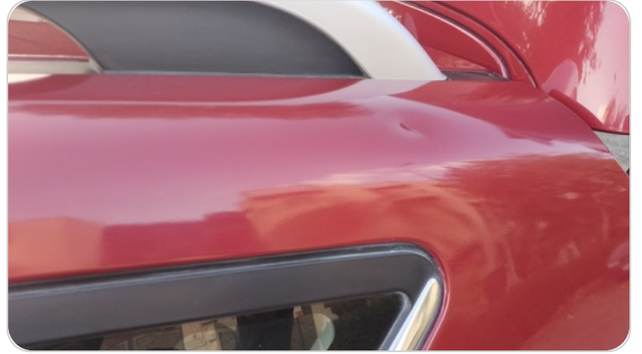
قائم خارجي خلفي شمال : رش بدون معجون (خبطات)