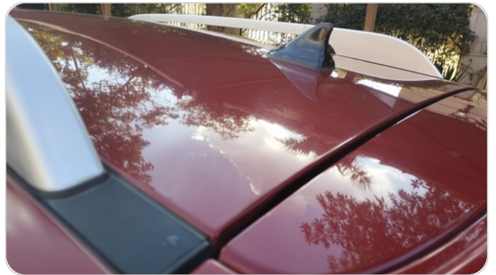
السقف : فبريكة (خرايش)