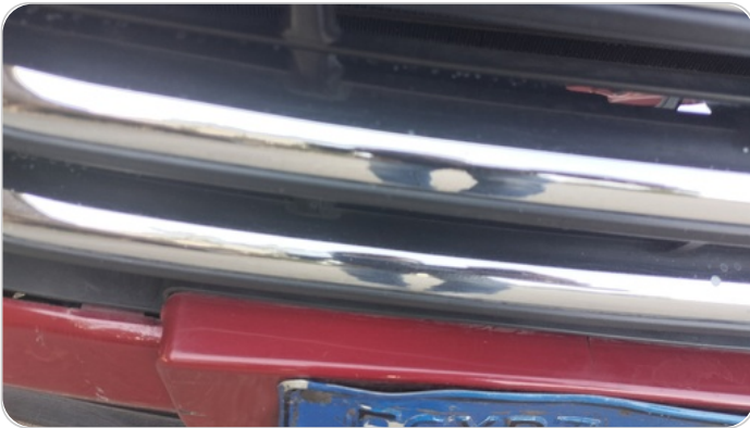
الاكصدام الأمامي : فبريكة (كسر)