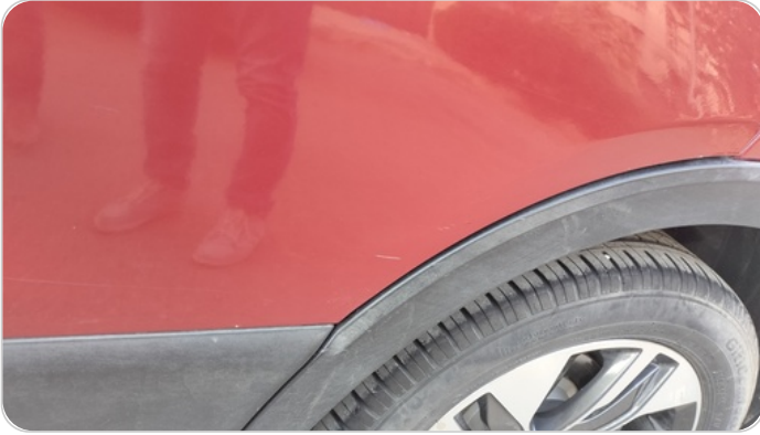
الباب الخلفي شمال : رش مع معجون (خرابيش)