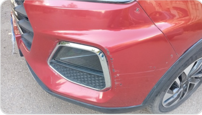
الاكصدام الامامي : فبريكة (كسر)