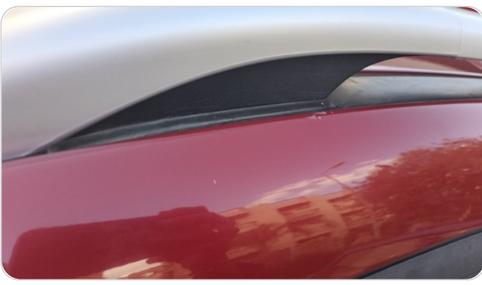
قائم خارجي أمامي شمال : فبريكة (خرابيش)