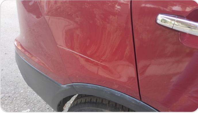
الرفرف الخلفي يمين : فبريكة (خرابيش - خبطات)