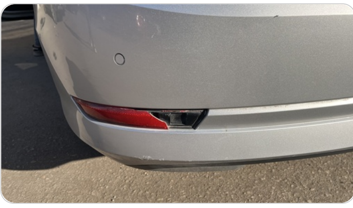
كشافات شبورة خلفي : كسر بالباغة