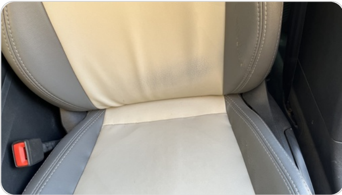
فرش كرسي أمامي شمال : قطع / كسر / شرخ / تلف