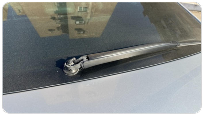
مساحة الزجاج الخلفي : الذراع مكسور