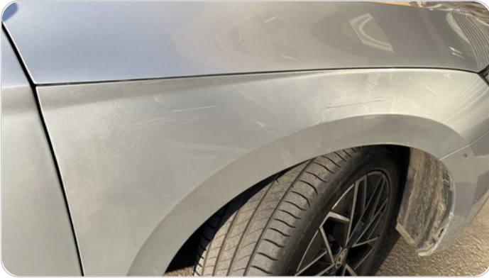
الرفرف الأمامي يمين : رش بدون معجون (خرابيش)