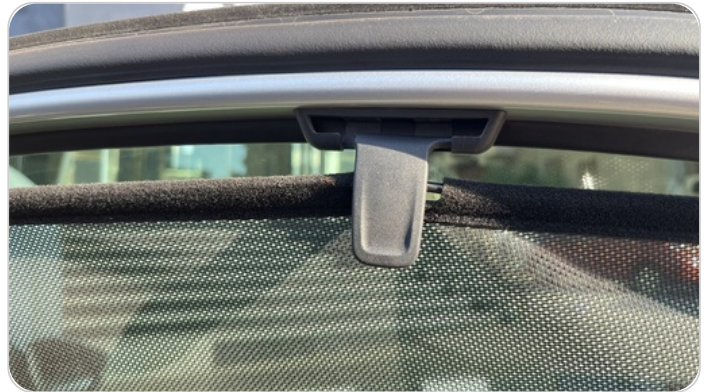
ستاره باب خلفي يمين : كسر