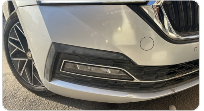
الكصدام الأمامي : فبريكة (خرابيش)