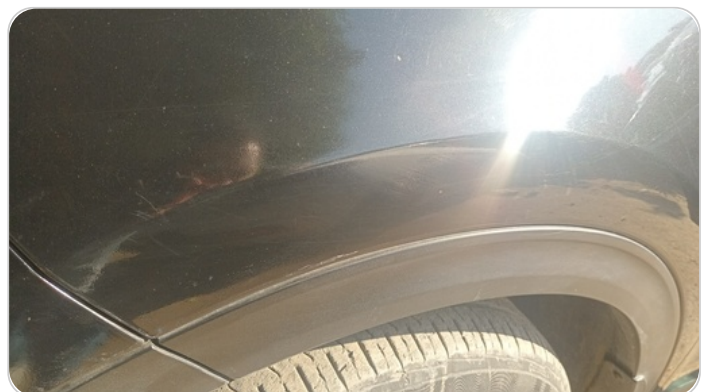
الرفرف الأمامي شمال : رش بدون معجون (خرابيش)