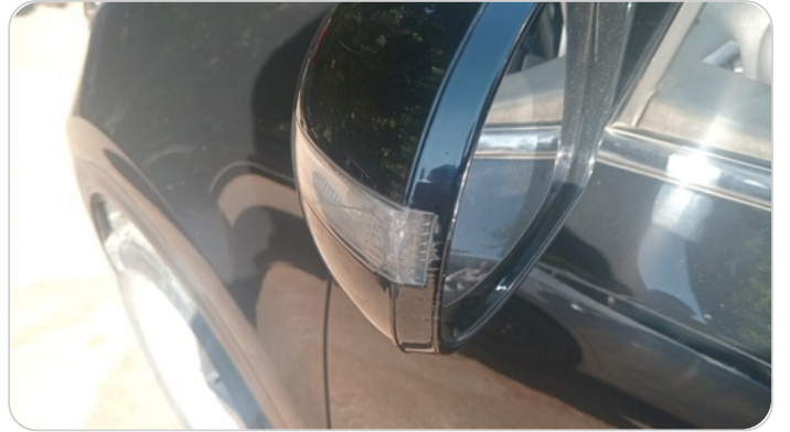
كشافات إشاره أمامي : كسر بالباغة