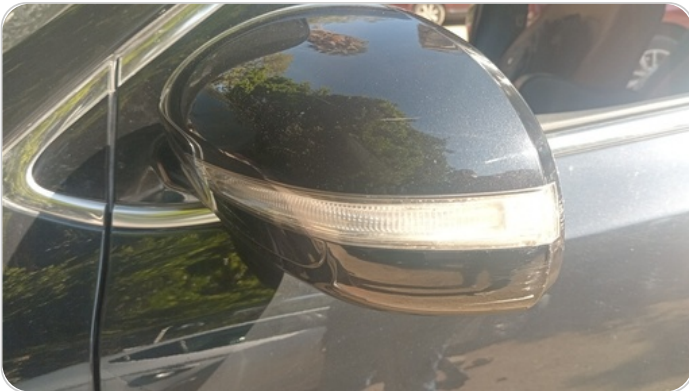
مرآة الباب الأمامي شمال : فبريكة (خرابيش)