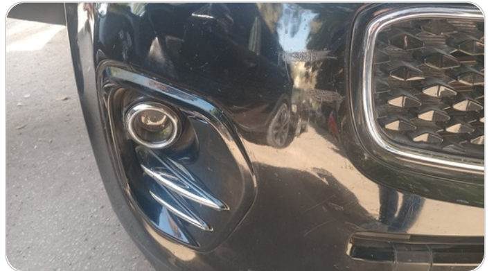
الاكصدام الأمامي : رش بدون معجون (خرابيش)