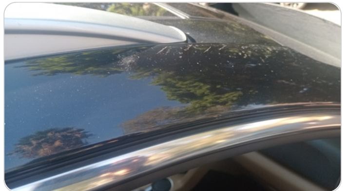
قائم خارجي أمامي يمين : فبريكة (الدهان متآكل)