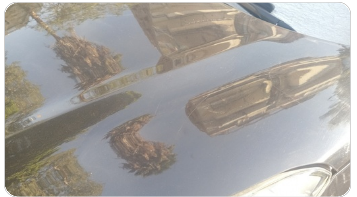
الكبوت : رش بدون معجون (خرابيش)