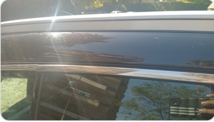
قائم خارجي خلفي يمين : فبريكة ( خرابيش )