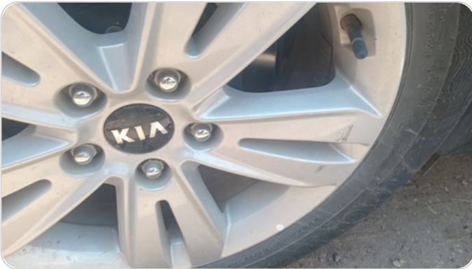
حالة الجنوط الخلفي : تجريحات بسيطة