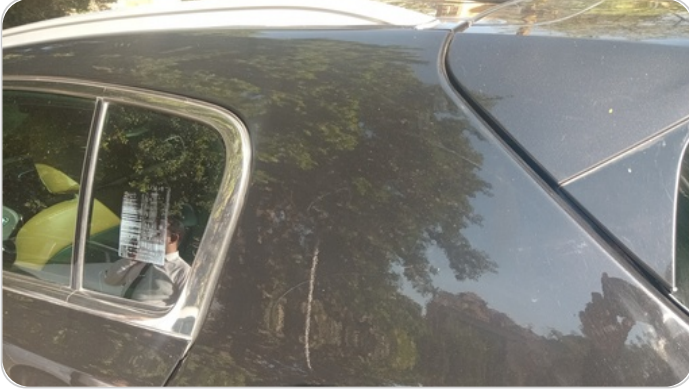
قائم خارجي خلفي شمال : رش بدون معجون (خرابيش)