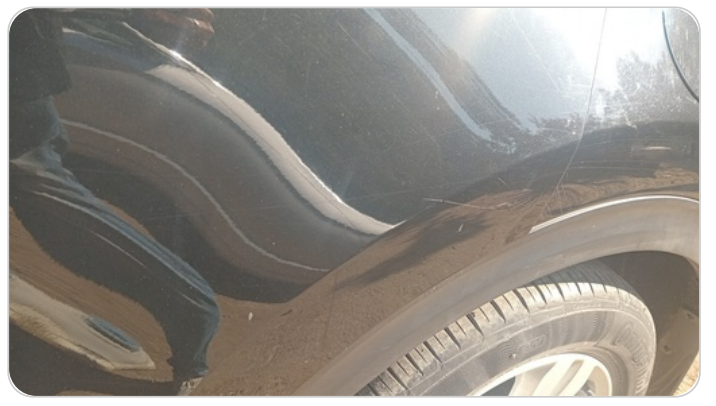
الباب الخلفي شمال : فبريكة (خرابيش - خبطات)