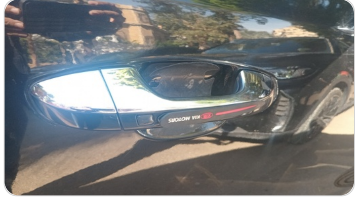
مقابض الابواب : يوجد استيكر