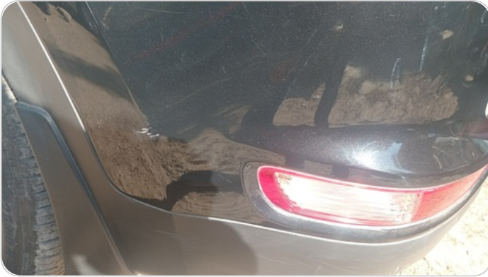
الاكصدام الخلفي : رش بدون معجون (خرابيش)