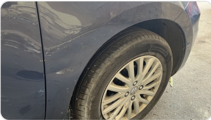
الرفرف الأمامي يمين : فبريكة (خبطات)