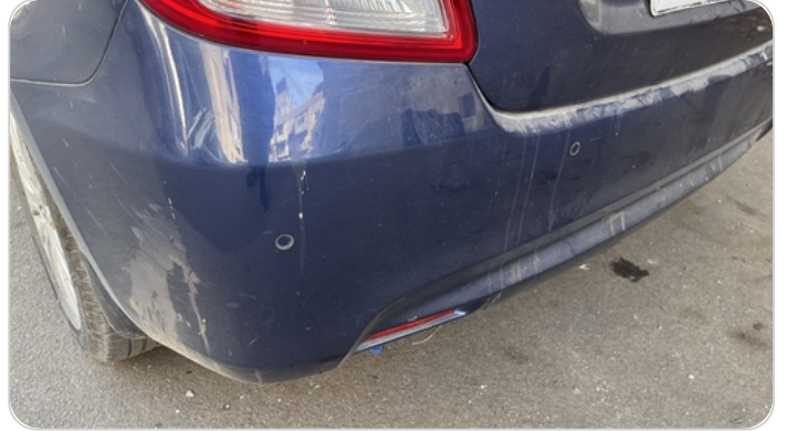
الاكصدام الخلفي : رش بدون معجون (خرابيش)