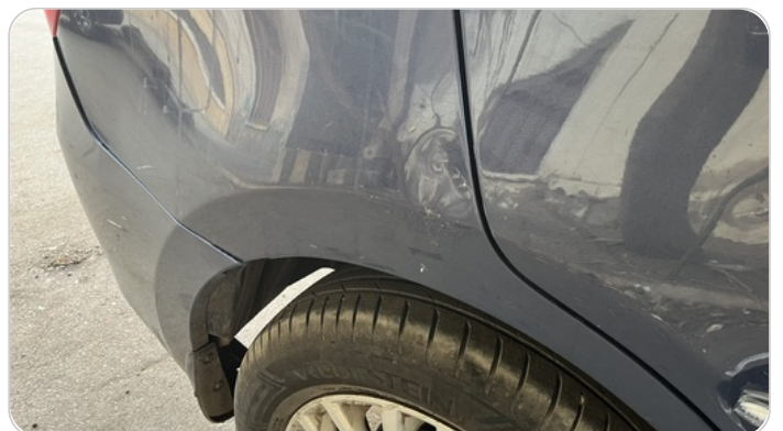
الرفرف الخلفي يمين : رش مع معجون (خرابيش)