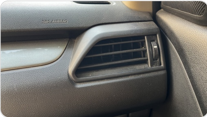
هوايات التكييف : كسر (هواية واحدة)