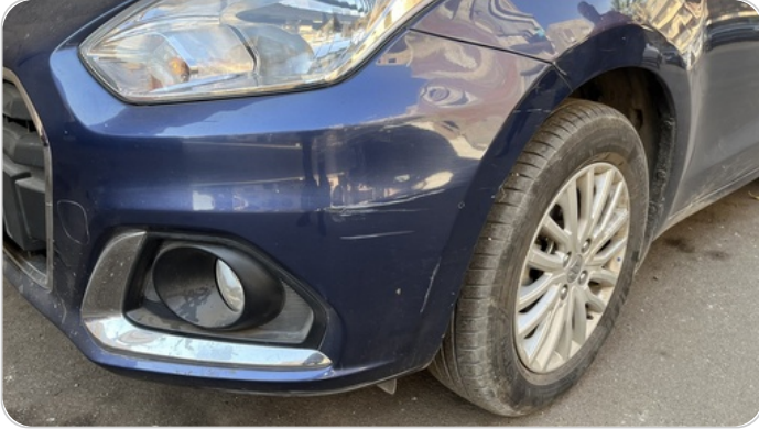
الاكصدام الأمامي : رش بدون معجون (خرابيش)