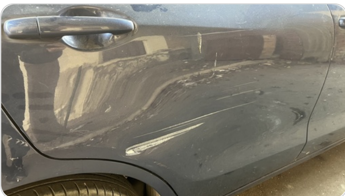
الباب الخلفي يمين : رش مع معجون (خبطات)