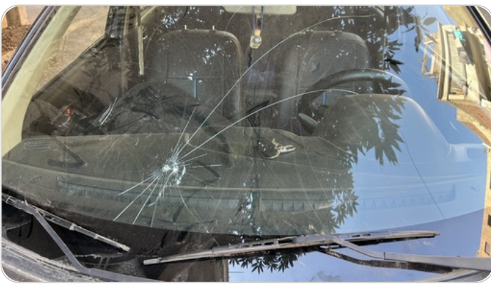
زجاج السيارة الأمامي : شروخ أو كسور