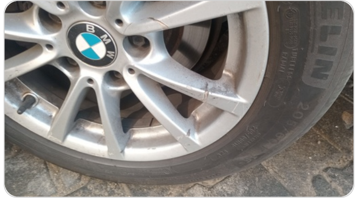
حالة الجنوط الخلفي : تجريحات بسيطة