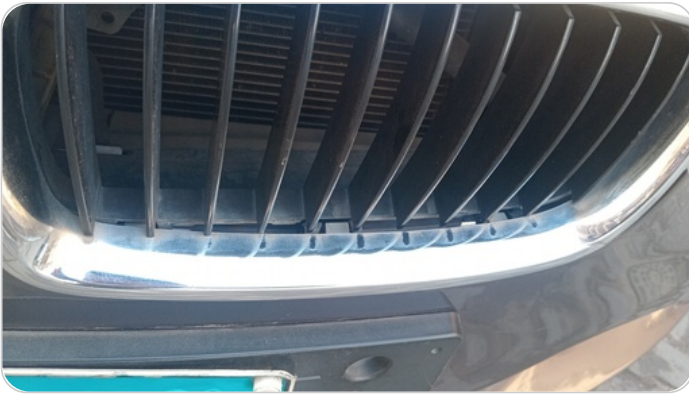
شبكة أمامية : شرخ / كسر