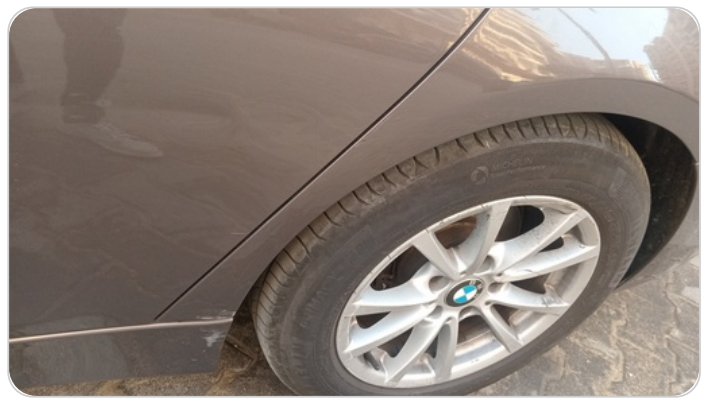
الرفرف الخلفي شمال : رش بدون معجون (خرابيش)