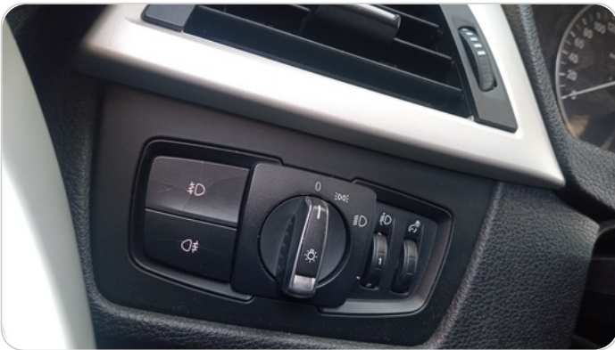
مفتاح الأنوار : يوجد كسر