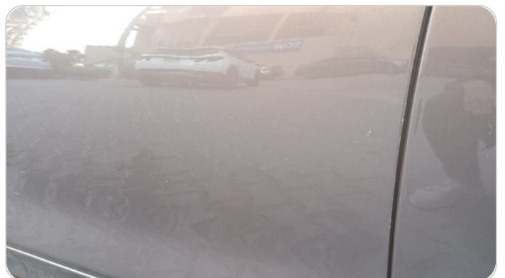
الباب الأمامي شمال : رش بدون معجون (خرابيش)