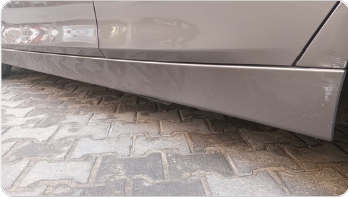
العتب السفلي شمال : رش بدون معجون (خرابيش)