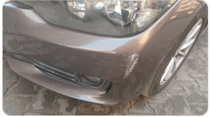
الاصدام الأمامي : رش مع معجون (خرابيش)