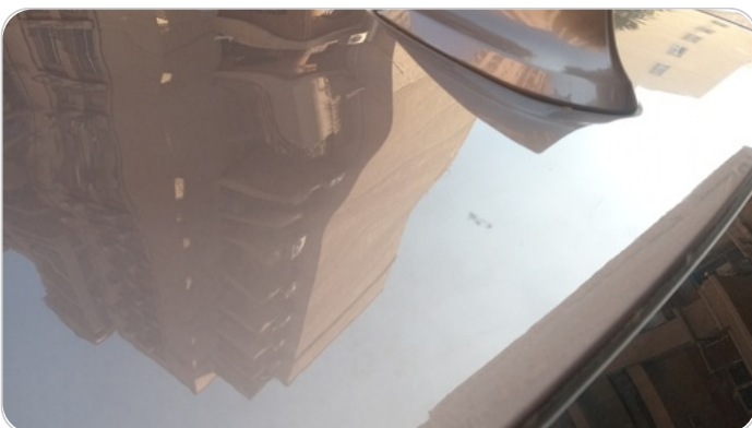
السقف : فبريكة (خرابيش)