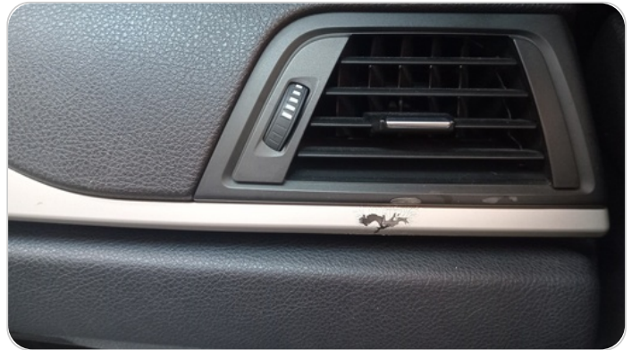
نيكل هواية التكيف : تاكل