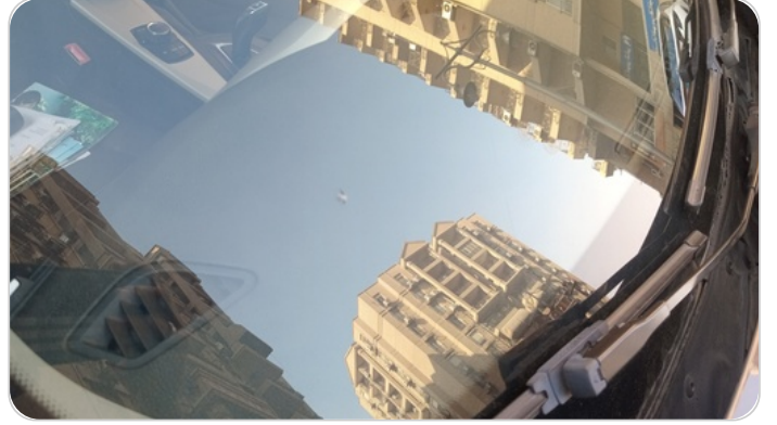
زجاج السيارة الأمامي : نقرة