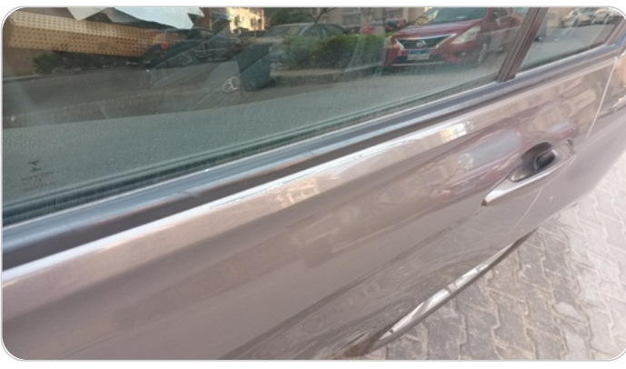
الباب الخلفي شمال : رش مع معجون (خرابيش)