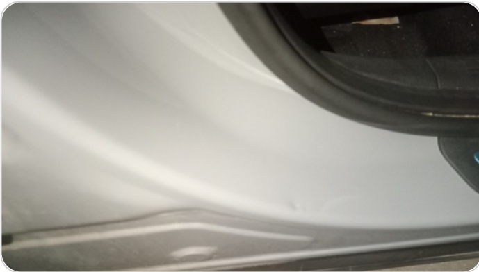
دواخل وقوائم باب أمامي يمين : فبريكة (نقرة)