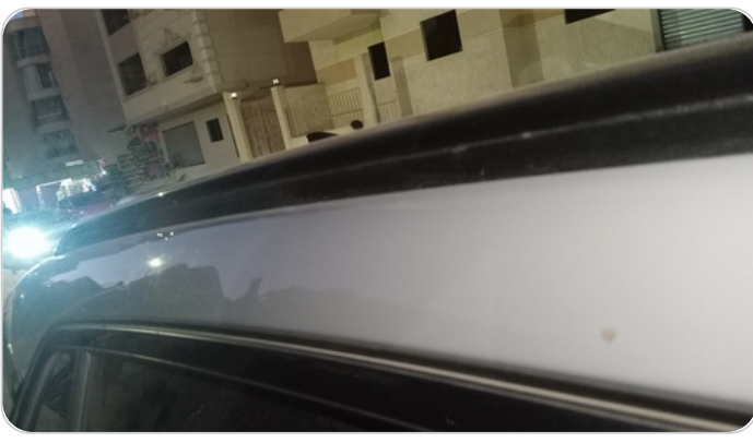
قائم خارجي خلفي يمين : فبريكة (خبطات)