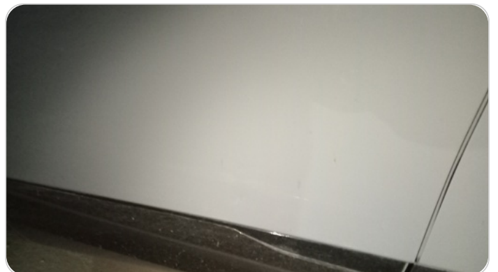
الباب الخلفي يمين : فبريكة (خرابيش - خبطات)