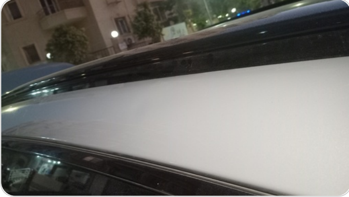
قائم خارجي خلفي شمال : فبريكة (خبطات)