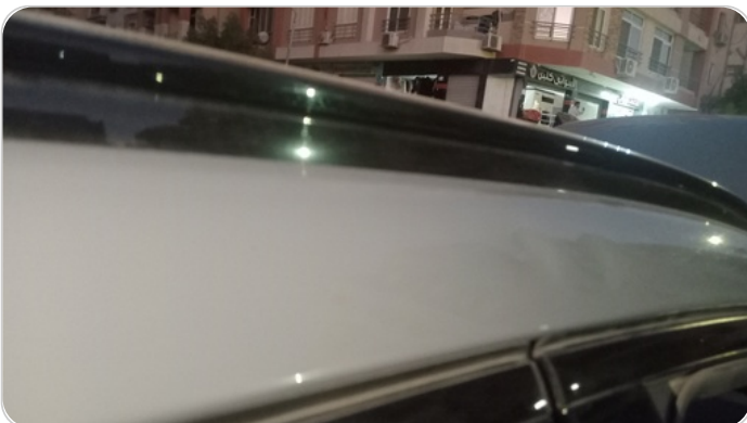
قائم خارجي أمامي يمين : فبريكة (خبطات)