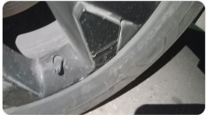
حالة الكاوتش الأمامي : تشققات/قطع بسيط