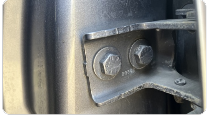
مفصلات ومسامير الباب الخلفي شمال : آثار فك وتركيب