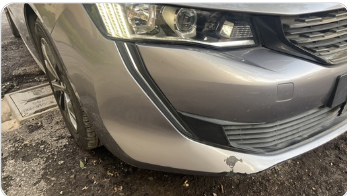
الاكصدام الأمامي : فبريكة (خرابيش)