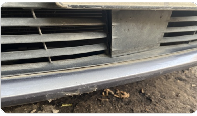
شبكة أمامية : شرخ / كسر