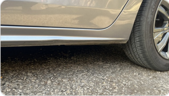
العتب السفلي شمال : فبريكة (خرابيش)