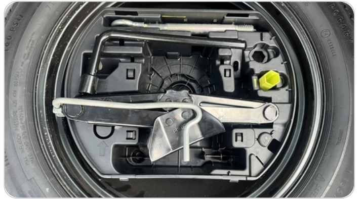
العدة وأدوات الأمان : متوفرة (بحالة غير جيدة)