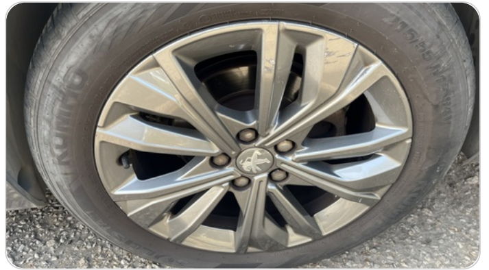
حالة الجنوط الخلفي : تجريحات بسيطة