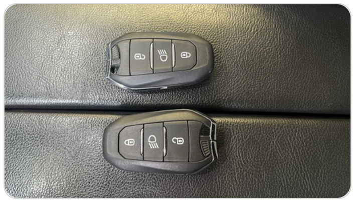
الريموت /المفتاح الاضافي : موجود (لم يتم التجربة)