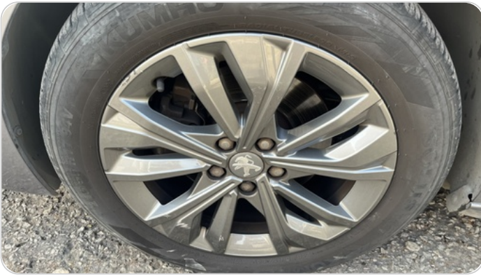
حالة الجنوط الأمامي : تجريحات بسيطة