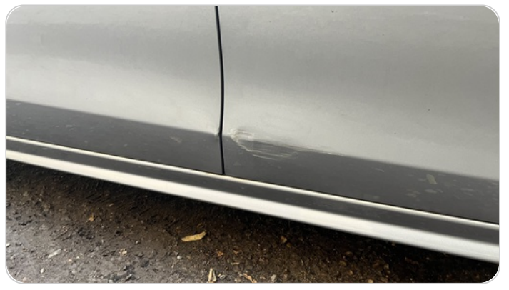
الباب الأمامي يمين : فبريكة (خرابيش)