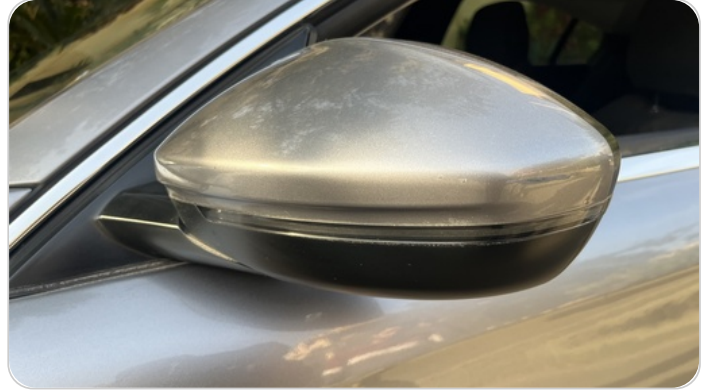
مرآة الباب الأمامي شمال : فبريكة (خرابيش)