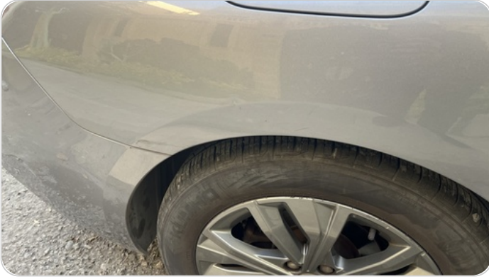
الرفرف الخلفي يمين : فبريكة (خرابيش)