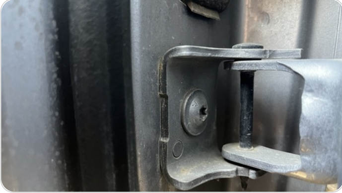
مفصلات ومسامير الباب الأمامي شمال : آثار فك وتركيب