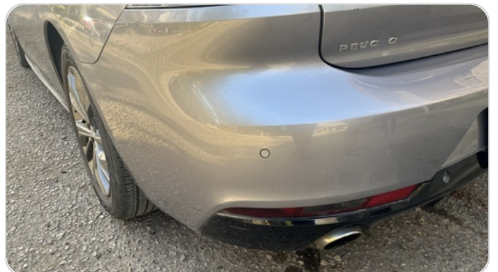
الاكصدام الخلفي : فبريكة (خرابيش)