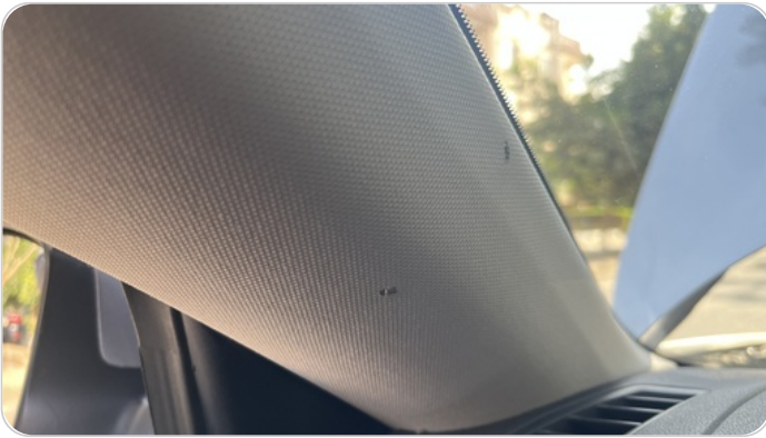
فيبر قائم أمامي شمال : قطع / كسر / شرخ / تلف