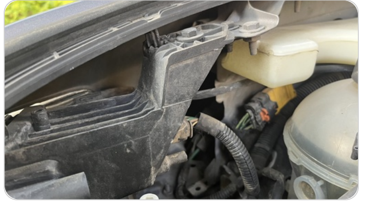
الكشاف الأمامي يمين : كسر في قواعد الكشاف