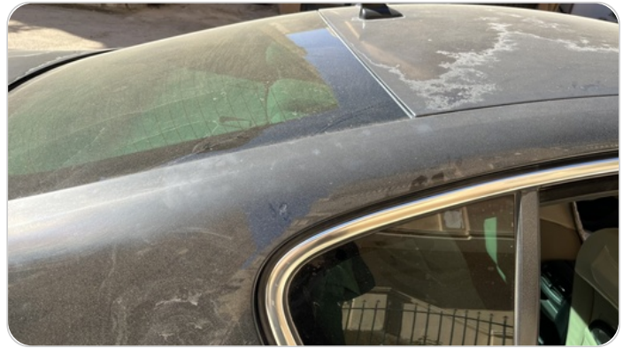
قائم خارجي خلفي يمين : فبريكة (الدهان متآكل)