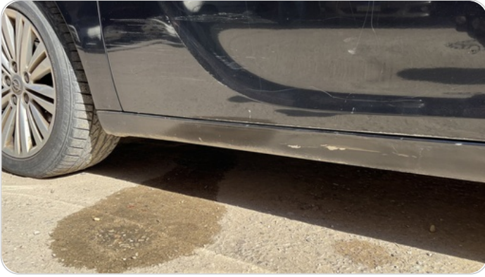
العتب السفلي شمال : فبريكة (خبطات)