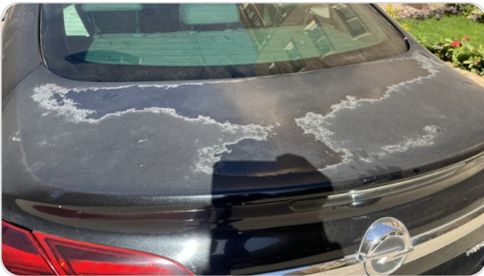
باب الشنطة : فبريكة (الدهان متآكل)