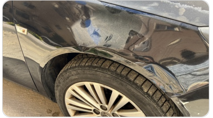
الرفرف الأمامي يمين : فبريكة (خبطات)