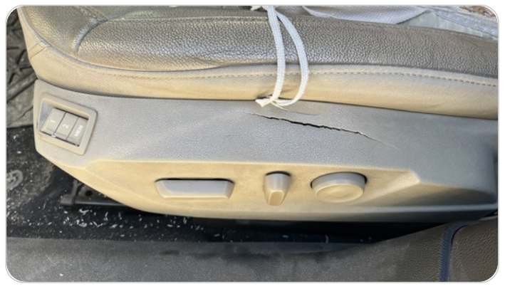
فرش كرسي أمامي شمال : قطع /كسر / شرخ /تلف