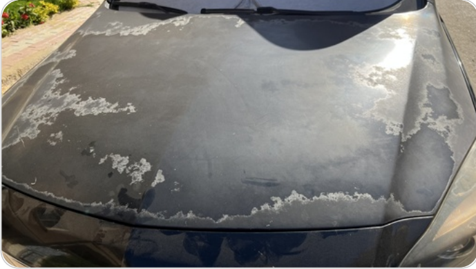
الكبوت : فبريكة ( الدهان متآكل )