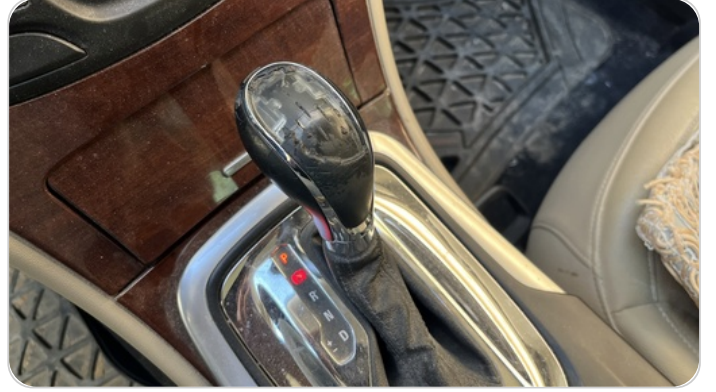
الكونسول الوسط : قطع /كسر / شرخ /تلف