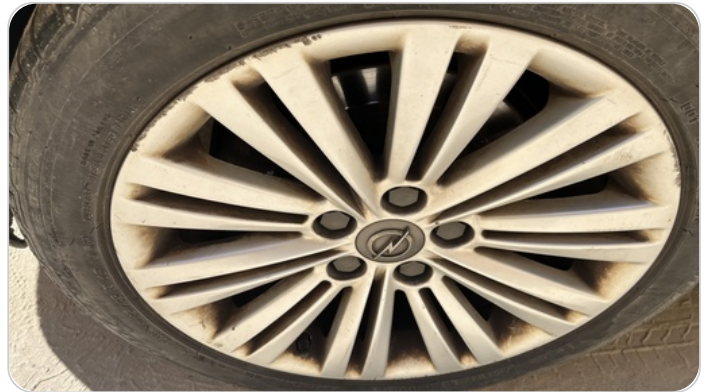
حالة الجنوط الخلفي : تجريحات بسيطه