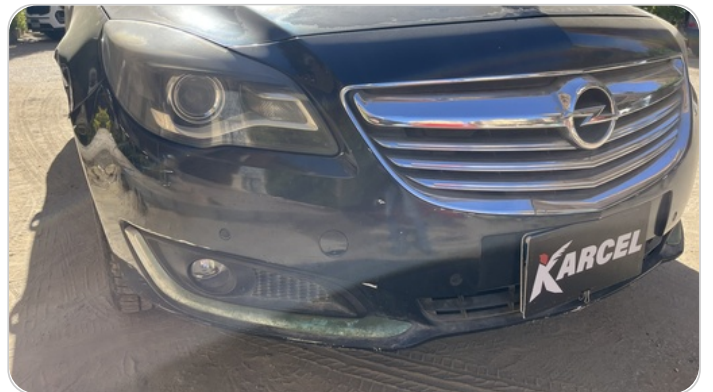
الكصدام الأمامي : فبريكة (خرايبش)