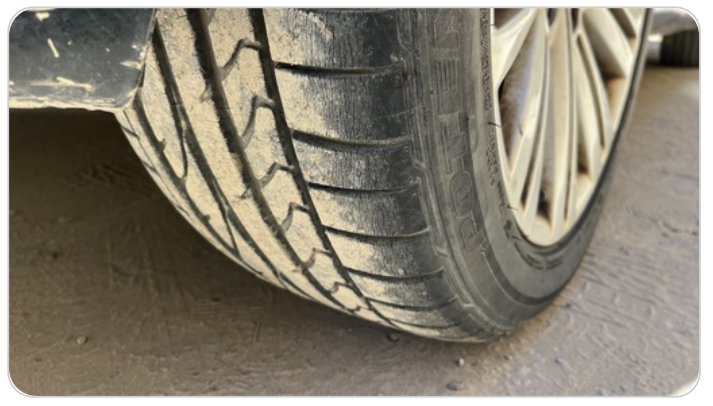
حالة الكاوتش الخلفي : النقشة متآكلة