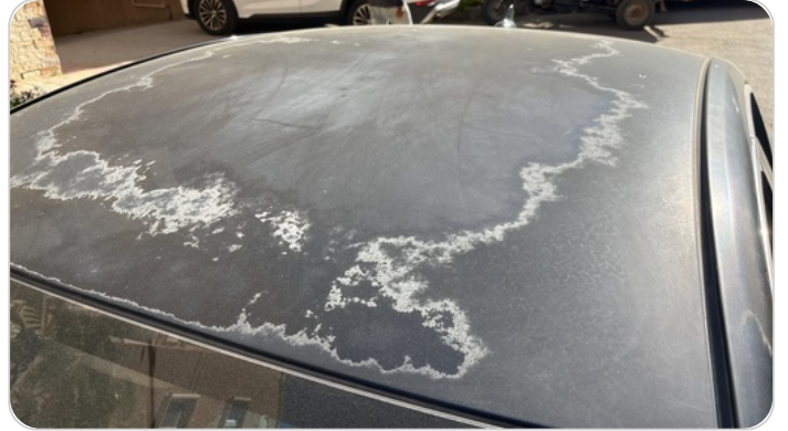
السقف : فبريكة ( الدهان متآكل )