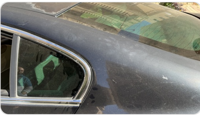
قائم خارجي خلفي شمال : فبريكة (الدهان متآكل)