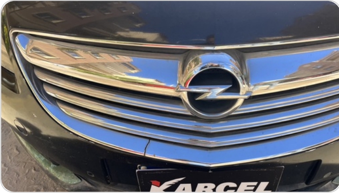
شبكة أمامية : شرخ / كسر