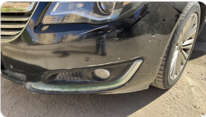
الكصدام الامامي :