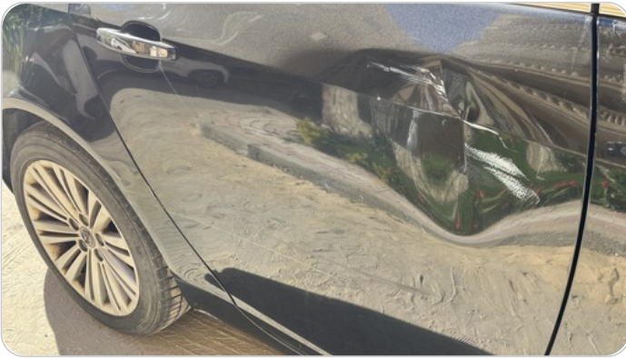
الباب الخلفي يمين : فبريكة (خبطات)