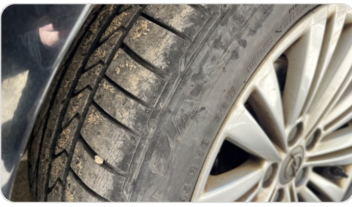
حالة الكاوتش الأمامي : النقشة متآكلة