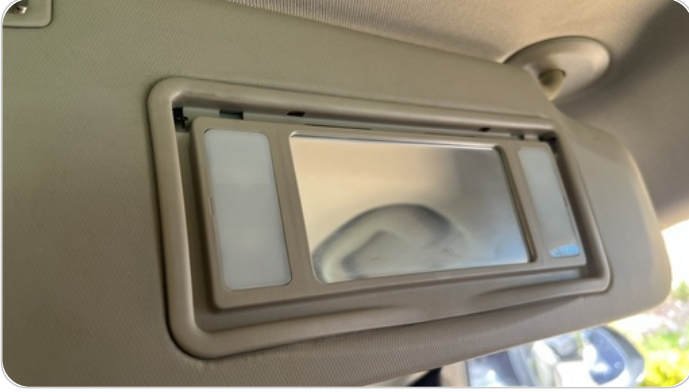
شماسات أمامية : تلف في اليمين