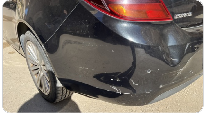
الاكصدام الخلفي : فبريكة (كسر)