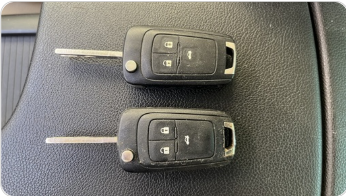
الريموت /المفتاح الاضافي : يعمل بكفاءة