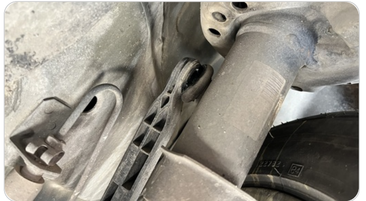
ذراع الميزان : تشققات (كاوتش الميزان)