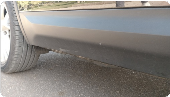
العتب السفلي يمين : فبريكة (خبطات)