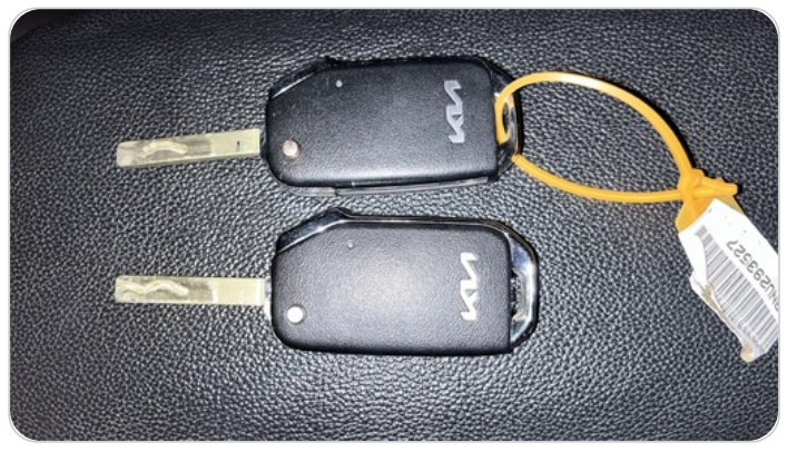
الريموت /المفتاح الاضافي : موجود (لم يتم التجربة)