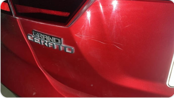
باب الشنطة : فبريكة (خرابيش)