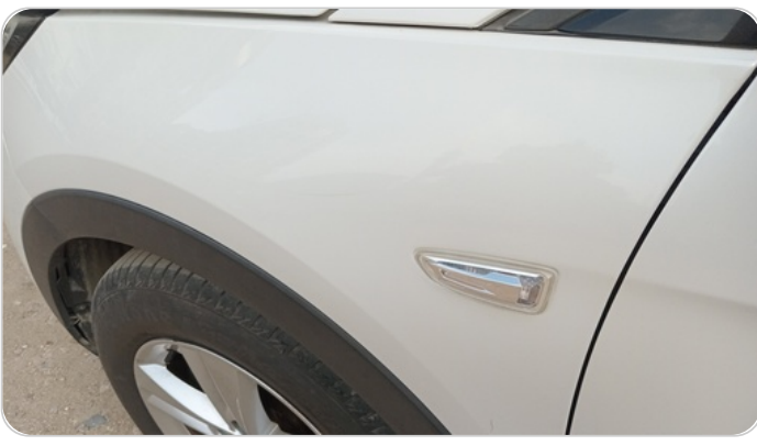
الرفرف الأمامي شمال : فبريكة (خرابيش)