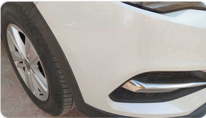
الكصدام الأمامي : فبريكة (خرابيش)