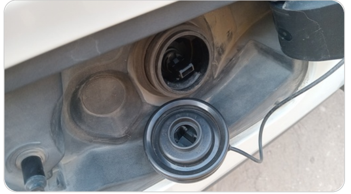
غطاء التانك : كسر