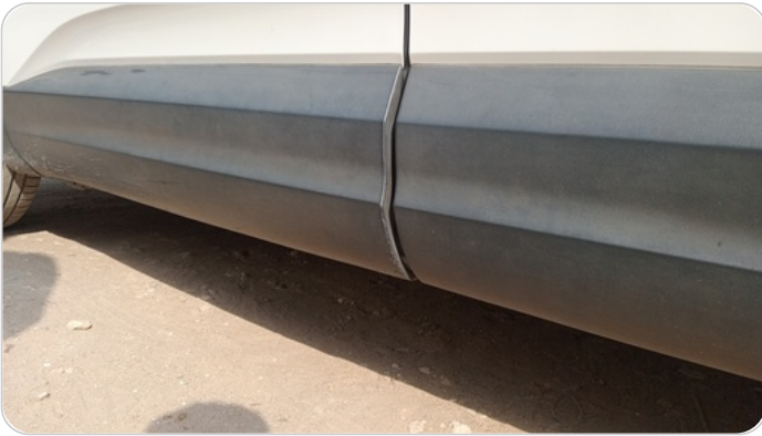
العتب السفلي شمال : فبريكة (خرابيش)