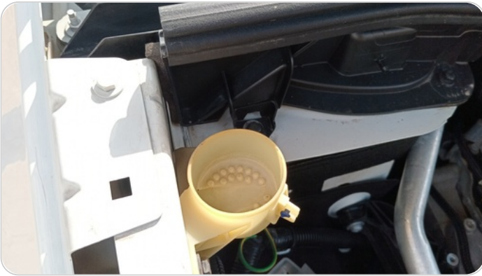
غطاء قربة المساحات : فقد