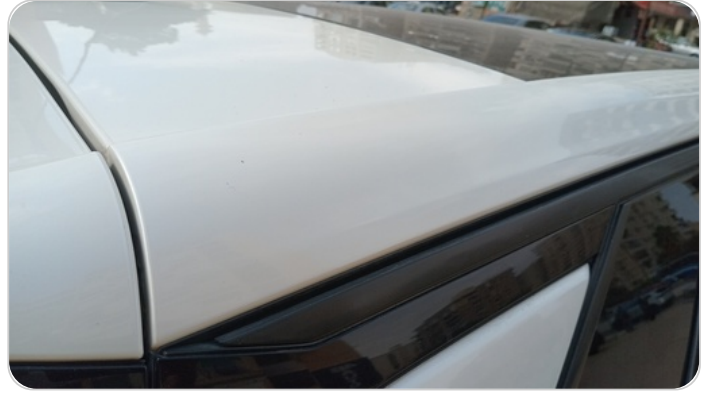
قائم خارجي خلفي يمين : فبريكة (خرابيش)