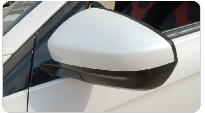
مراية الباب الأمامي شمال : فبريكة (خرابيش)