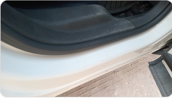
دواخل وقوائم باب خلفي يمين : فبريكة (خرابيش)