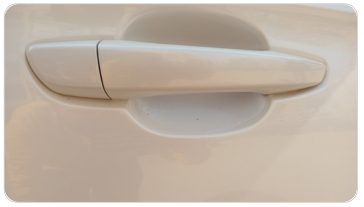
الباب الأمامي يمين : فبريكة (خرابيش)