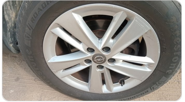
حالة الجنوط الخلفي : تجريحات بسيطة