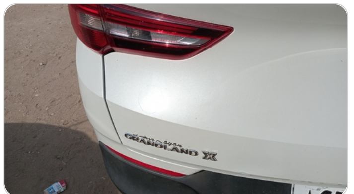
باب الشنطة : فبريكة (خرايبش)