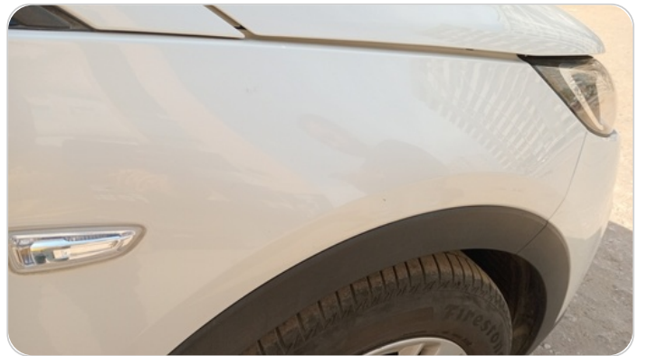
الرفرف الأمامي يمين : فبريكة (خرابيش)