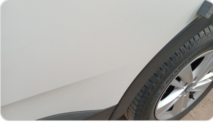
الباب الخلفي شمال : فبريكة (خرابيش)