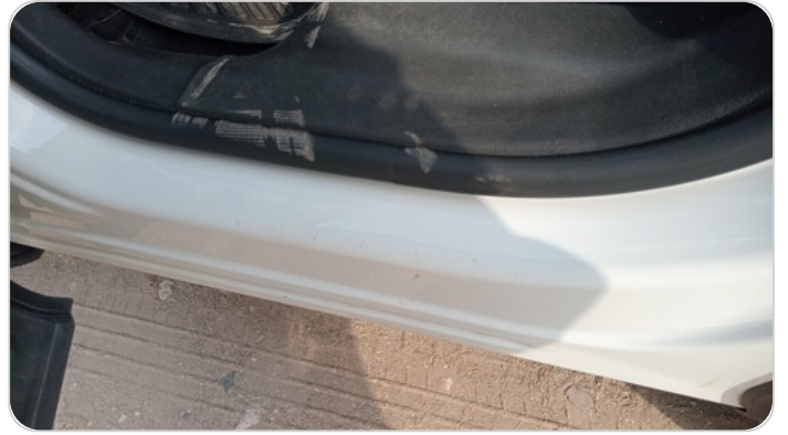
دواخل وقوائم باب الخلفي شمال : فبريكة (خرابيش)