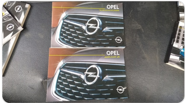
كتيب الضمان : موجود