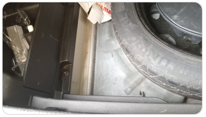
دواخل وأرضية الشنطة : فبريكة (خرابيش)