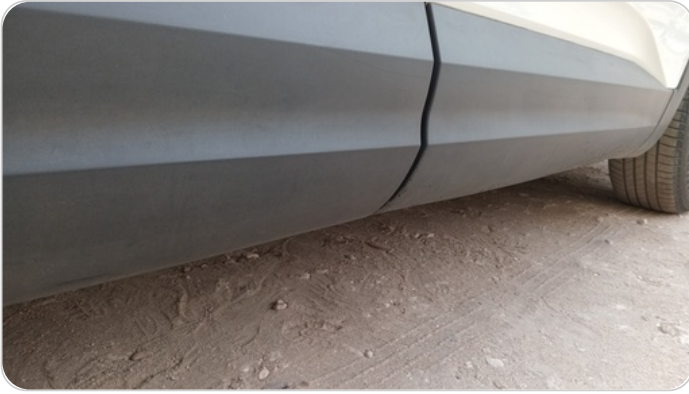
العتب السفلي يمين : فبريكة (خرابيش)