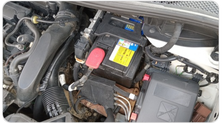
قاعدة البطارية : صدا