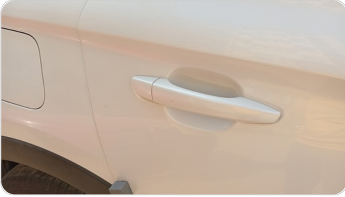
الباب الخلفي يمين : فبريكة (خرابيش)