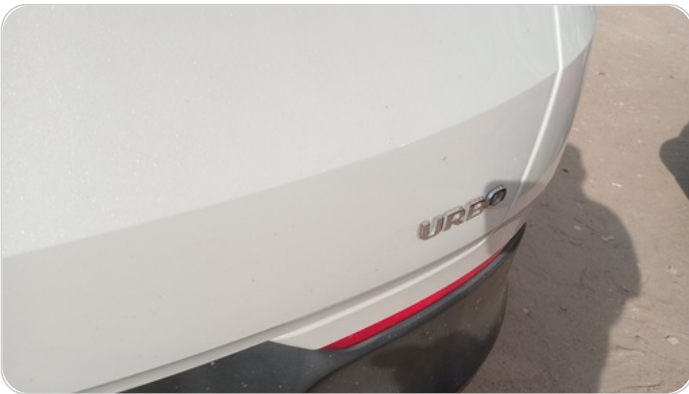
حرف باب الشنطة : فقد