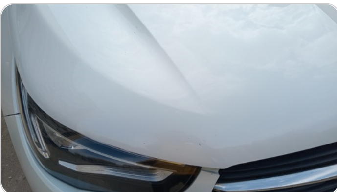
الكبوت : فبريكة (خرايبش)