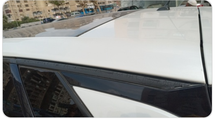
قائم خارجي خلفي شمال : فبريكة (خرابيش)