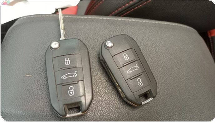
الريموت /المفتاح الاضافي : يعمل بكفاءة