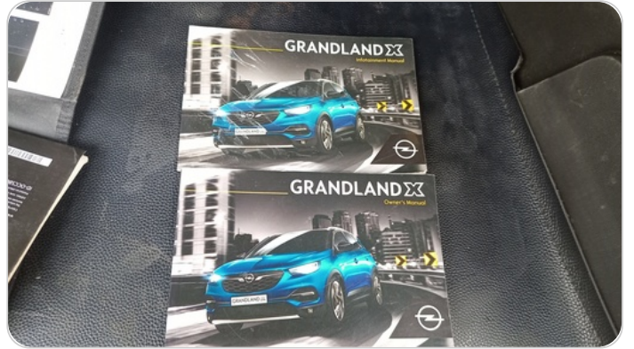
كتالوج السيارة : موجود