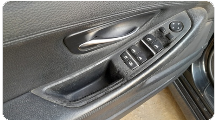
فرش الباب الأمامي شمال : قطع/كسر/شرخ/تلف