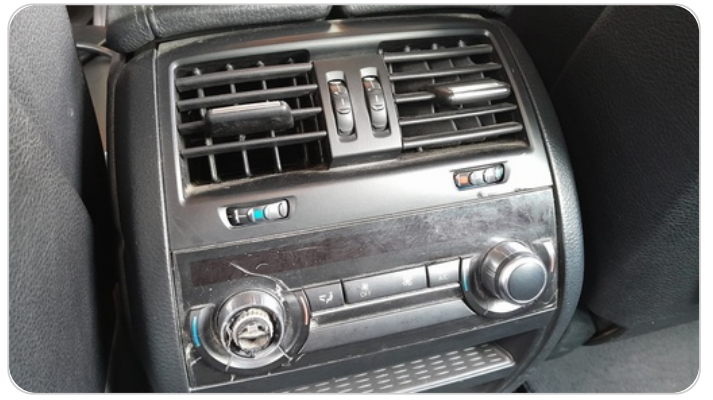
وحده تحكم تكييف و هوايه خلفيه : كسر