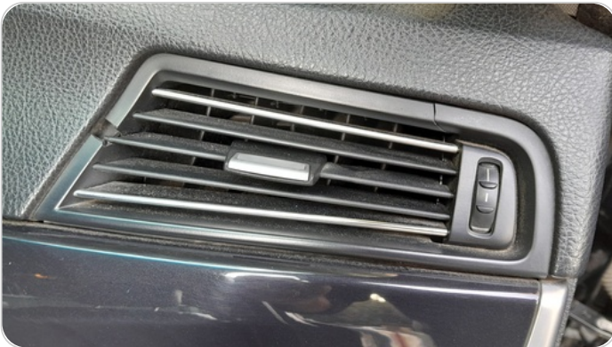
هوايات التكييف : كسر (هواية واحدة)