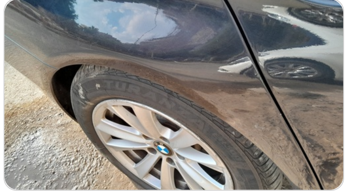
الرفرف الخلفي يمين : رش مع معجون (خرايش)