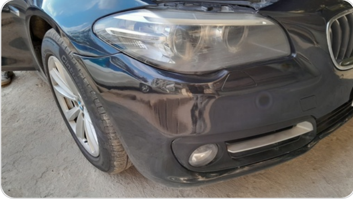
الاكصدام الأمامي : رش مع معجون (خرايش)