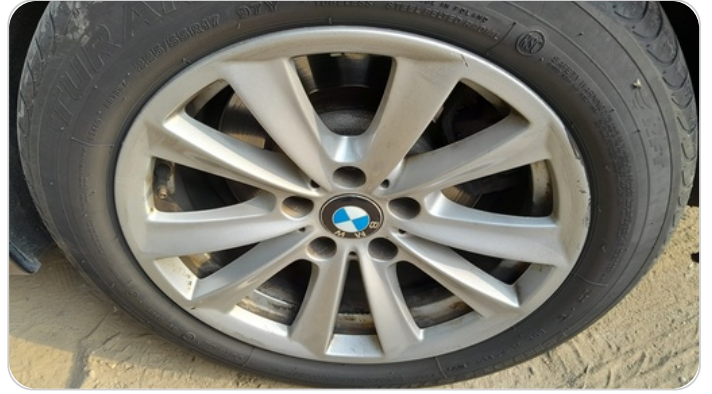
حالة الجنوط الخلفي : تجريحات بسيطه