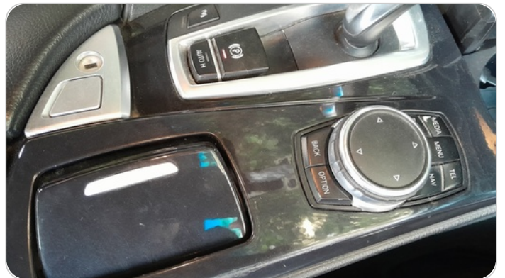
الكونسول الوسط : قطع /كسر / شرخ /تلف