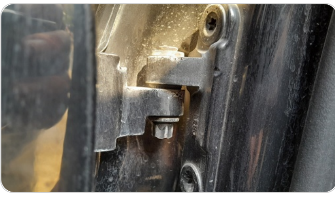
مفصلات ومسامير الباب الخلفي يمين : آثار فك وتركيب