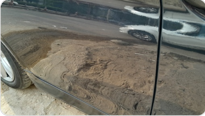
الباب الخلفي يمين : رش مع معجون (خرايش)