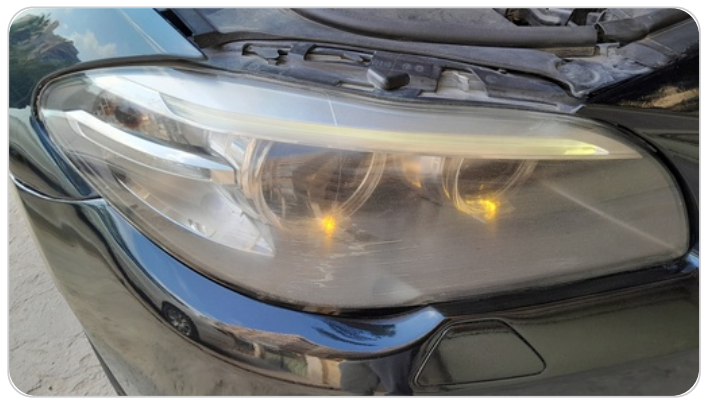
الكشاف الأمامي يمين : كسر بالباغة