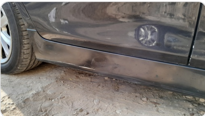
العتب السفلي يمين : رش مع معجون (خرايش)