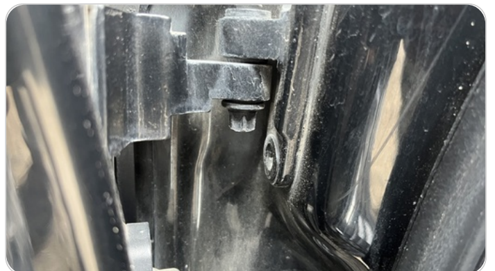
مفصلات ومسامير الباب الأمامي يمين : آثار فك وتركيب