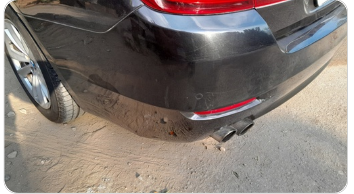
الاكصدام الخلفي : رش مع معجون (خرايش)