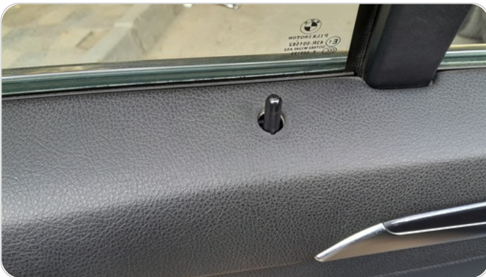
فرش الباب الخلفي شمال : قطع /كسر/شرخ/تلف