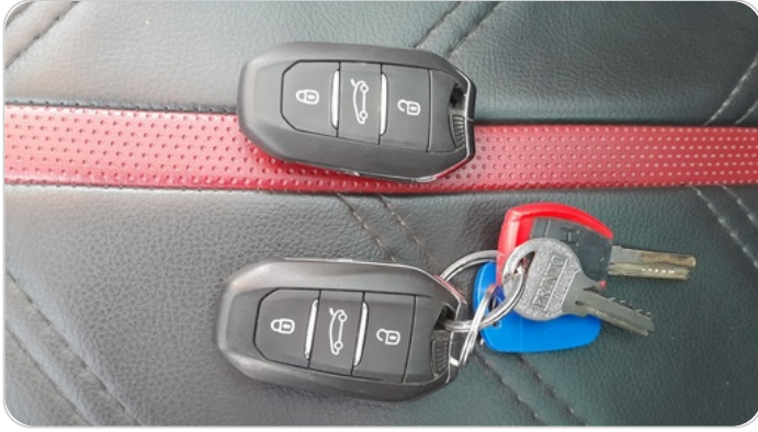
الريموت /المفتاح الاضافي : يعمل بكفاءة