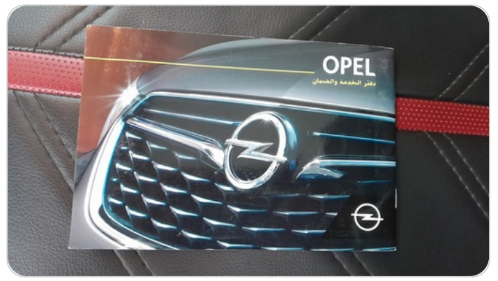
كتيب الضمان : موجود