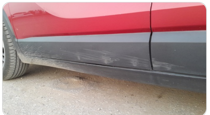
العتب السفلي شمال : فبريكة (خرابيش)