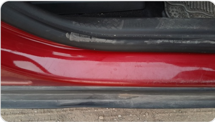
دواخل وقوائم باب أمامي يمين : فبريكة (خرابيش)