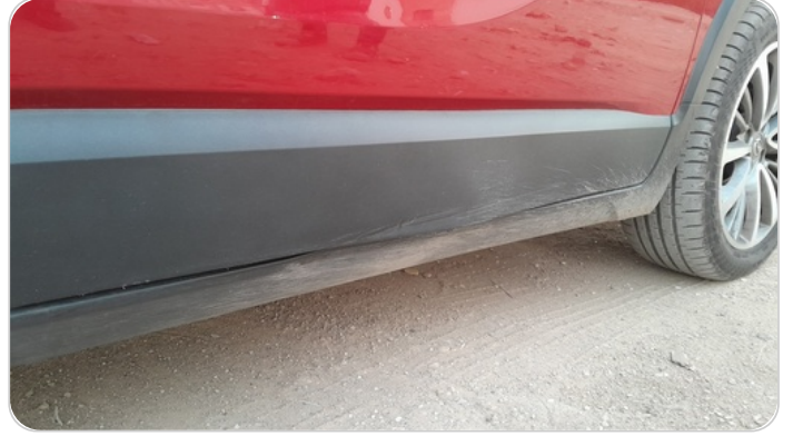
العتب السفلي يمين : فبريكة (خبطات)