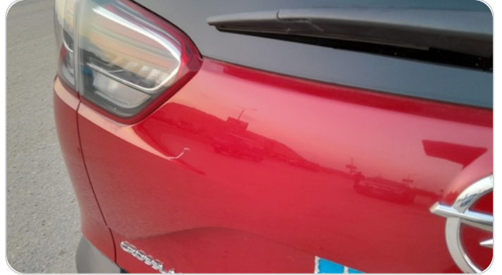
باب الشنطة : فبريكة (خرابيش)