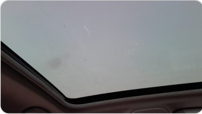
زجاج البانوراما : شروخ أو كسور