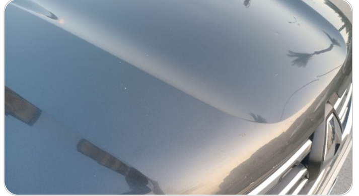
الكبوت : فبريكة (خرابيش)