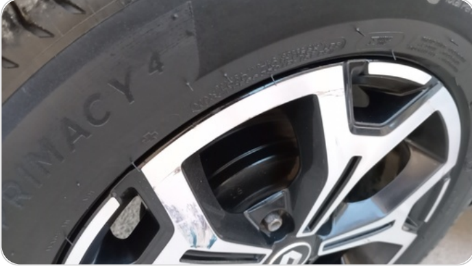
حالة الجنوط الخلفي : تجريحات بسيطة