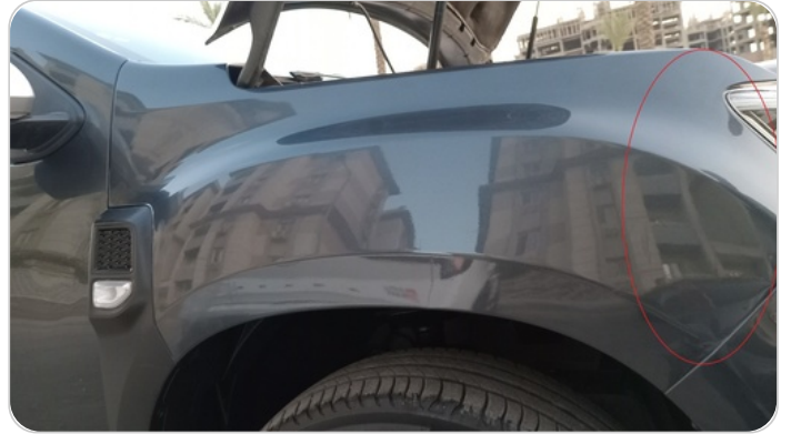
رفرف امامي يمينا : رش بمعجون جزئي