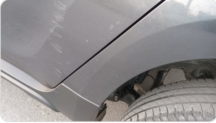
الرفرف الخلفي شمال : فبريكة (خرابيش)