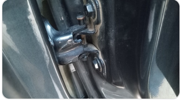
مفصلات ومسامير الباب الأمامي يمين : آثار فك وتركيب