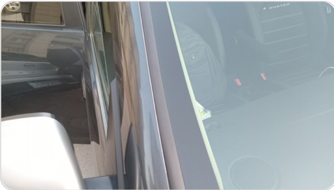
قائم خارجي أمامي يمين : فبريكة (الدهان متآكل)