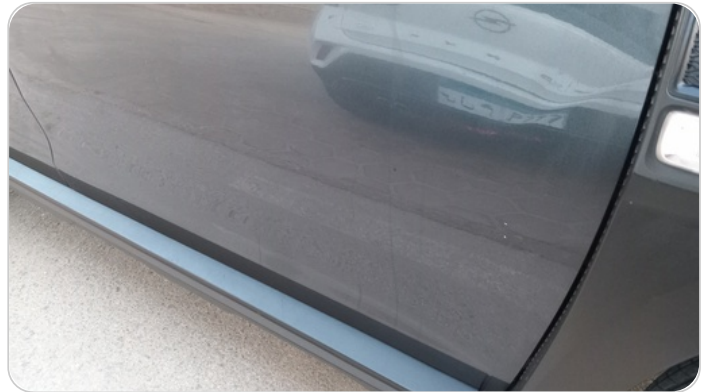
الباب الأمامي يمين : فبريكة (خرابيش)