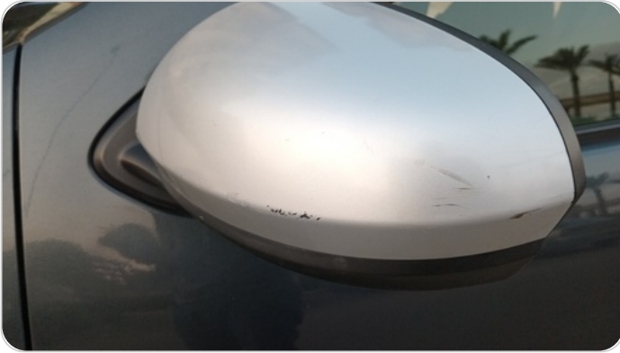
مراية الباب الأمامي شمال : فبريكة (خرابيش)