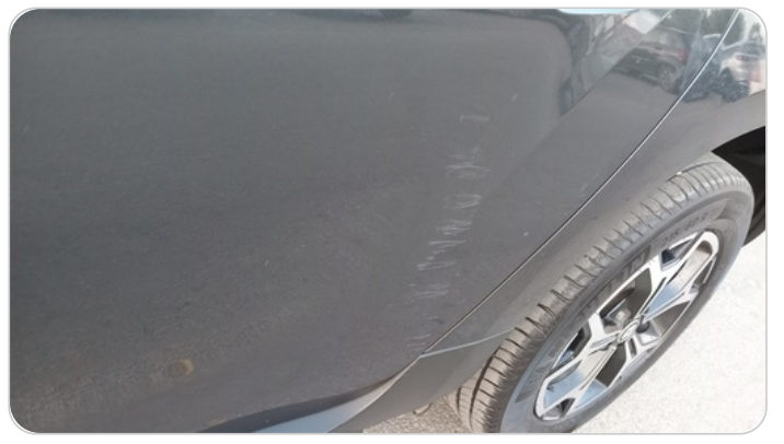
الباب الخلفي شمال : فبريكة (خرابيش)