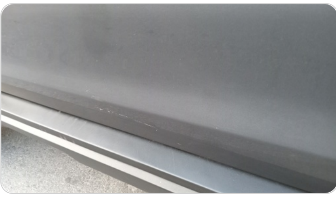
الباب الأمامي شمال : فبريكة (خرابيش)