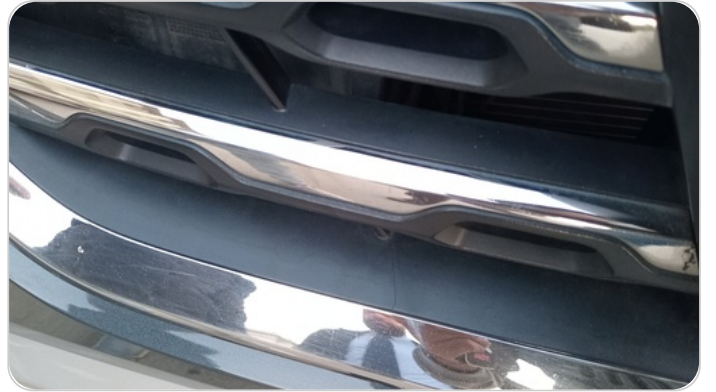
شبكة أمامية : شرخ / كسر