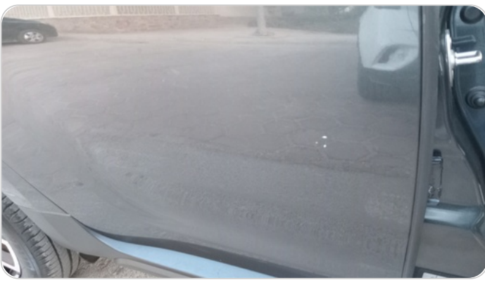
الباب الخلفي يمين : فبريكة (خرابيش)