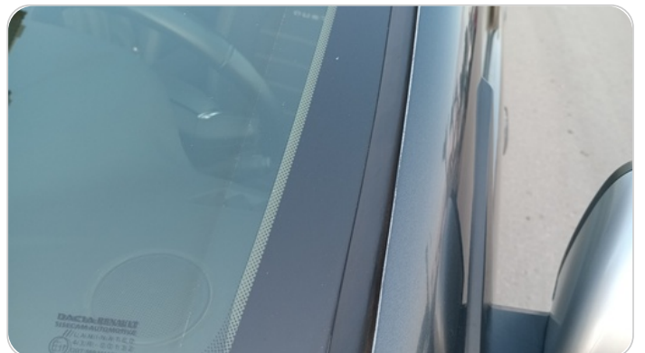
قائم خارجي أمامي شمال : فبريكة (الدهان متآكل)