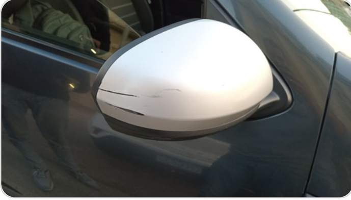
مراية الباب الأمامي يمين : فبريكة (خرابيش)