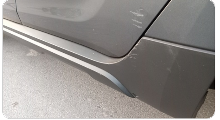
العتب السفلي شمال : فبريكة (خرابيش)