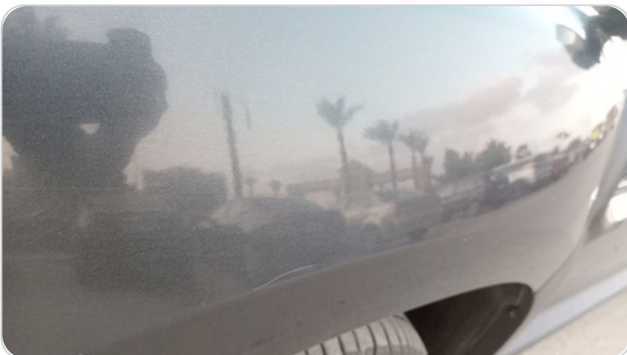
الرفرف الأمامي شمال : فبريكة (خرابيش)