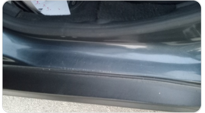
دواخل وقوائم باب الخلفي شمال : فبريكة (خرابيش)