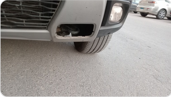
طبة اكصدام امامي : فقد