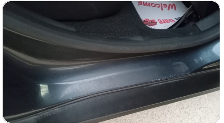
دواخل وقوائم باب خلفي يمين : فبريكة (خرابيش)