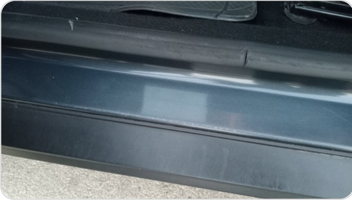
دواخل وقوائم باب الأمامي شمال : فبريكة (خرابيش)