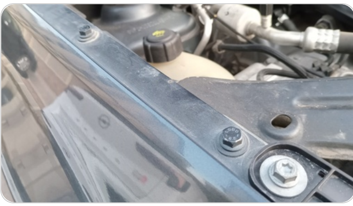
رفرف امامي يمينا : اثار فك وتركيب