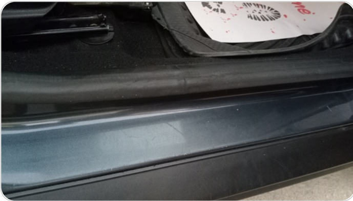
دواخل وقوائم باب أمامي يمين : فبريكة (خرابيش)