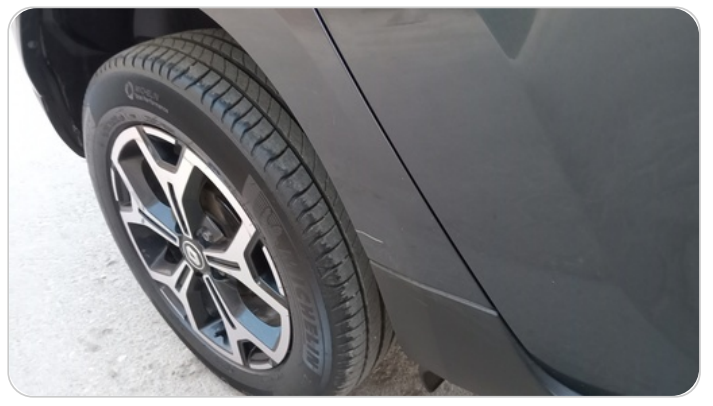
الرفرف الخلفي يمين : فبريكة (خرابيش)