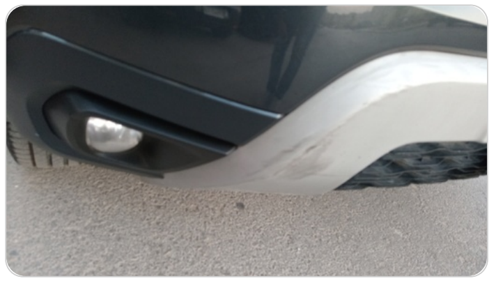
فيبر اكصدام امامي : خرابيش