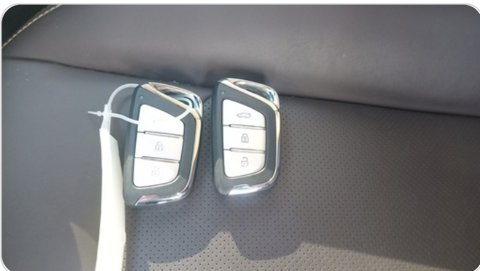
الريموت /المفتاح الاضافي : يعمل بكفاءة