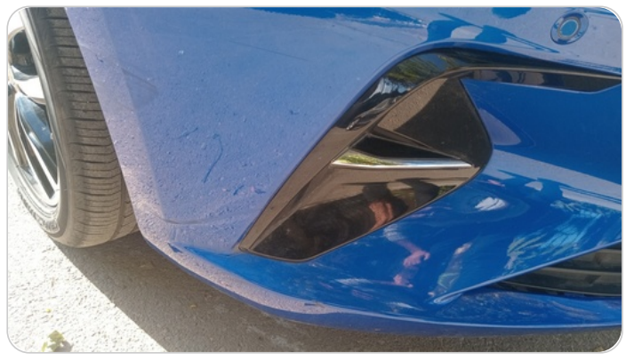
الاكصدام الأمامي : فبريكة (خرابيش)