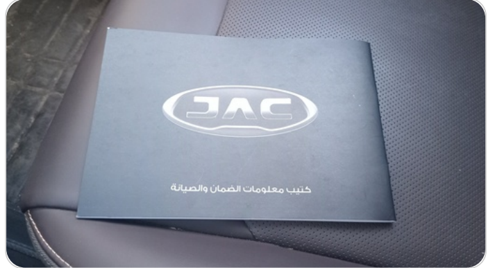
كتيب الضمان : موجود