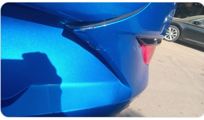
الاكصدام الخلفي : فبريكة (خرابيش - خبطات)