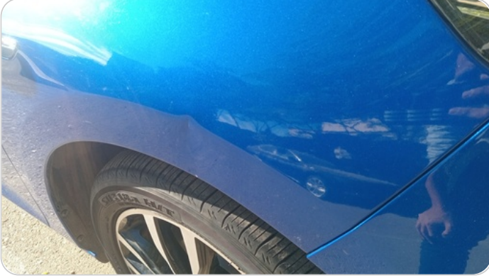
الرفرف الأمامي يمين : فبريكة (خبطات)