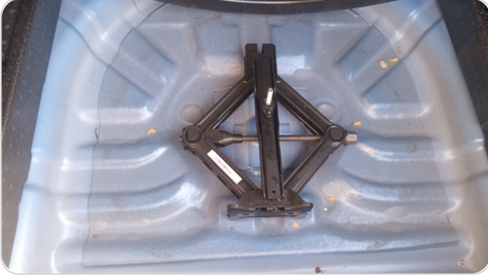
العدة وأدوات الأمان : متوفرة (بحالة جيدة)