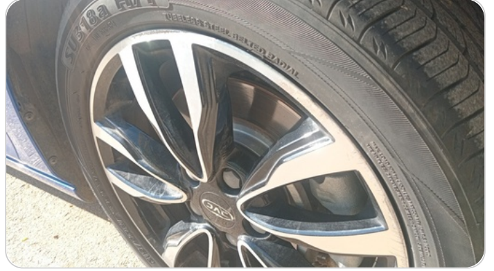
حالة الجنوط الأمامي : تجريحات بسيطة