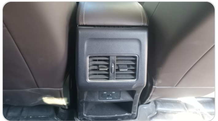
RR AC GRILL