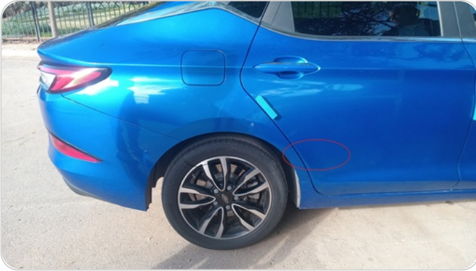
باب ورفرف خلفي يمين : رش جزئي بمعجون