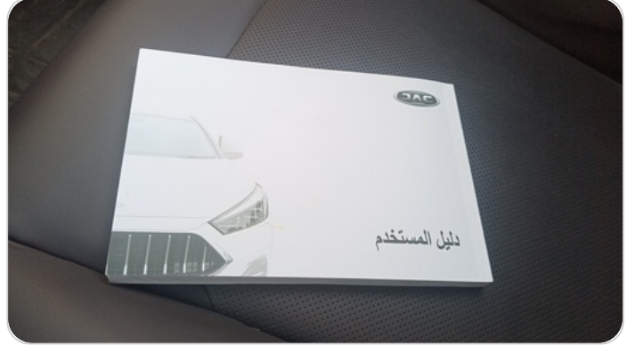
كتالوج السيارة : موجود