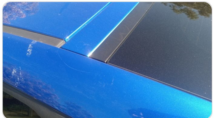
قائم خارجي خلفي شمال : فبريكة (خرايش)