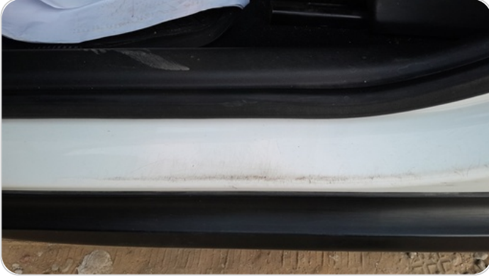
دواخل وقوائم باب الامامي شمال : فبريكة (خرايش)