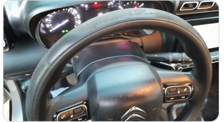
الطاره : متاكله