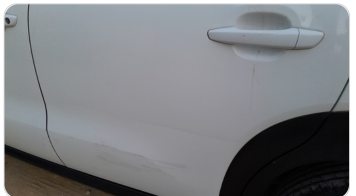
الباب الخلفي شمال : فبريكة (سمكره على البارد)