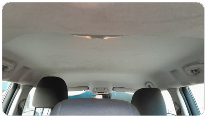
CAR ROOF MAT