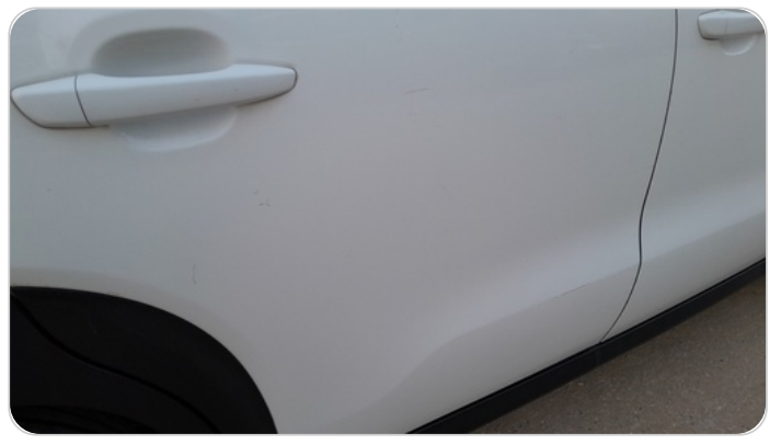
الباب الخلفي يمين : فبريكة (خرايش)