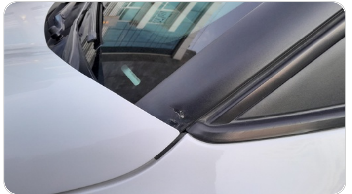
قائم خارجي أمامي شمال : فبريكة (خرابيش)