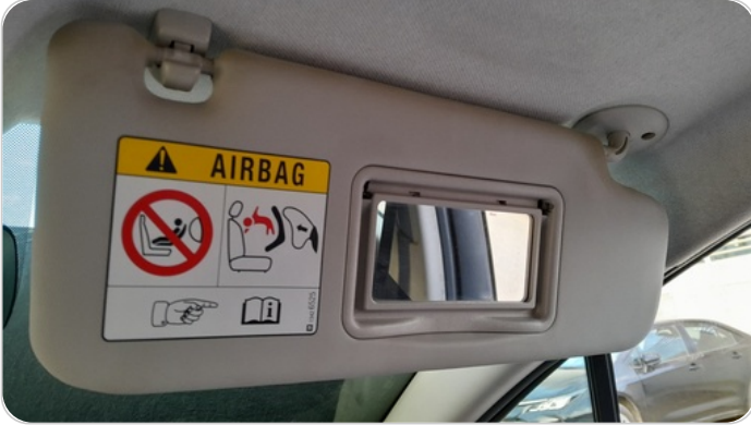
شماسات أمامية : تلف في اليمين