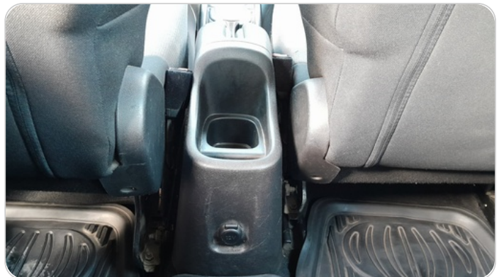
RR AC GRILL