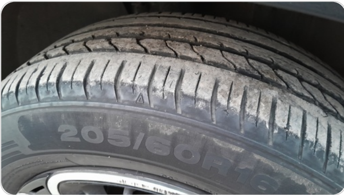
حالة الكاوتش الامامي : النقشة متآكلة