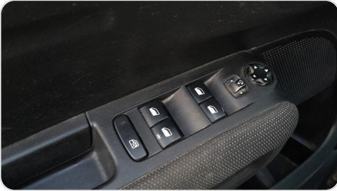
وحده تحكم الزجاج : تاكل