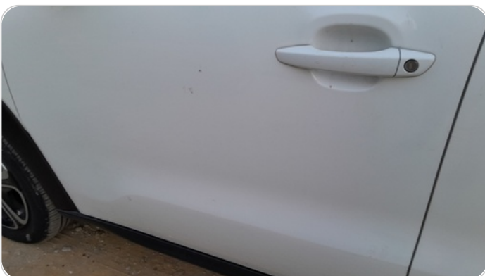
الباب الأمامي شمال : فبريكة (خرابيش)