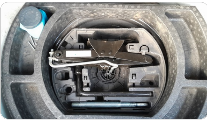
العدة وأدوات الأمان : متوفرة (بحالة جيدة)