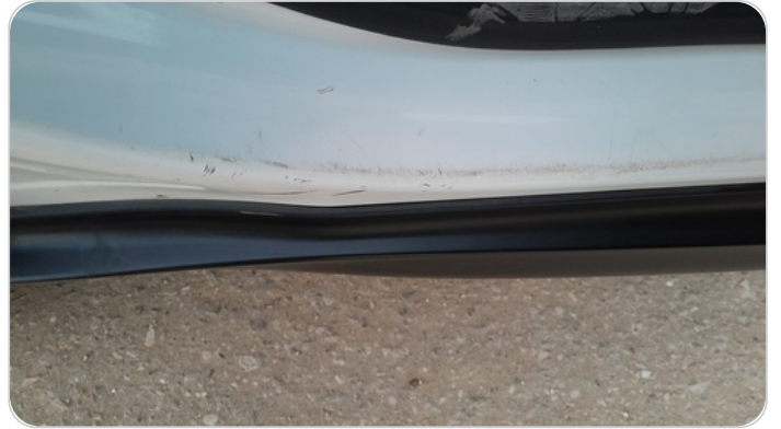
دواخل وقوائم باب خلفي يمين : فبريكة (خرايش)