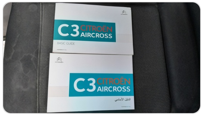
كتالوج السيارة : موجود