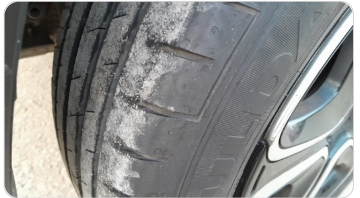
حالة الكاوتش الخلفي : النقشة متآكلة