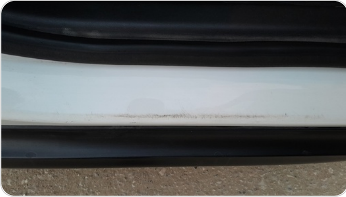
دواخل وقوائم باب أمامي يمين : فبريكة (خرايش)