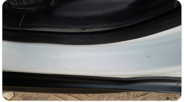
دواخل وقوائم باب الخلفي شمال : فبريكة (خرايش)