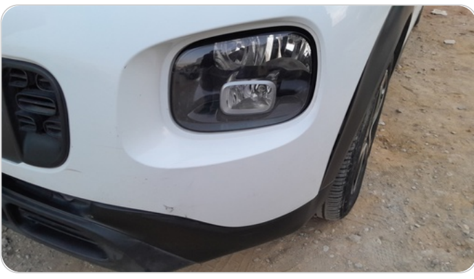
الاصدام الامامي : فبريكة (خرايش)