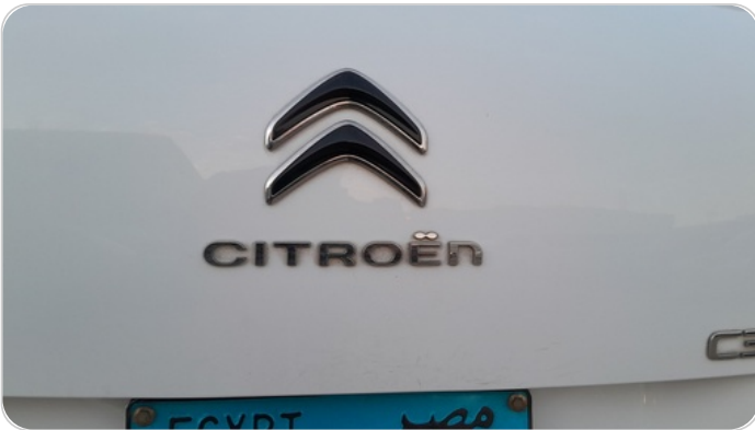
باب الشنطة : فبريكة (خرابيش)