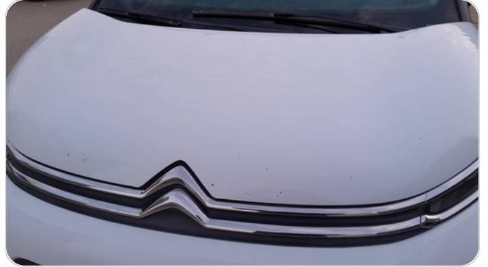
الكبوت : فبريكة (خرابيش)