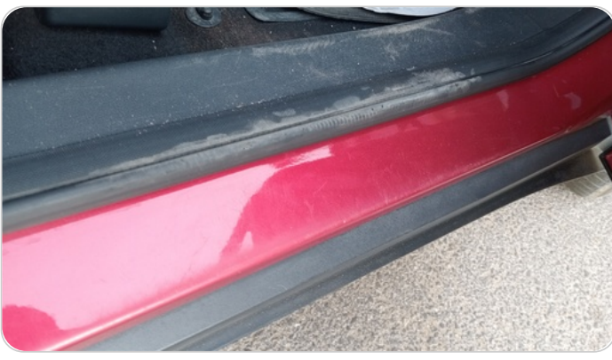
دواخل وقوائم باب أمامي يمين : فبريكة (خرابيش)