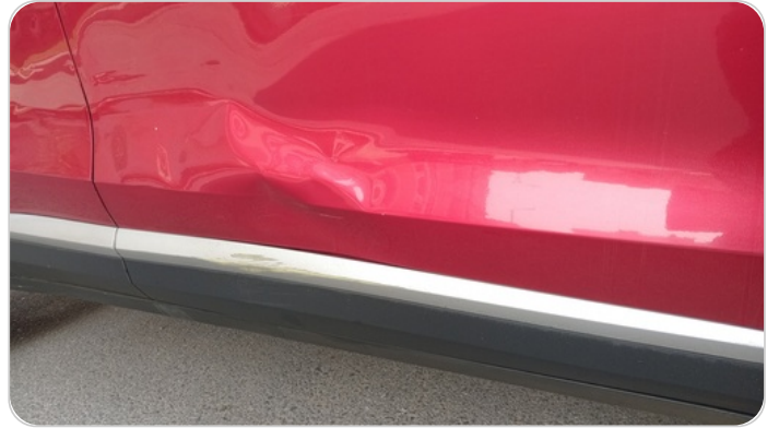
الباب الأمامي يمين : رش بدون معجون (خبطات)