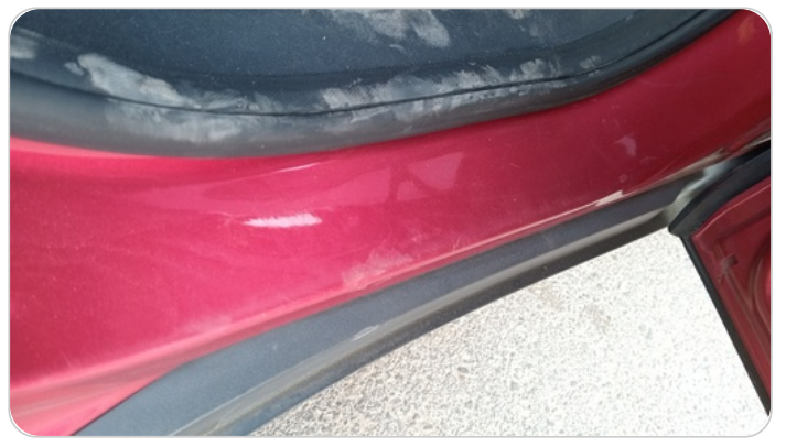
دواخل وقوائم باب خلفي يمين : فبريكة (خرابيش)