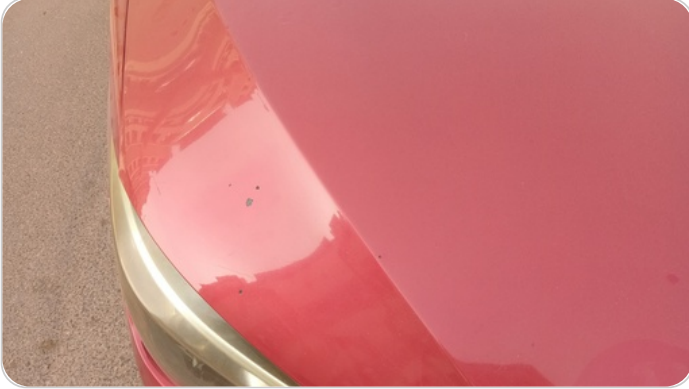
الكبوت : رش بدون معجون (خرابيش)