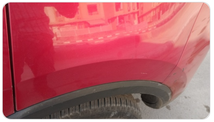
الرفرف الخلفي شمال : فبريكة (خرايش)