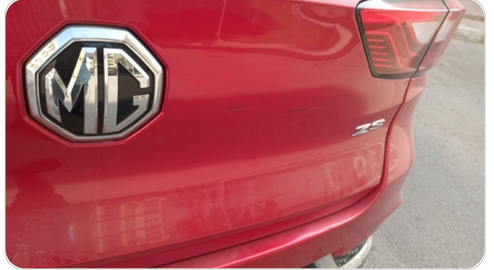
باب الشنطة : فبريكة (خرابيش)