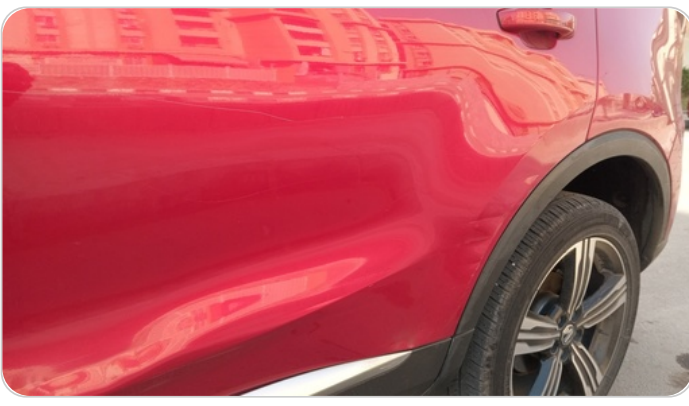
الباب الخلفي شمال : فبريكة (خرايش - خبطات)