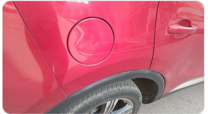
الرفرف الخلفي يمين : فبريكة (خرايش)