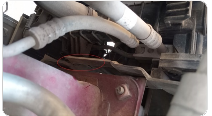
حامل طقم التبريد : اعوجاج خفيف / تريجة