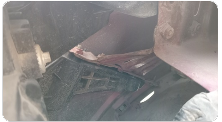
خلف كشاف امامي يمين : اعمال سمكرة