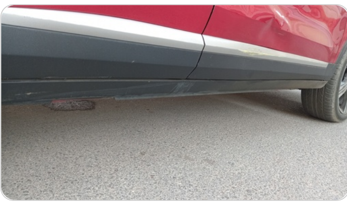
العتب السفلي يمين : فبريكة (خرابيش)