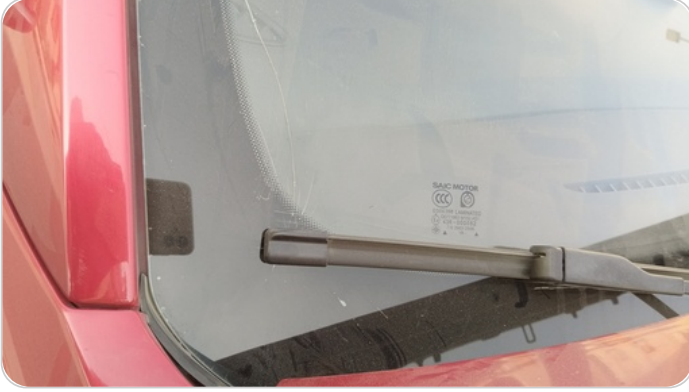
زجاج السيارة الأمامي : شروخ أو كسور