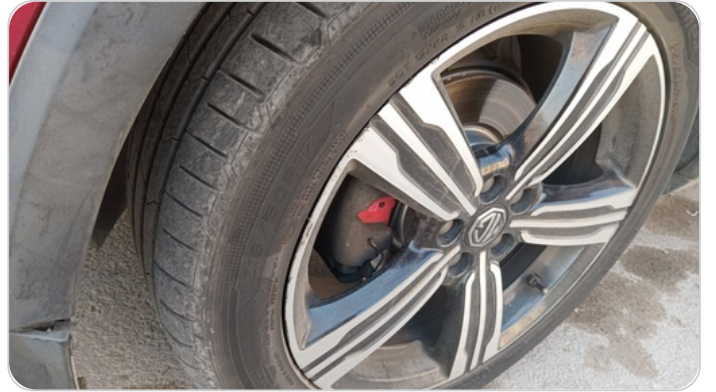
حالة الجنوط الأمامي : تجريحات بسيطة