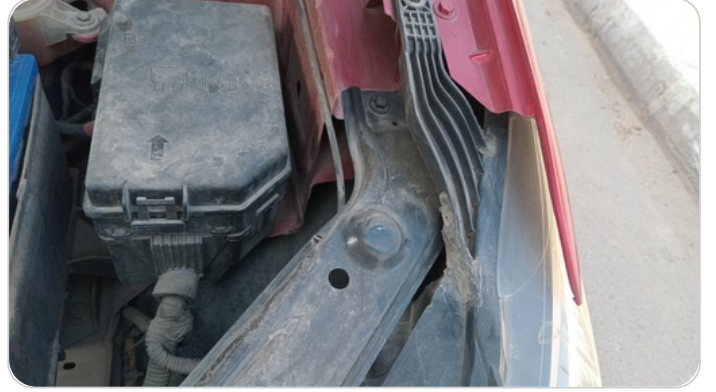
الكشاف الأمامي شمال : كسر في قواعد الكشاف