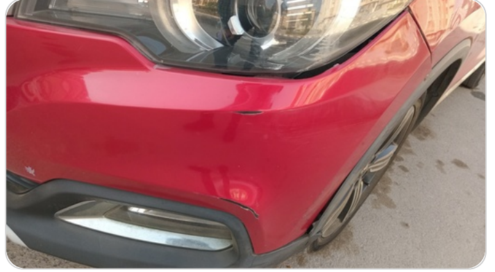
الاصدام الأمامي : رش مع معجون (خرايش)