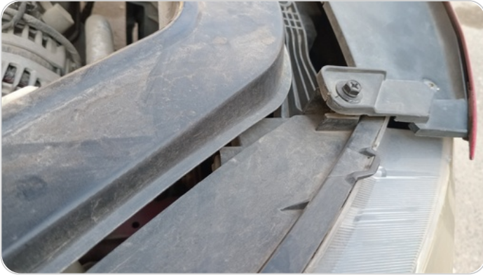
الكشاف الأمامي يمين : كسر في قواعد الكشاف