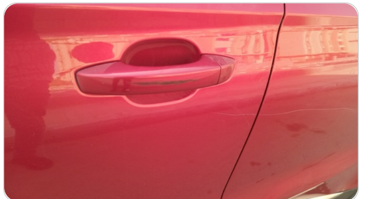
الباب الأمامي شمال : فبريكة (خرابيش)