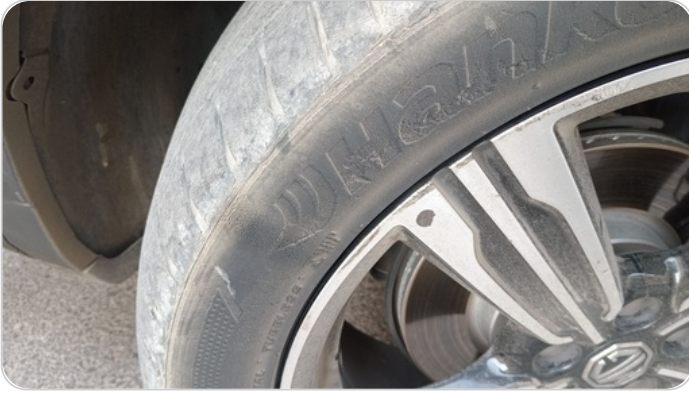
حالة الكاوتش الأمامي : بلونة في الكاوتش