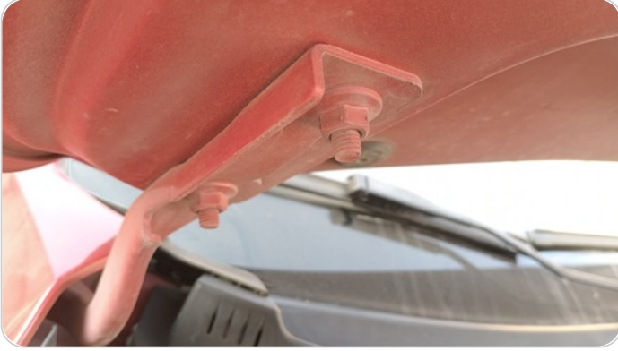
مفصلات ومسامير الكبوت : آثار فك وتركيب