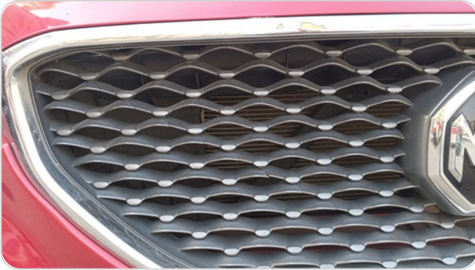
شبكة أمامية : شرخ / كسر