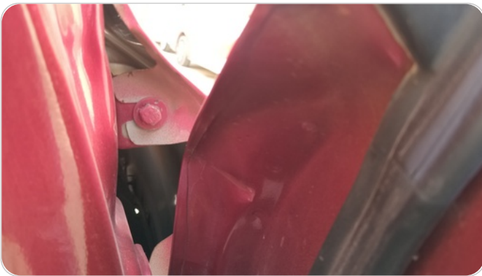
رفرف امامي شمال : اثار فك وتركيب