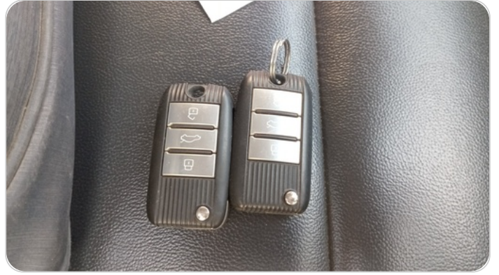
الريموت /المفتاح الاضافي : يعمل بكفاءة