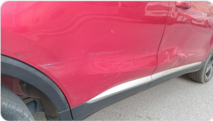
الباب الخلفي يمين : فبريكة (خرايش - خبطات)