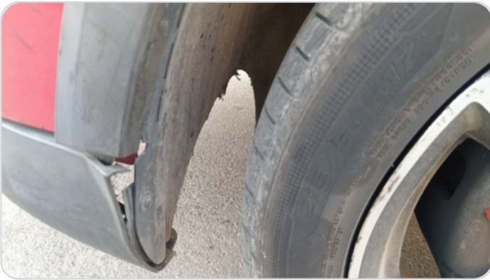
كرتيرة عجل امامي شمال : كسر