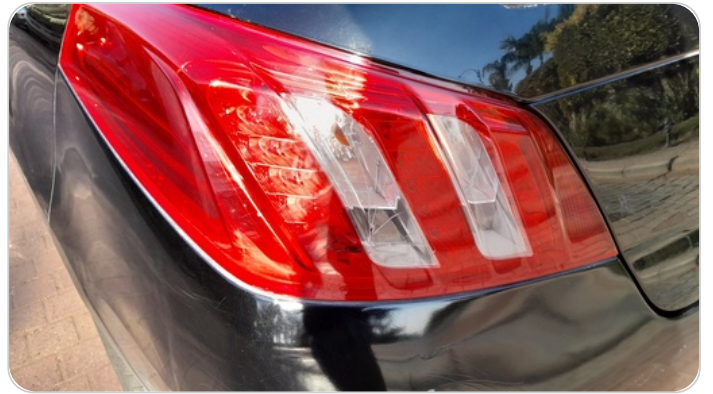
الكشاف الخلفي شمال : كسر بالباغة