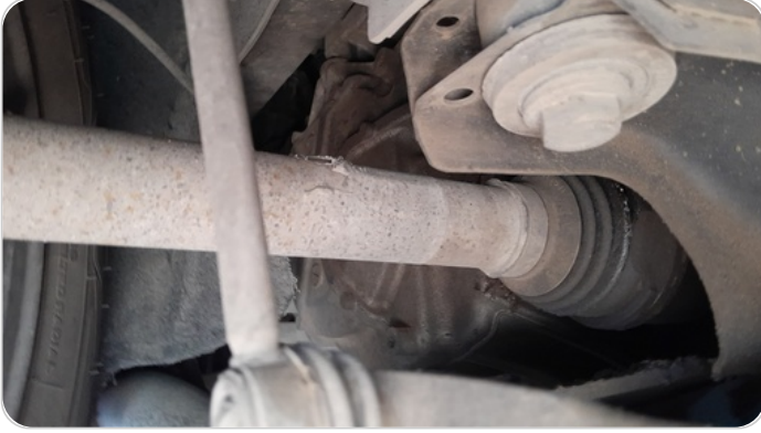
كبالن أمامية : كاوتش الكوبلن مقطوع