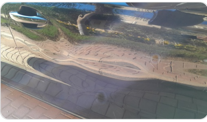
الباب الأمامي يمين : فبريكة (خبطات)