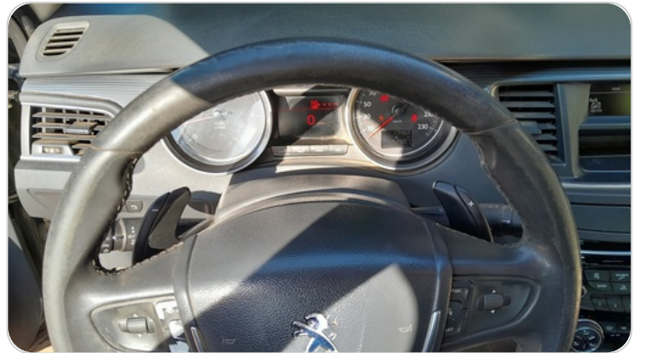
الطاره : متاكله