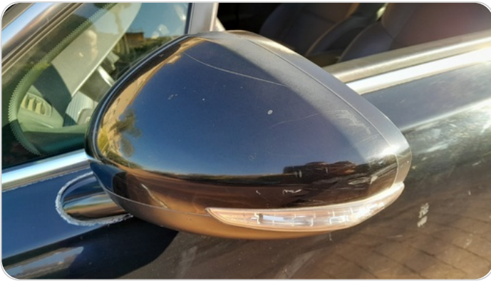
مرآة الباب الأمامي شمال : فبريكة (خرابيش)