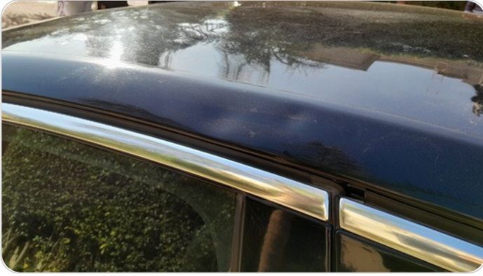
قائم خارجي خلفي يمين : فبريكة (خبطات)