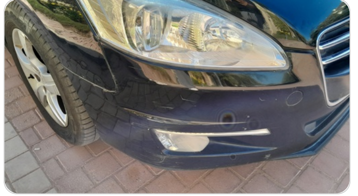
الاكصدام الامامي : فبريكة (خرايبش)