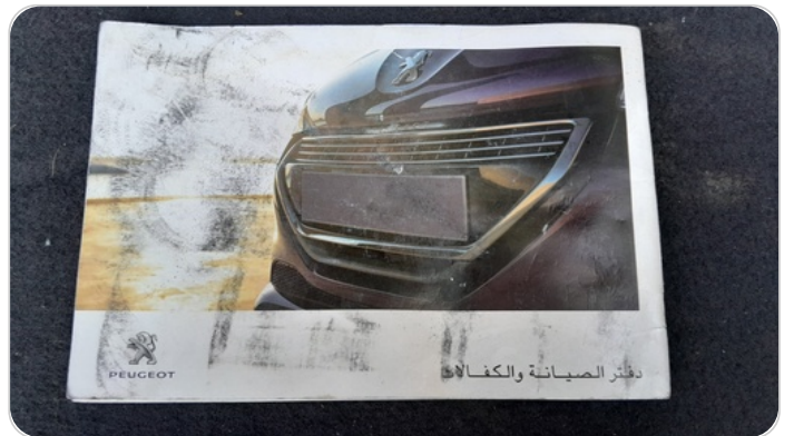
كتيب الضمان : موجود