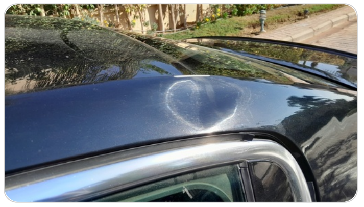
قائم خارجي خلفي شمال : فبريكة (خبطات)