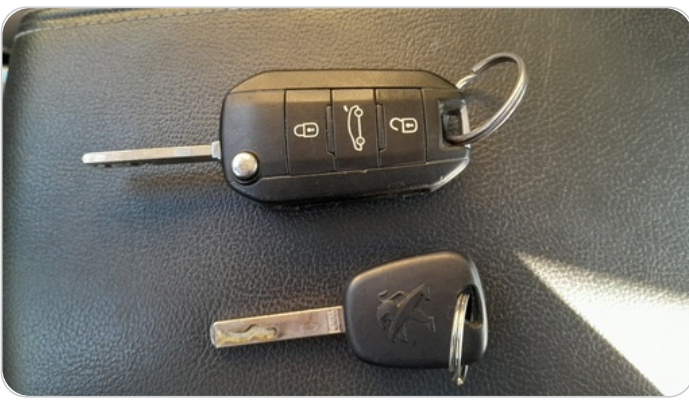
الريموت /المفتاح الاضافي : يعمل بكفاءة