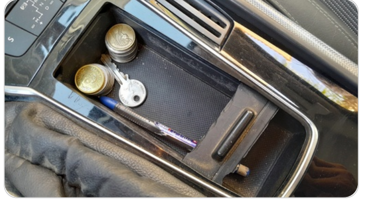
الكونسول الوسط : قطع / كسر / شرخ / تلف