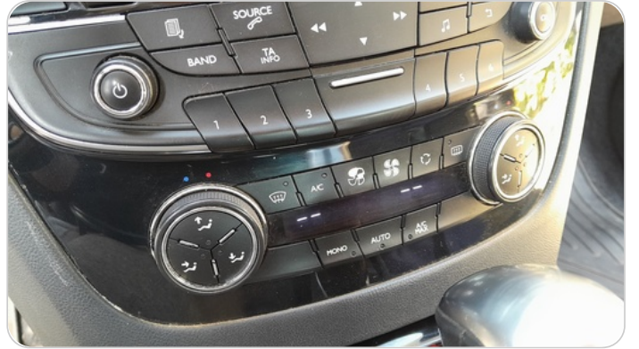
زر تحكم في التكييف : تاكل