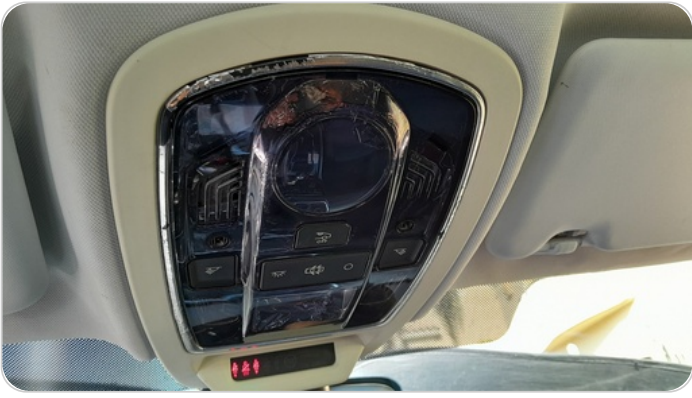
الكونسول الوسطي : تاكل