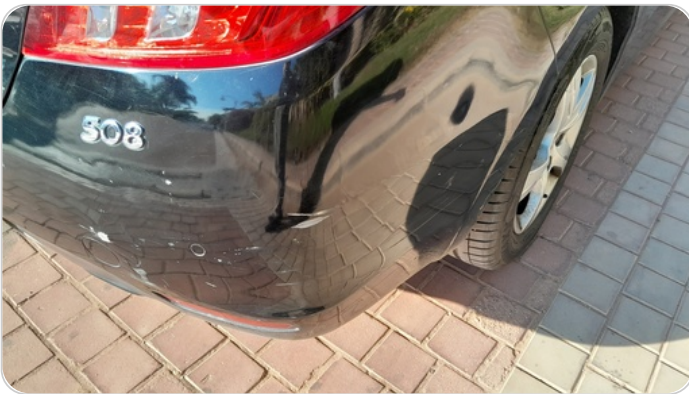
الاكصدام الخلفي : رش مع معجون (خرابيش)