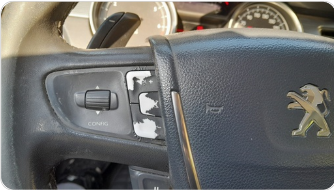
وحده تحكم في الصوت من الطاره : تاكل