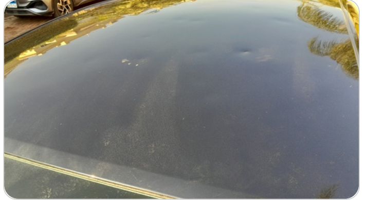
السقف : فبريكة (خرابيش)