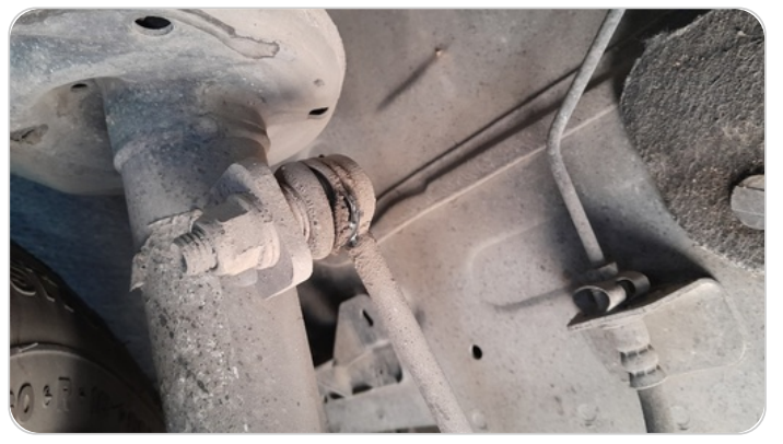
ذراع الميزان : تشققات (كاوتش الميزان)