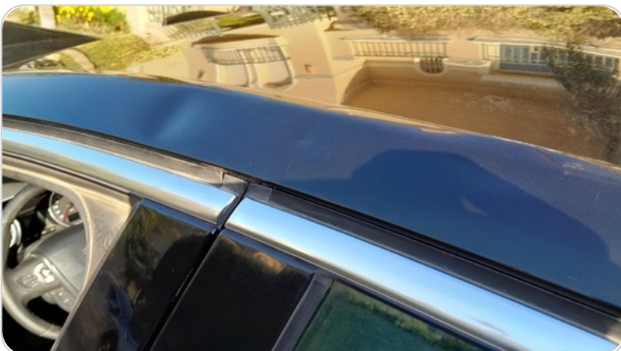
قائم خارجي أمامي شمال : فبريكة (خبطات)