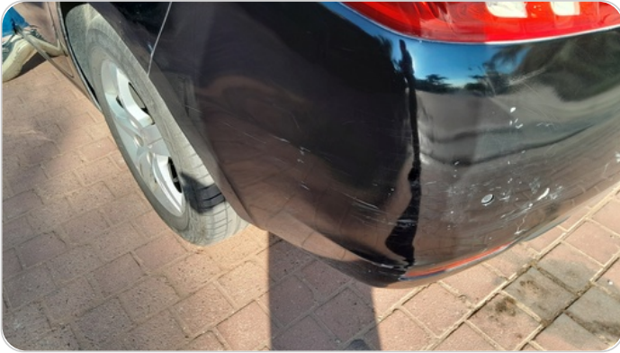
الاكصدام الخلفي : رش مع معجون (خرايبش)