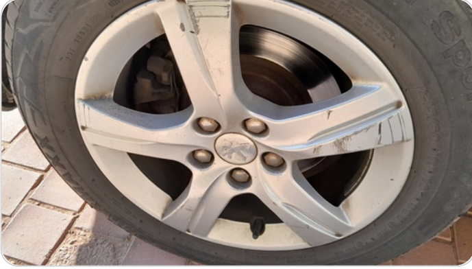
حالة الجنوط الخلفي : تجريحات بسيطة