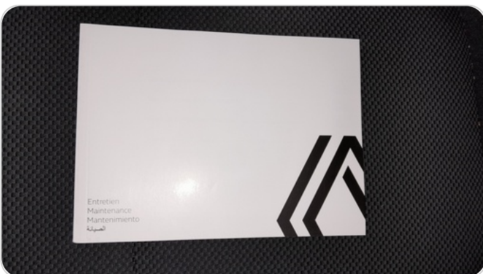
كتيب الضمان : موجود