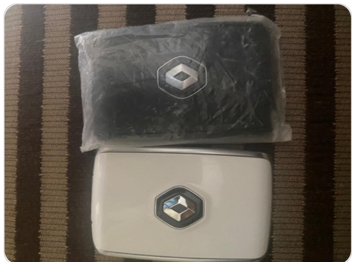
الريموت /المفتاح الاضافي : موجود (لم يتم التجربة)