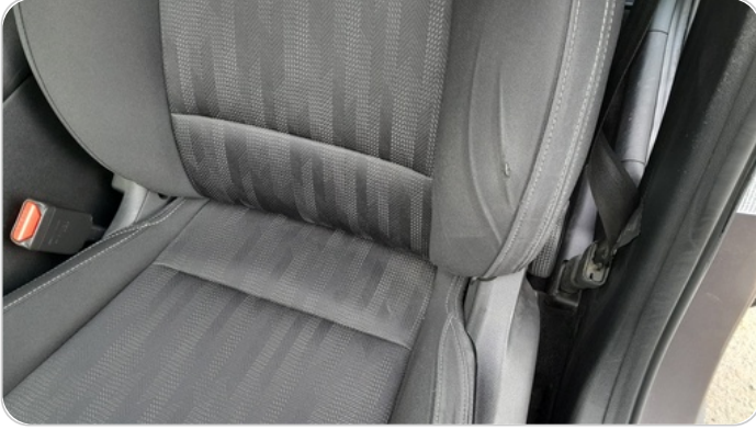
فرش كرسي أمامي شمال : قطع / كسر / شرخ / تلف