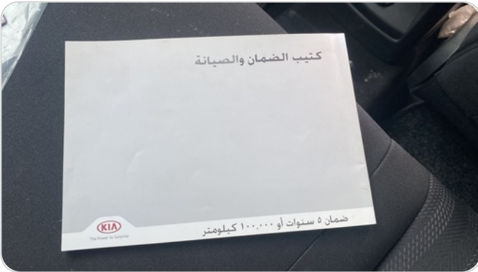
كتاب الضمان : موجود