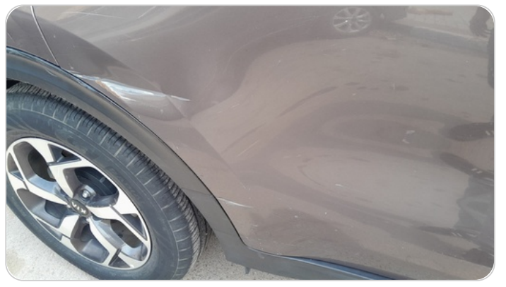
الباب الخلفي يمين : فبريكة (خبطات)