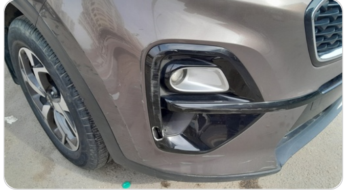
الاكصدام الأمامي : فبريكة (خبطات)