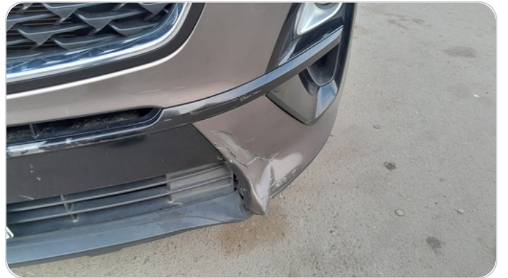
الاكصدام الامامي : فبريكة (خبطات)