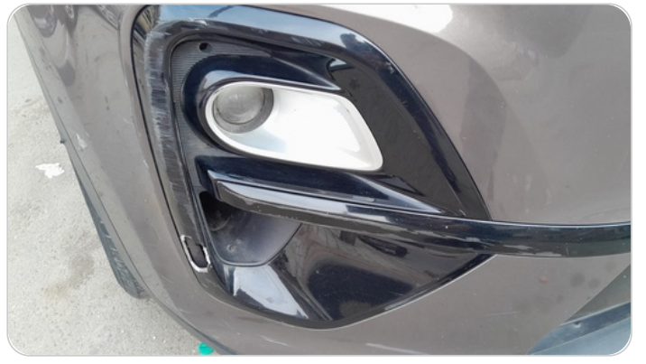
فريم شبوره امامي يمين : كسر