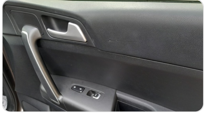
فرش الباب الأمامي يمين : قطع / كسر / شرخ / تلف