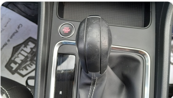
الكونسول الوسط : قطع / كسر / شرخ / تلف