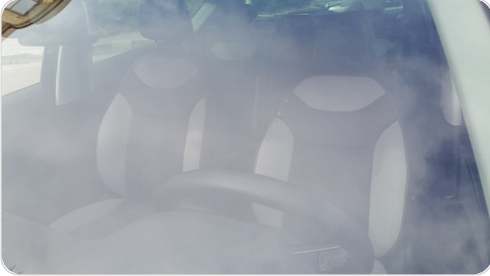
زجاج السيارة الأمامي : نقرة