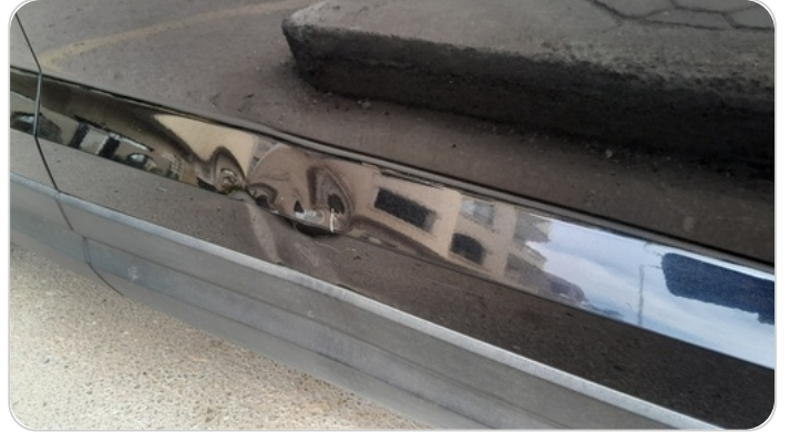
الباب الأمامي يمين : فبريكة (خبطات)