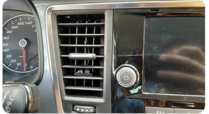
هوايات التكييف : كسر (أكثر من هواية)