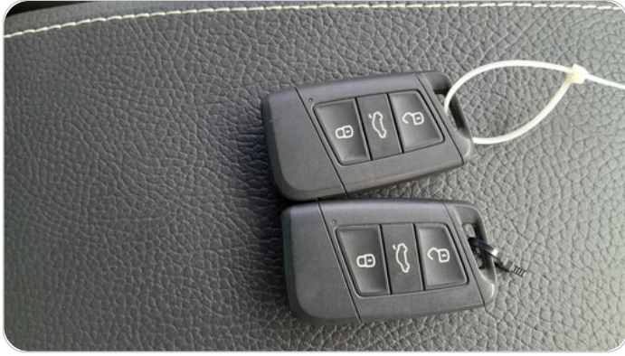
الريموت /المفتاح الاضافي : يعمل بكفاءة