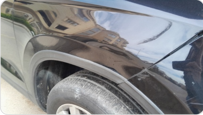
الرفرف الأمامي يمين : فبريكة (خبطات)