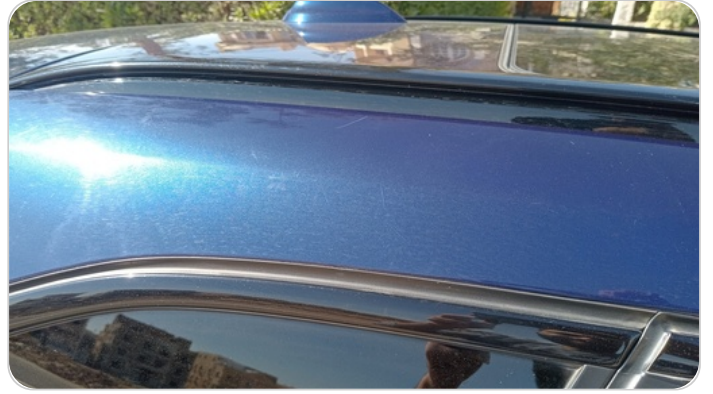
قائم خارجي خلفي يمين : فبريكة ( خرابيش )