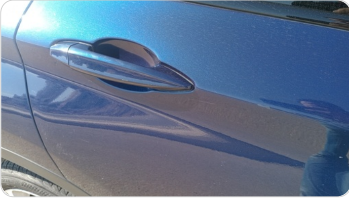
الباب الخلفي يمين : فبريكة (خرابيش - خبطات)