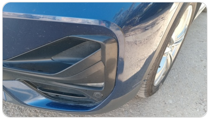
الاكصدام الأمامي : فبريكة (خرابيش)