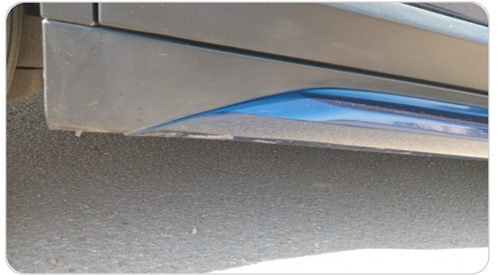
العتب السفلي يمين : فبريكة (خرابيش)