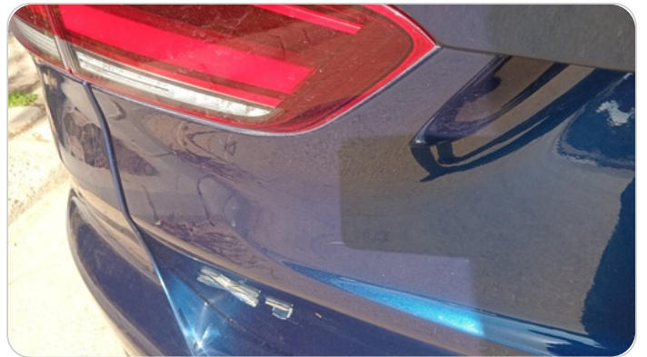
باب الشنطة : فبريكة (خرابيش)