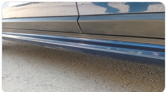
العتب السفلي شمال : فبريكة (خرابيش)