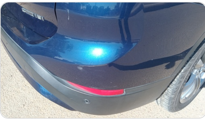
الاكصدام الخلفي : فبريكة (خرابيش)