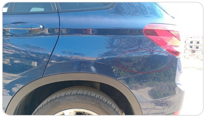
رفرف خلفس شمال : رش جزئي بمعجون