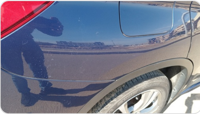
الرفرف الخلفي يمين : فبريكة (خرابيش)