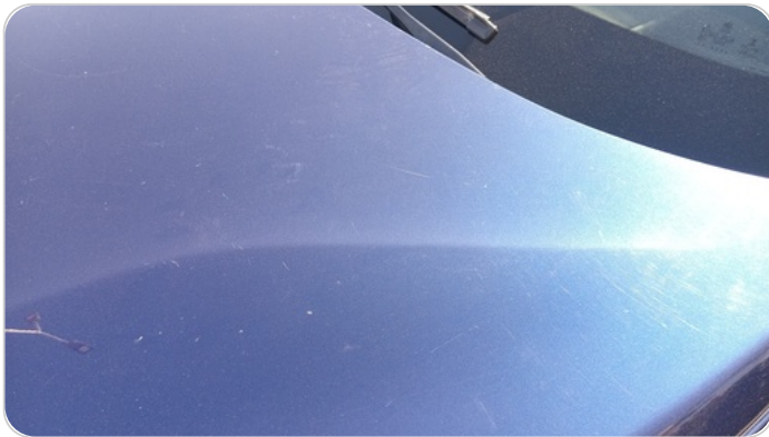
الكبوت : فبريكة (خرابيش)