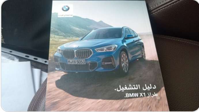
كتالوج السيارة : موجود