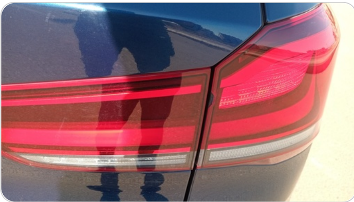
الكشاف الخلفي يمين : كسر بالباغة