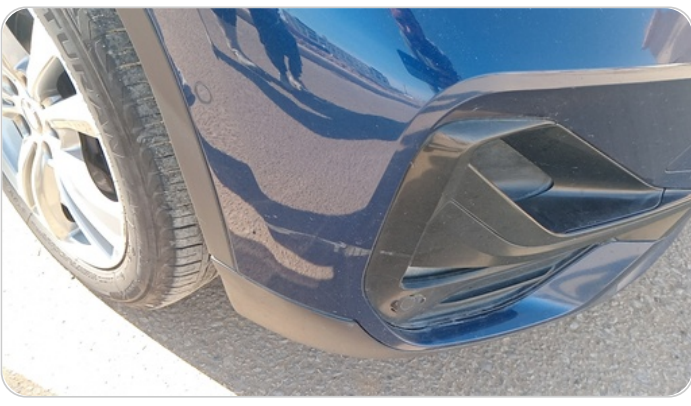
الاكصدام الامامي : فبريكة (خرابيش)