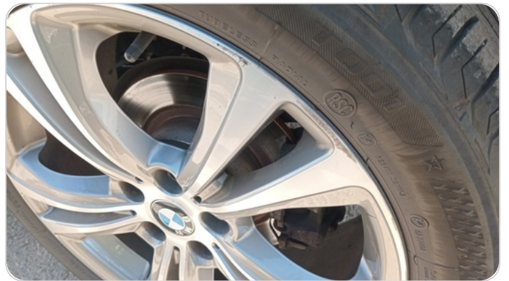
حالة الجنوط الخلفي : تجريحات بسيطة