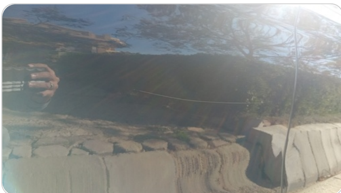
الباب الأمامي شمال : فبريكة (خرابيش)