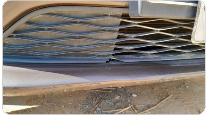
شبكة أمامية : شرخ / كسر