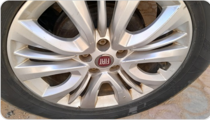
حالة الجنوط الخلفي : تجريحات بسيطة