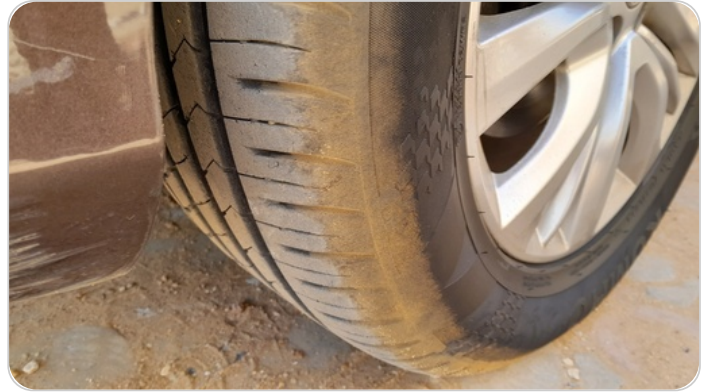
حالة الكاوتش الأمامي : النقشة متآكلة