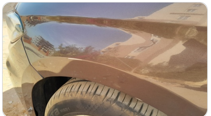
الرفرف الأمامي شمال : فبريكة (خرايش)