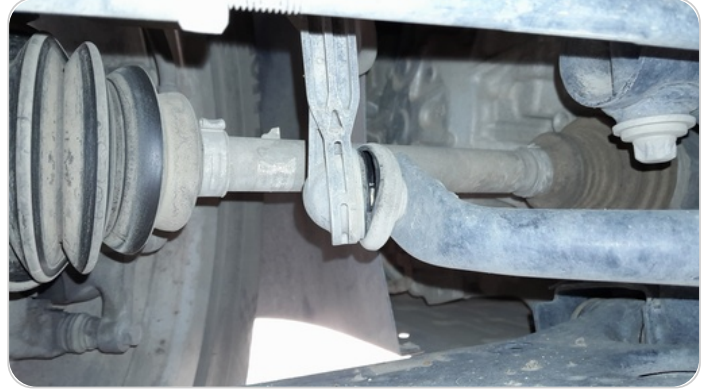
ذراع الميزان : تشققات (كاوتش الميزان)