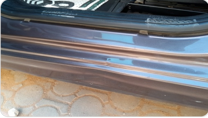
العتب السفلي شمال : فبريكة (خبطات)