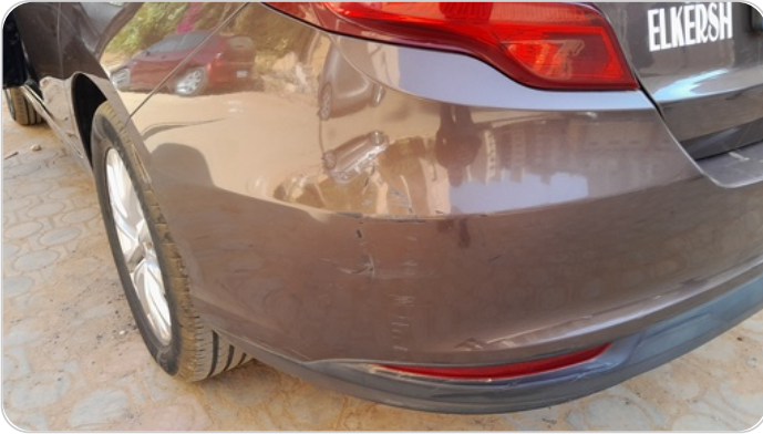
الكصدام الخلفي : فبريكة (خرابيش)