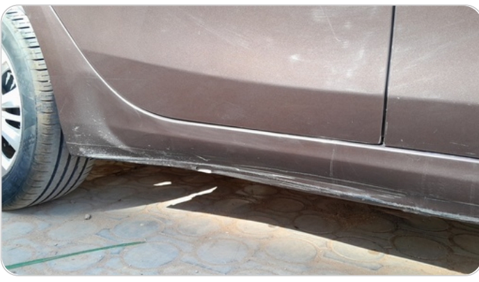
العتب السفلي يمين : فبريكة (خبطات)