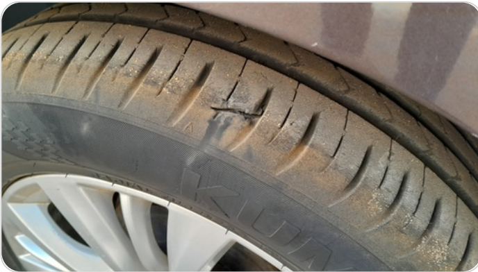
حالة الكاوتش الخلفي : تشققات/قطع بسيط