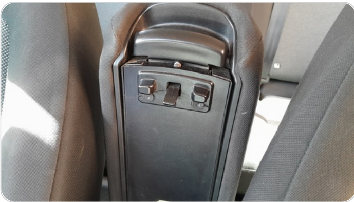
الكونسول الوسط : قطع / كسر / شرخ / تلف