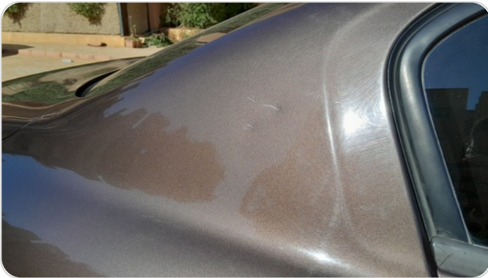
قائم خارجي خلفي يمين : فبريكة ( خرابيش )