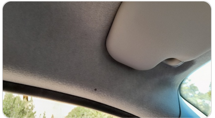
فرش السقف : قطع / كسر / شرخ / تلف