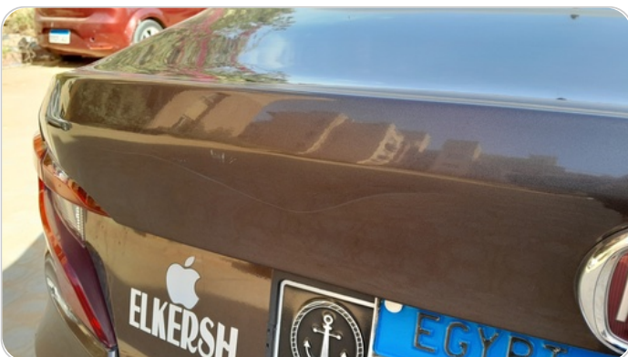
باب الشنطة : فبريكة (خرايش)