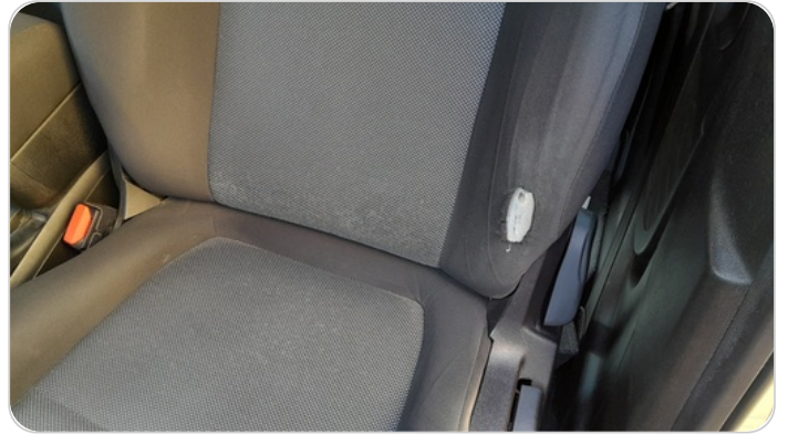
فرش كرسي أمامي شمال : قطع / كسر / شرخ / تلف