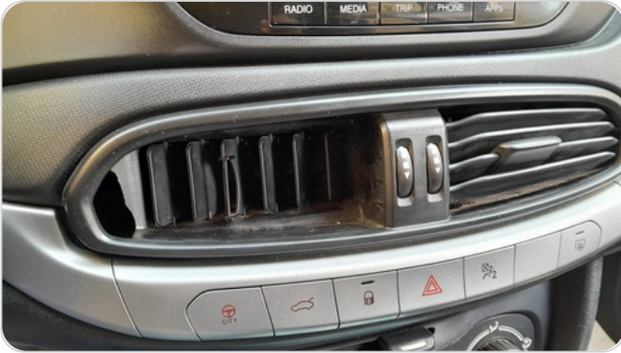
هوايات التكييف : كسر (هواية واحدة)