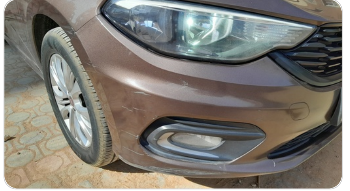
الكصدام الأمامي : رش بدون معجون (خرابيش)