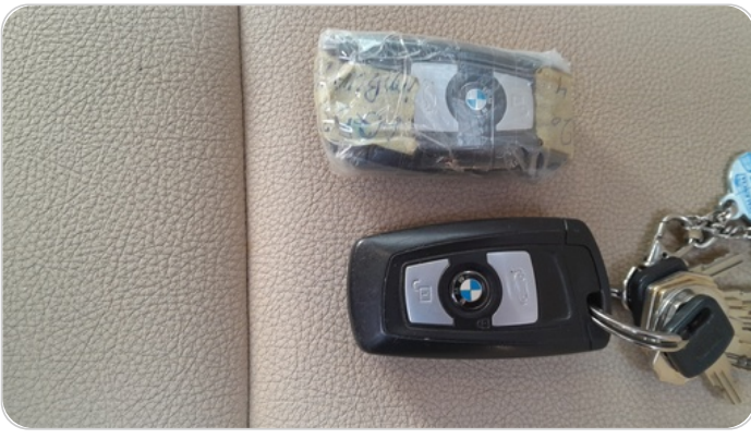
الريموت /المفتاح الاضافي : موجود (لم يتم التجربة)