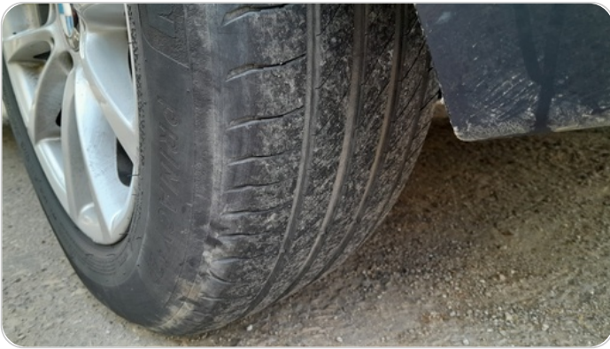
حالة الكاوتش الخلفي : تشققات/قطع بسيط