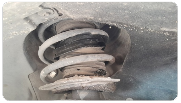
مساعدين أمامي : تسريب زيت