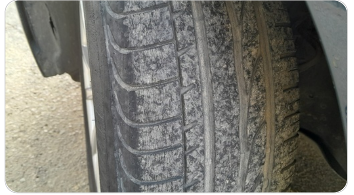
حالة الكاوتش الأمامي : تشققات/قطع بسيط