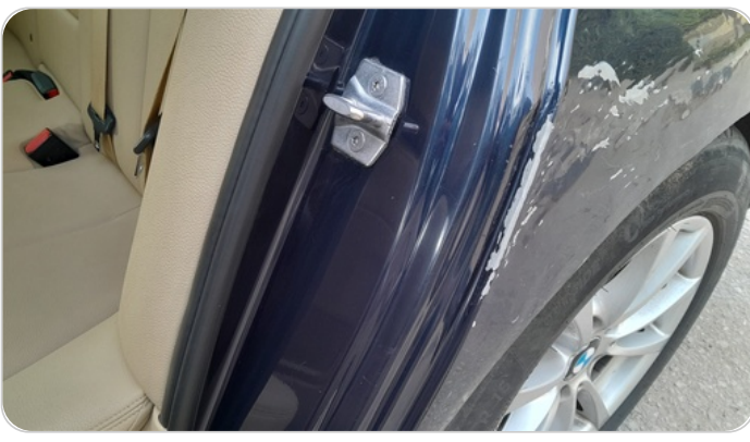
دواخل وقوائم باب الخلفي شمال : فبريكة (خرايش)