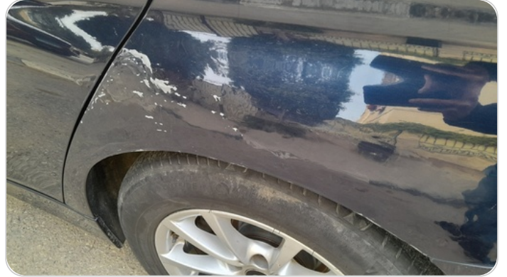
الرفرف الخلفي شمال : فبريكة (سمكره على البارد)