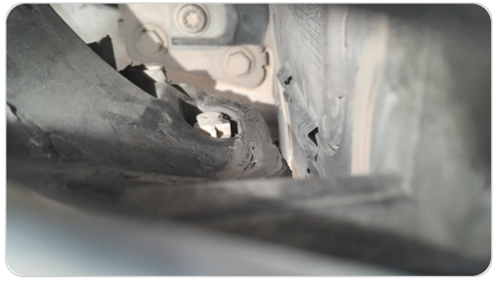
فانوس امامي يمين : لحام