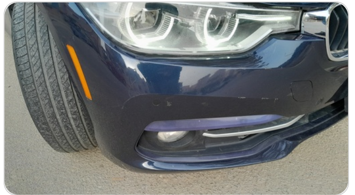
الاكصدام الأمامي : رش بدون معجون (خرابيش)