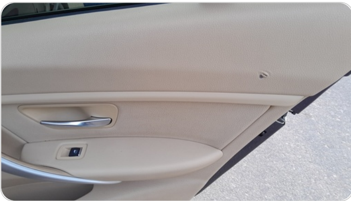
فرش الباب الخلفي يمين : قطع /كسر/شرخ /تلف