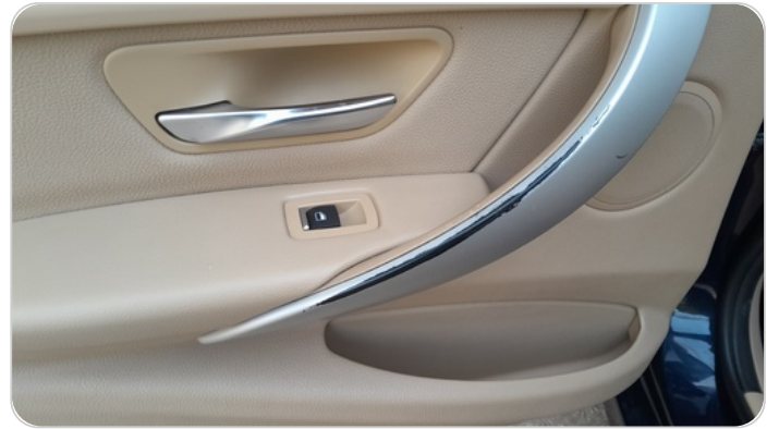
فرش الباب الخلفي شمال : قطع /كسر/شرخ /تلف