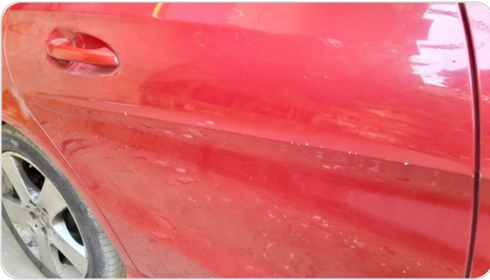
الباب الخلفي يمين : رش مع معجون (خرابيش)