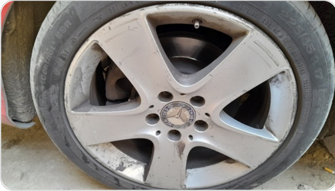
حالة الجنوط الخلفي : تجريحات بسيطه