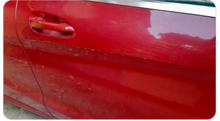
الباب الأمامي يمين : رش مع معجون (خرابيش)