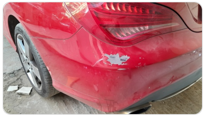
الاكصدام الخلفي : رش مع معجون (خرابيش)