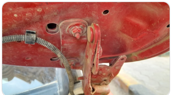
مفصلات ومسامير الكبوت : آثار فك وتركيب