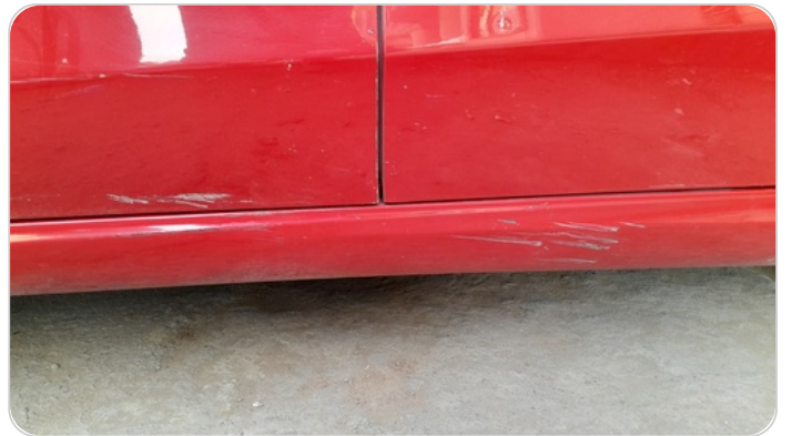
العتب السفلي شمال : فبريكة (خرابيش)