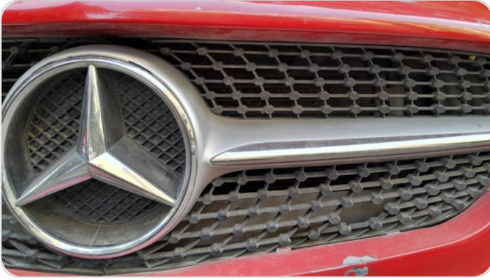
شبكة أمامية : شرخ / كسر