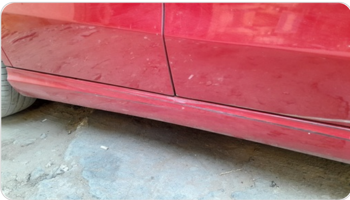
العتب السفلي يمين : رش مع معجون (خبطات)