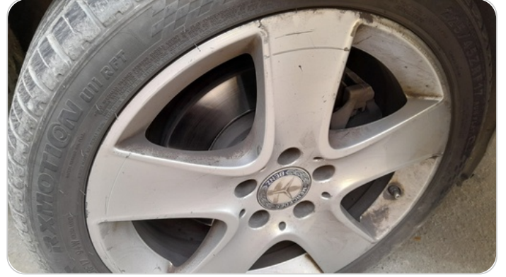
حالة الجنوط الأمامي : تجريحات بسيطة