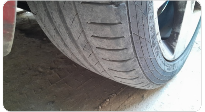
حالة الكاوتش الخلفي : النقشة متآكلة