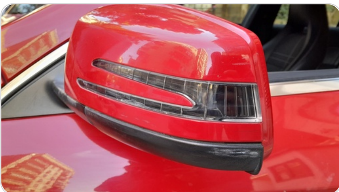
مراية الباب الأمامي شمال : فبريكة (خرابيش)