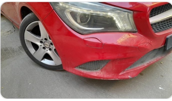
الاكصدام الأمامي : رش بدون معجون (خبطات)