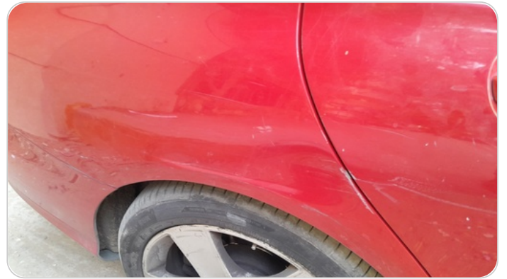
الرفرف الخلفي يمين : رش مع معجون (خرابيش)