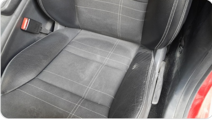
فرش كرسي أمامي شمال : قطع / كسر / شرخ / تلف