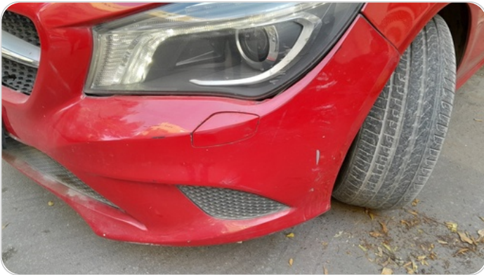
الاكصدام الامامي : رش بدون معجون (خبطات)