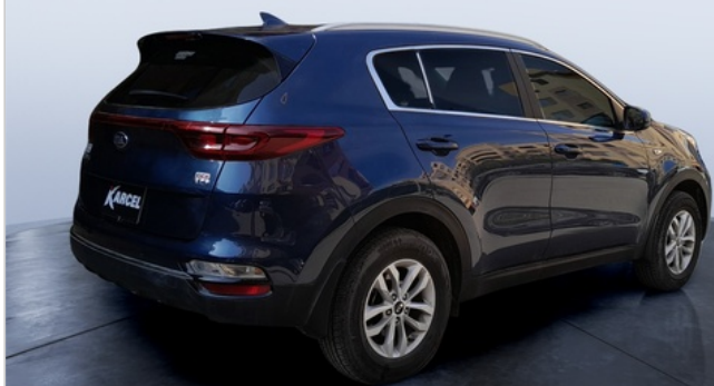
RR R 45