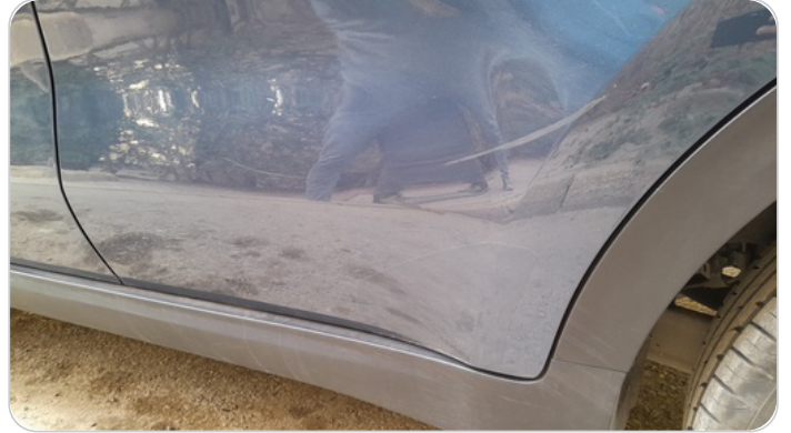
الباب الخلفي شمال : فبريكة (خرابيش)