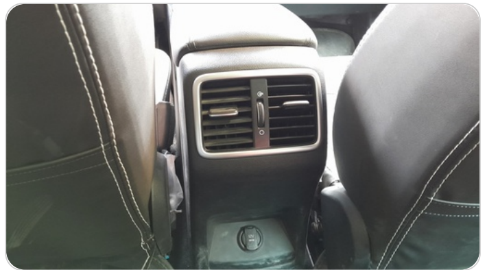
RR AC GRILL