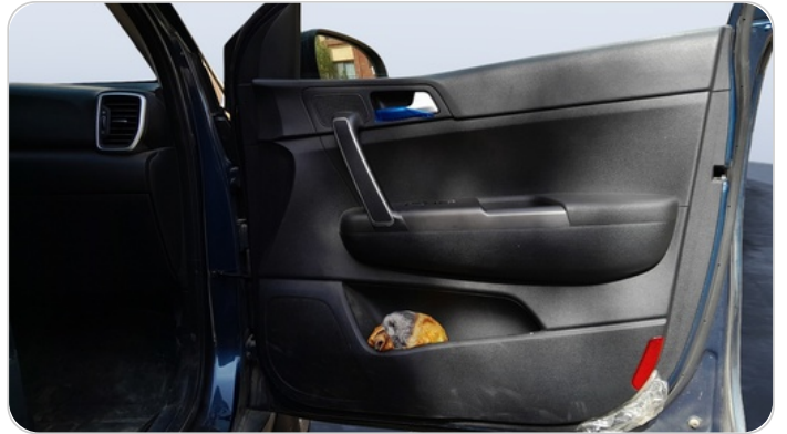
FR R DOOR