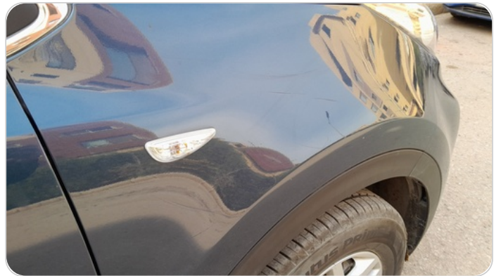
الرفرف الأمامي يمين : فبريكة (خرابيش)