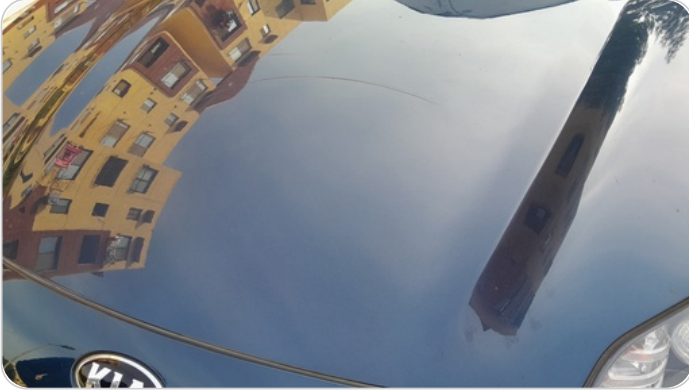
الكبوت : فبريكة (خرابيش)