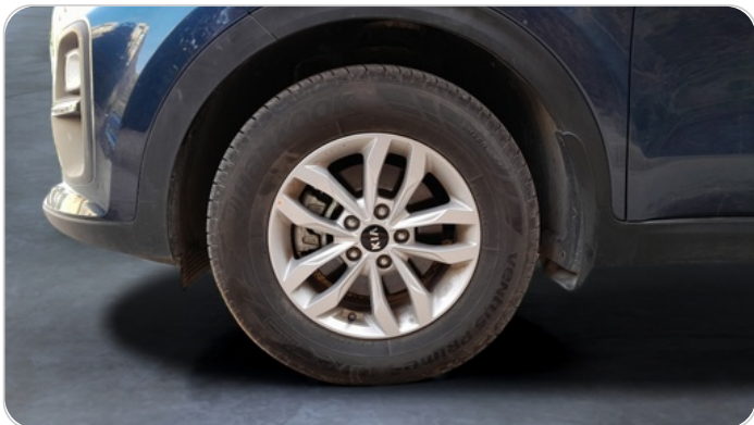
FR L TIRE