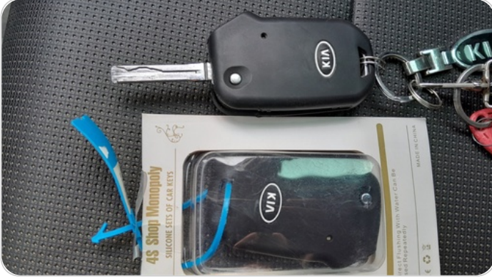
حالة الريموت / المفتاح : يعمل بكفاءة