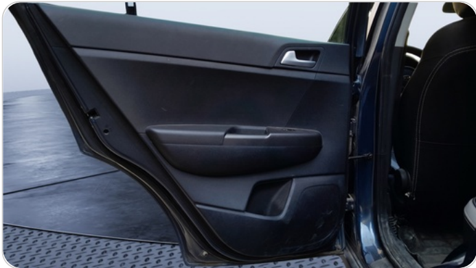
RR L DOOR