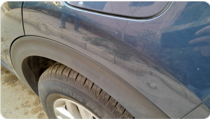
الرفرف الخلفي شمال : فبريكة (خرابيش)