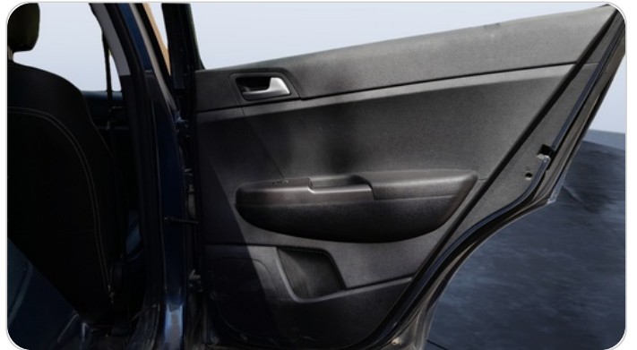
RR R DOOR