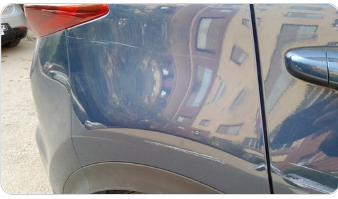
الرفرف الخلفي يمين : فبريكة (خرابيش)