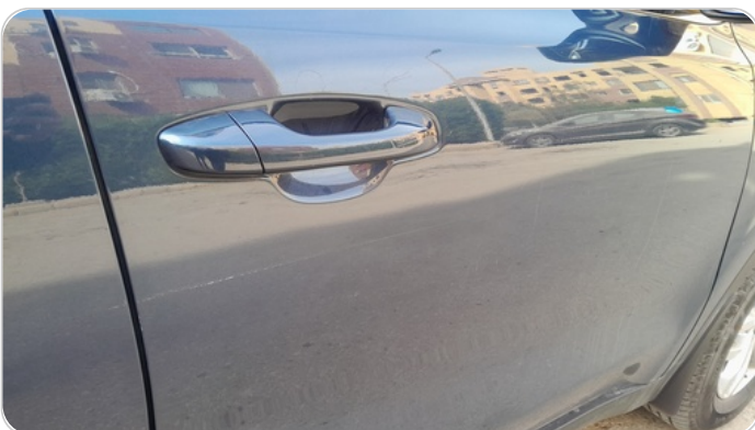
الباب الأمامي يمين : فبريكة (خرابيش)