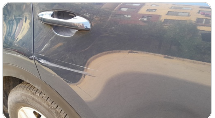
الباب الخلفي يمين : فبريكة (خرابيش)