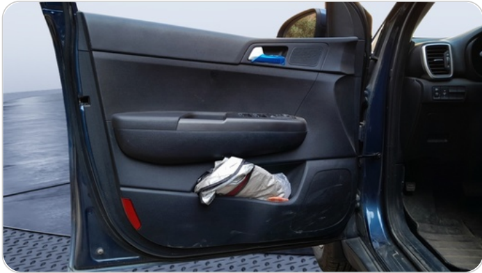
FR L DOOR