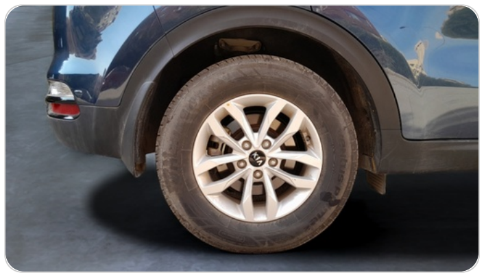
RR R TIRE