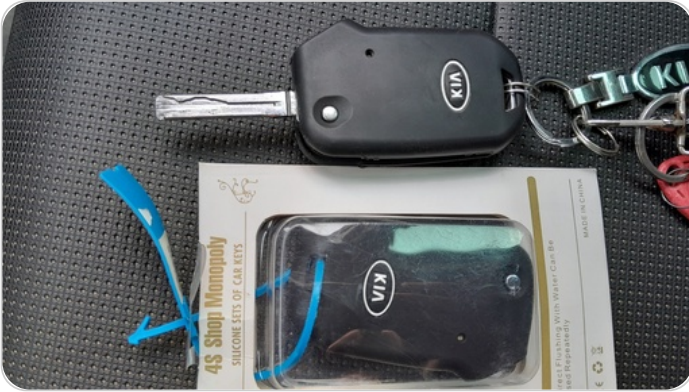
الريموت /المفتاح الاضافي : موجود (لم يتم التجربة)