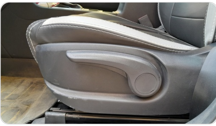
DRIVER SEAT SWITCHES