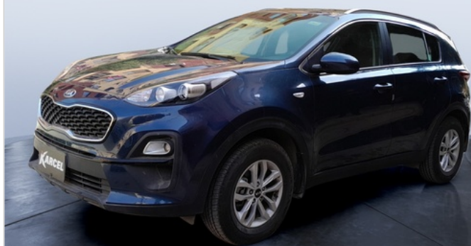
FR L 45