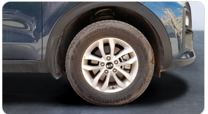
FR R TIRE