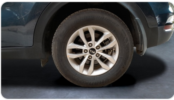
RR L TIRE