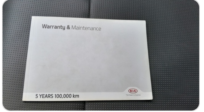
كتيب الضمان : موجود