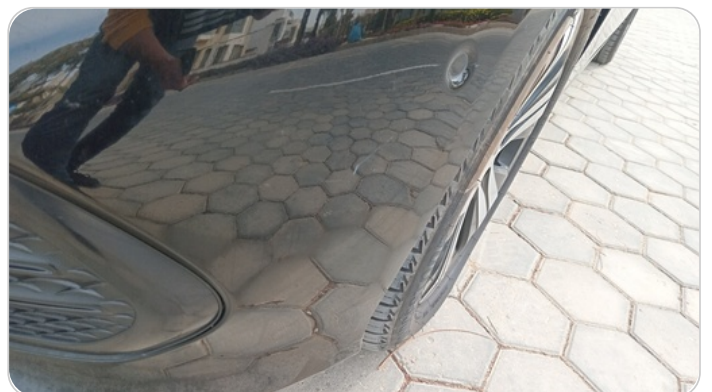
الاكصدام الأمامي : فبريكة (خرايش)