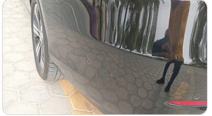
الاكصدام الخلفي : فبريكة (خبطات)