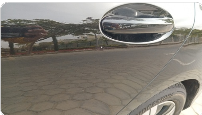
الباب الخلفي شمال : فبريكة (خرايش)