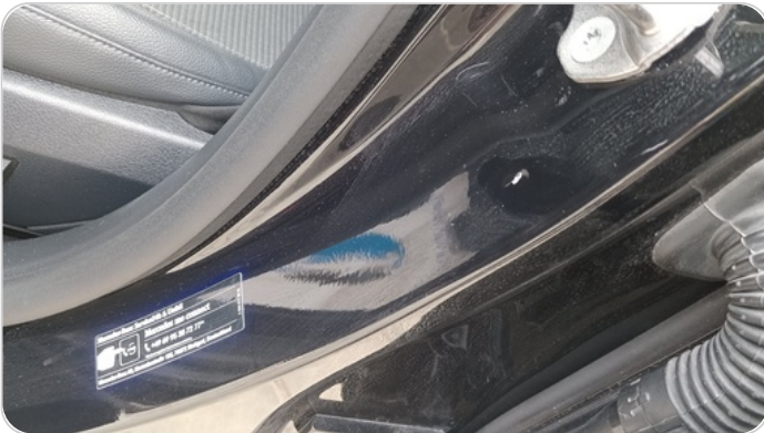
دواخل وقوائم باب الأمامي شمال : فبريكة (خرابيش)