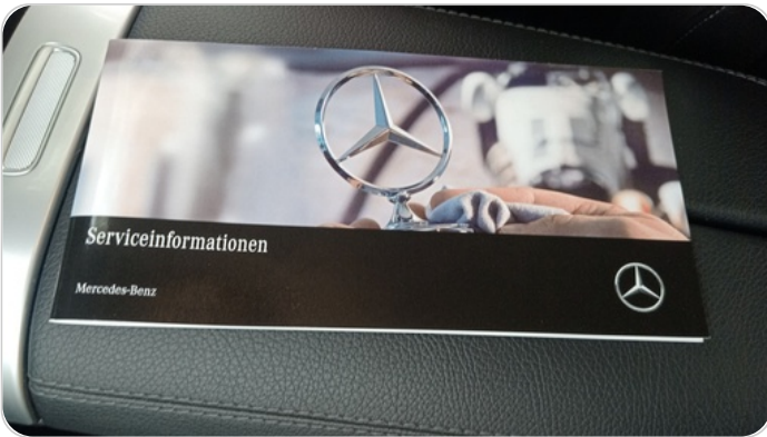
كتيب الضمان : موجود