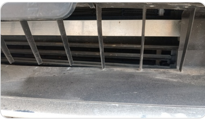
شبكة أمامية : الدهان / النيكل (متآكل)