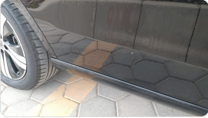
الباب الخلفي يمين : فبريكة (خرابيش)