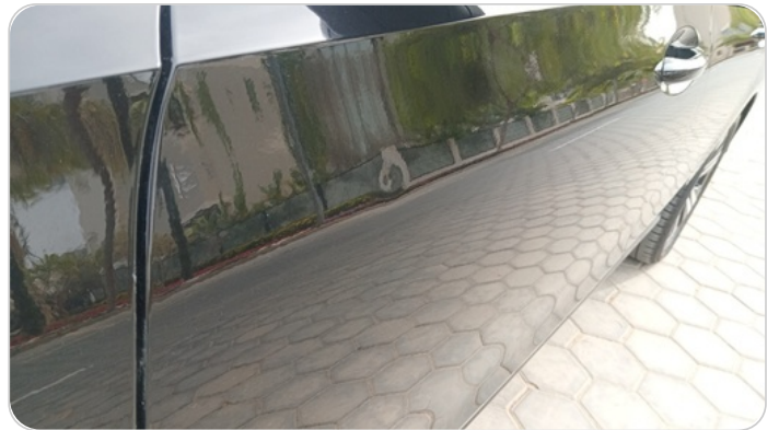
الباب الأمامي شمال : فبريكة (خرايش)