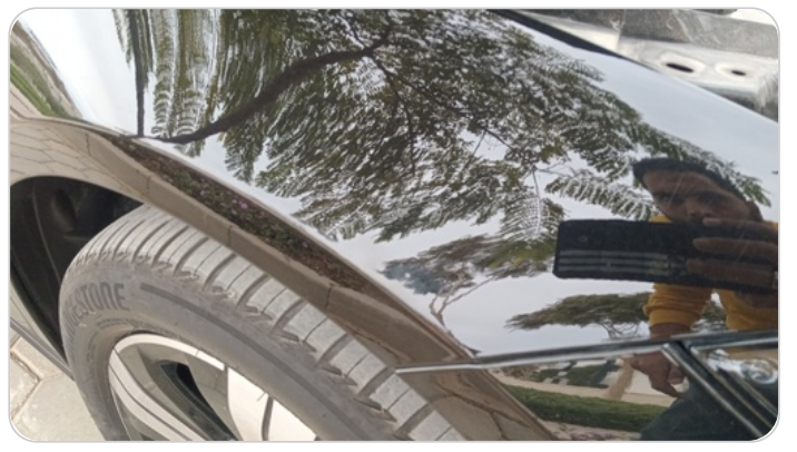
الرفرف الأمامي يمين : فبريكة (خرابيش)