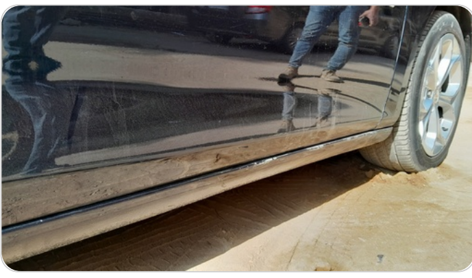
العتب السفلي يمين : فبريكة (خرابيش)