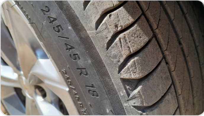
حالة الكاوتش الأمامي : النقشة متآكلة