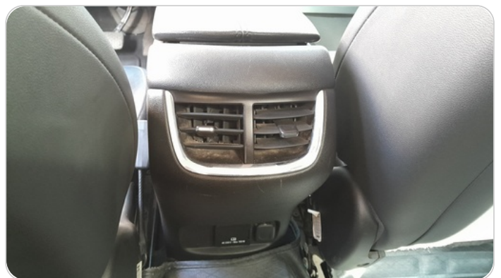
RR AC GRILL