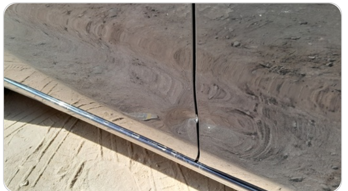
الباب الخلفي يمين : فبريكة (خبطات)