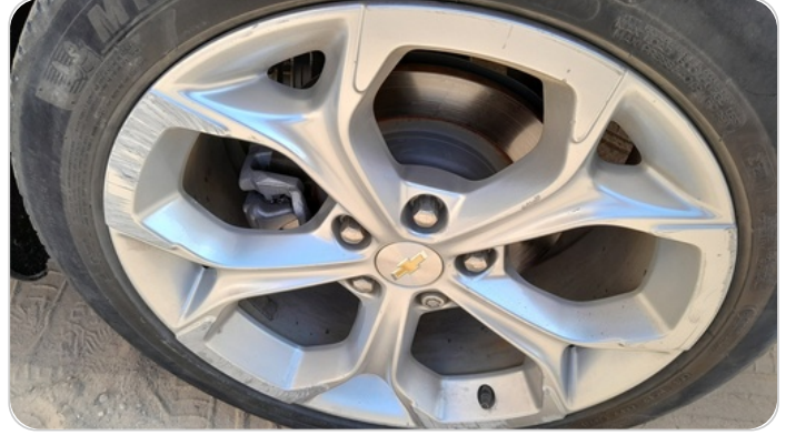
حالة الجنوط الخلفي : تجريحات بسيطة