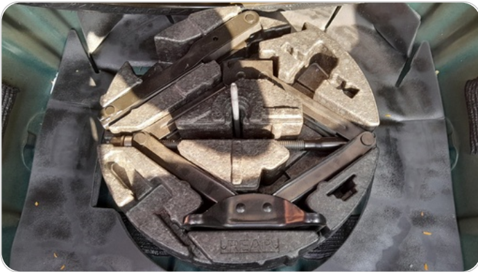
العدة وأدوات الأمان : متوفرة (بحالة جيدة)