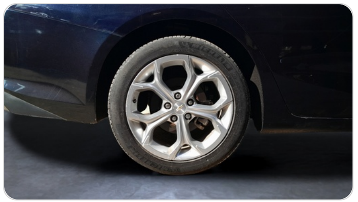
RR R TIRE