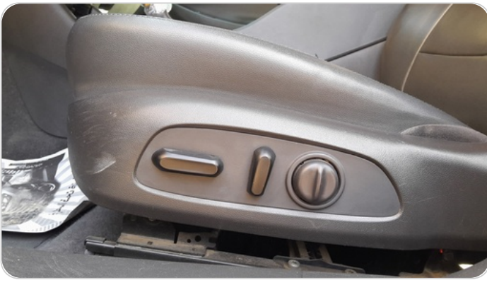
DRIVER SEAT SWITCHES