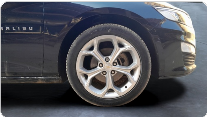
FR L TIRE