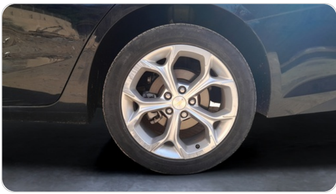
RR L TIRE