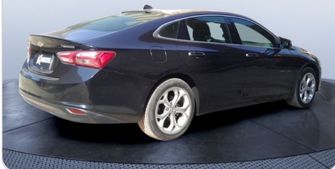
RR R 45