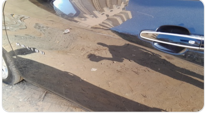
الباب الأمامي شمال : فبريكة (خرابيش)