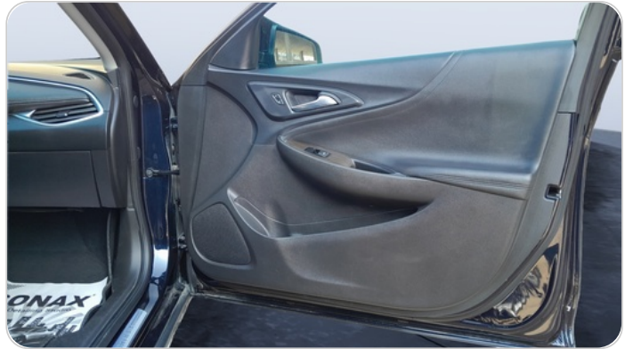
FR R DOOR