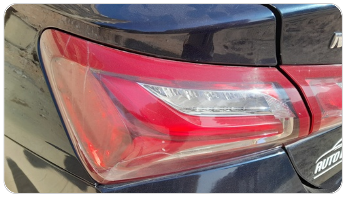
الكشاف الخلفي شمال : كسر بالباغة