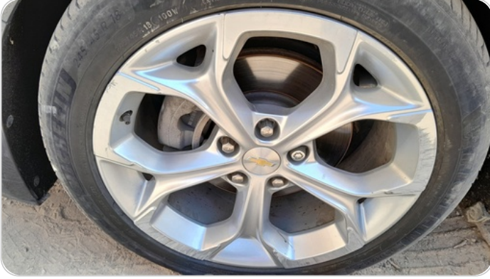
حالة الجنوط الأمامي : تجريحات بسيطة