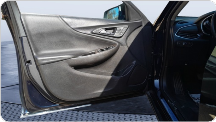
FR L DOOR