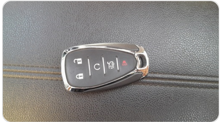
حالة الريموت / المفتاح : يعمل بكفاءة