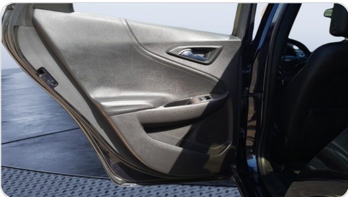
RR L DOOR