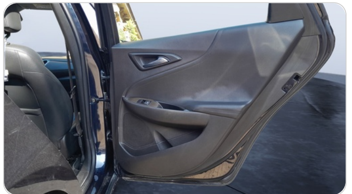
RR R DOOR