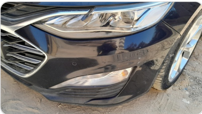
الاكصدام الأمامي : فبريكة (خرابيش)