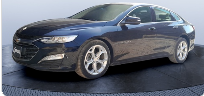
FR L 45