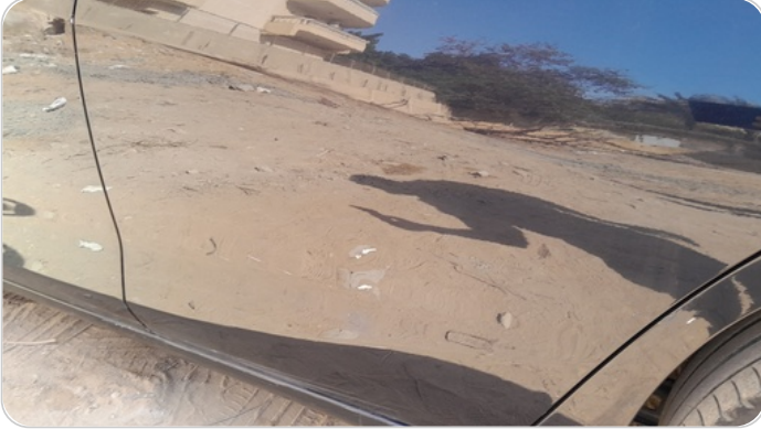
الباب الخلفي شمال : فبريكة (خرابيش)