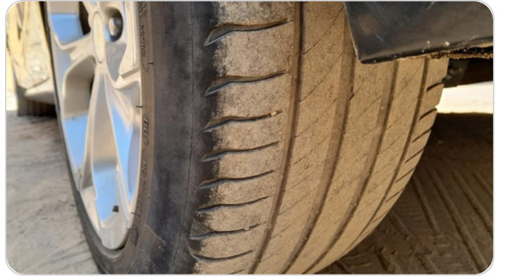
حالة الكاوتش الخلفي : النقشة متآكلة