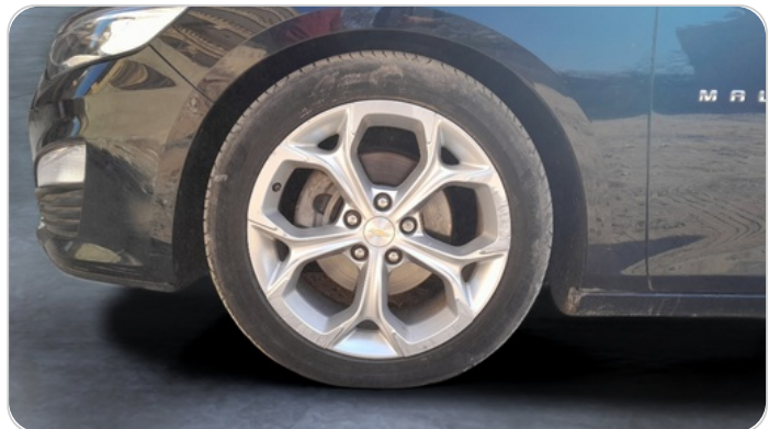
FR R TIRE