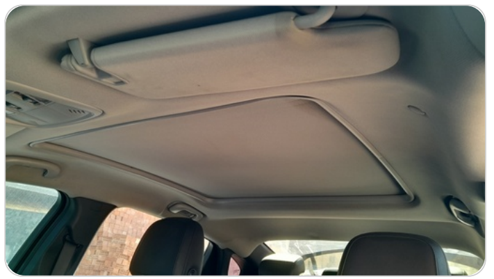
CAR ROOF MAT