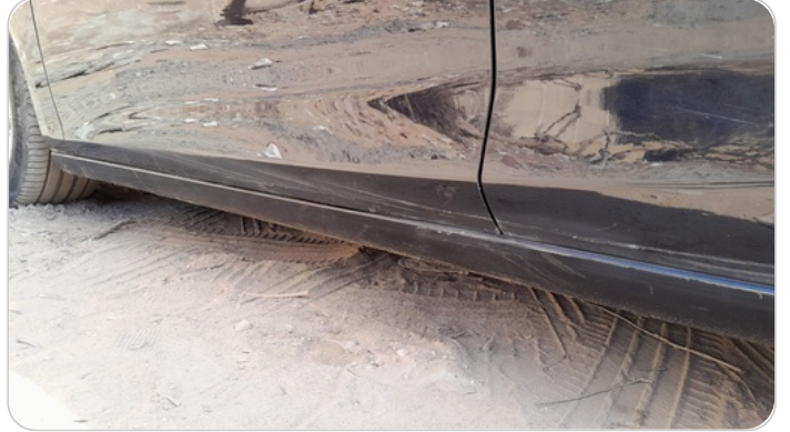
العتب السفلي شمال : فبريكة (خرابيش)