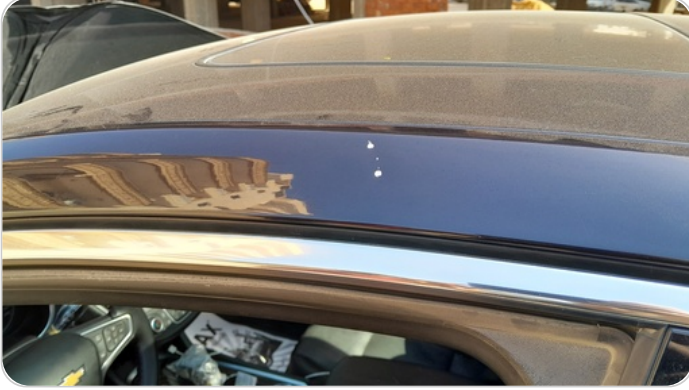
قائم خارجي أمامي شمال : فبريكة (خرابيش)